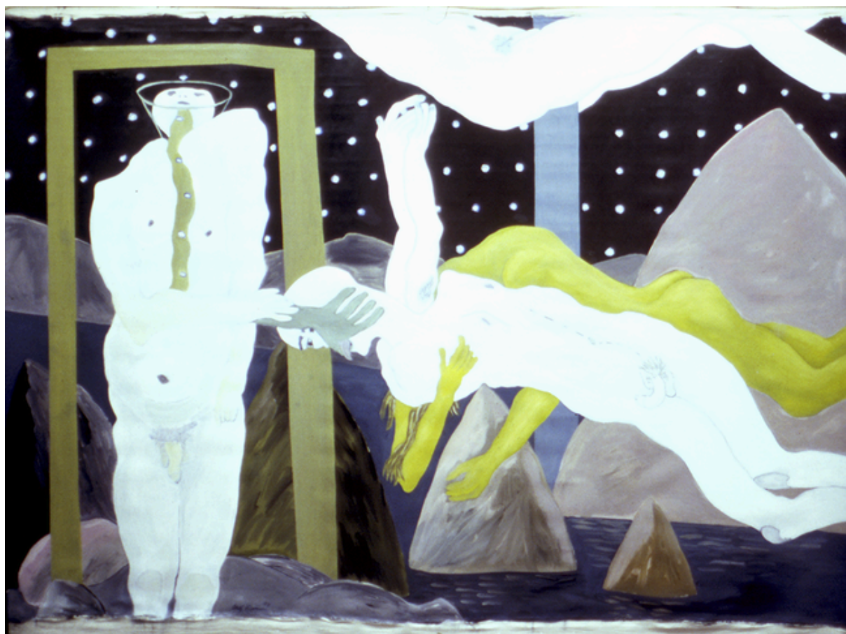
La expulsión del paraíso espacial