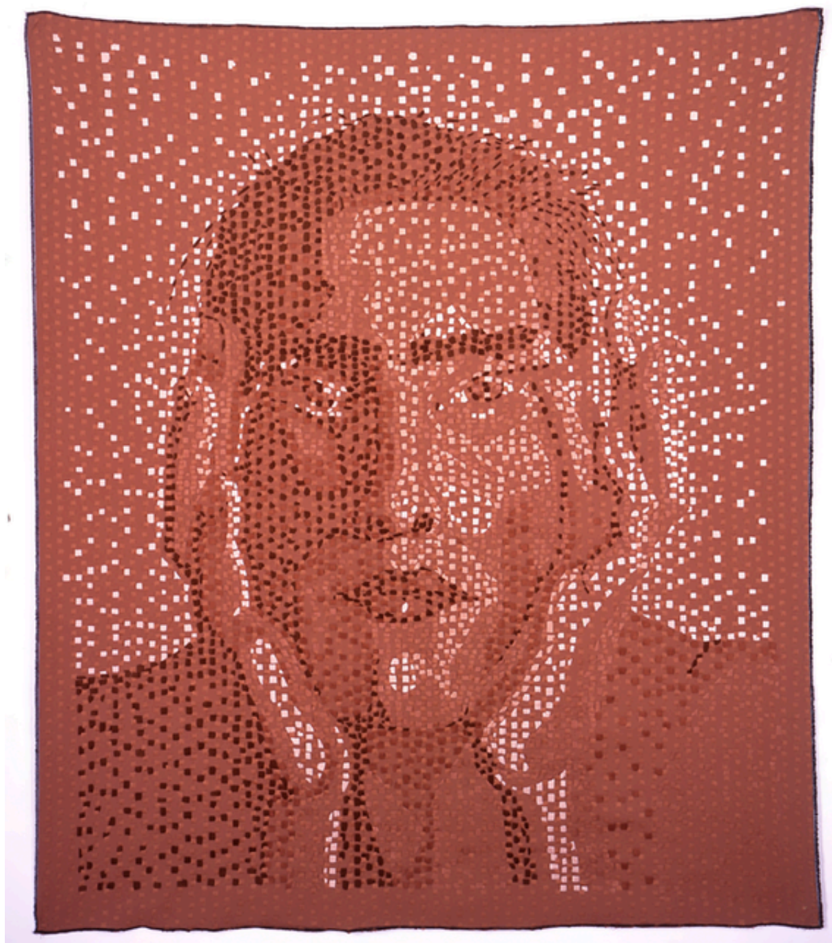
Autorretrato de puntos