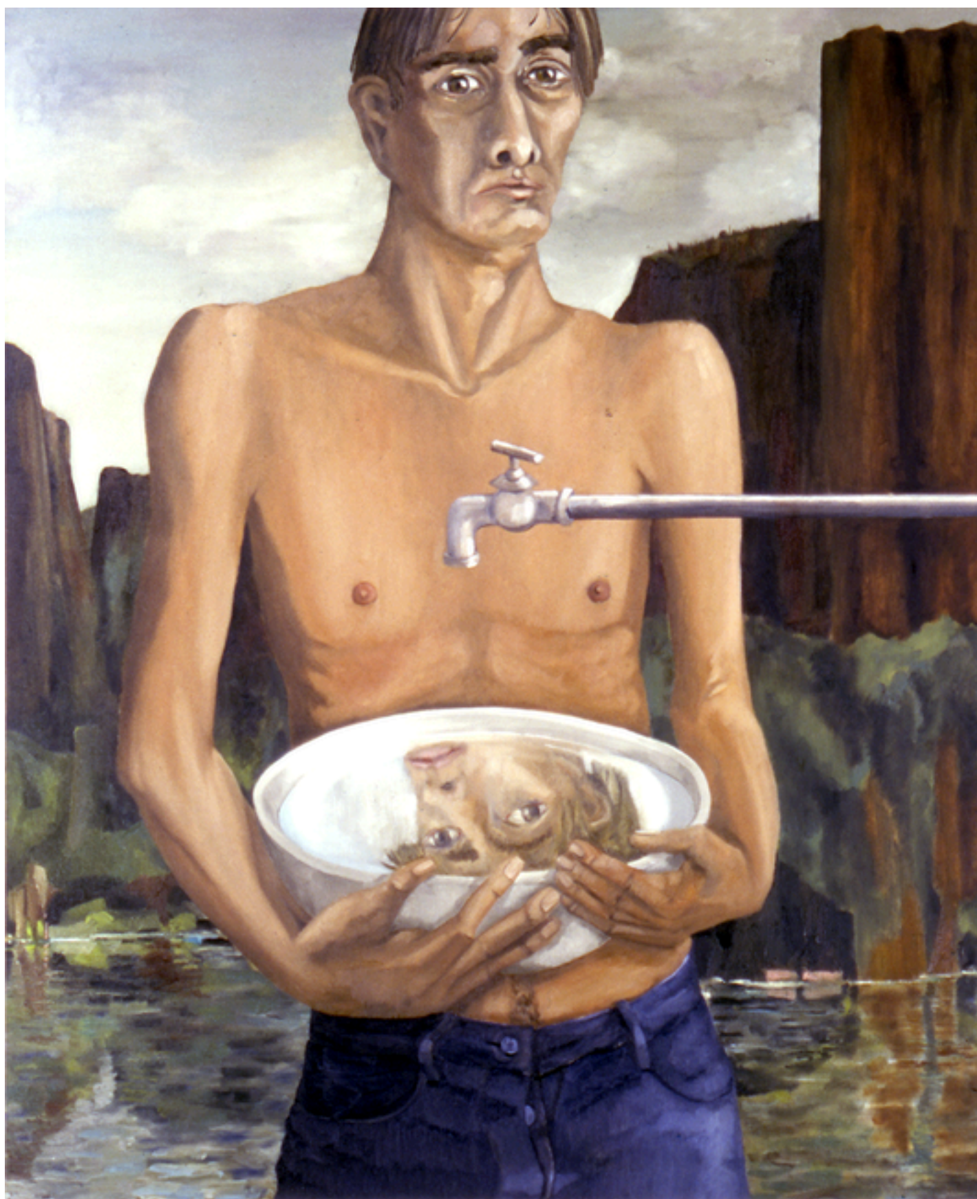
Autorretrato como Narciso