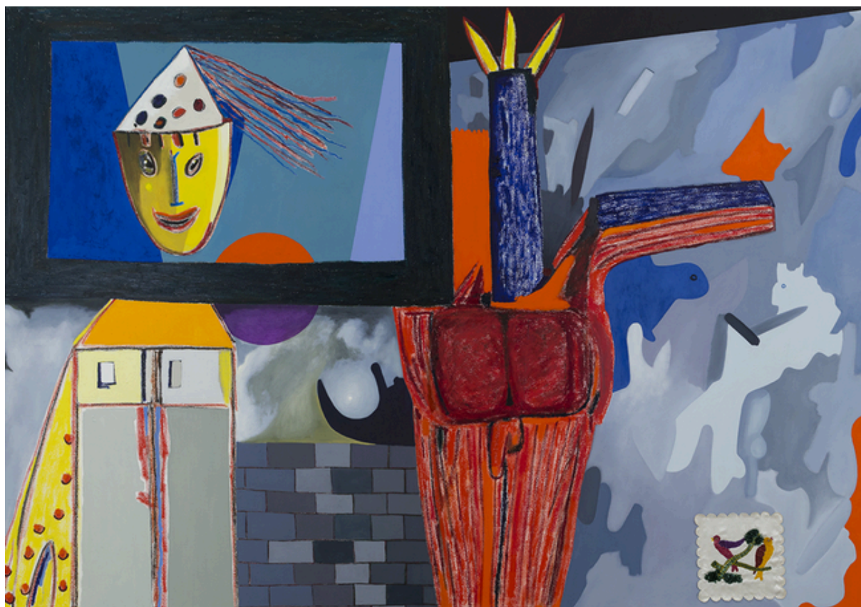
Yo, casa cumpleaños