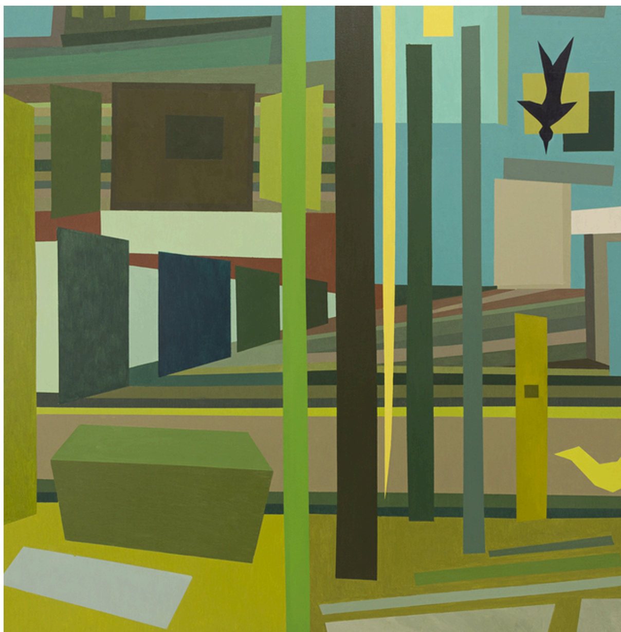
Paisaje de verdes con masquing-tape