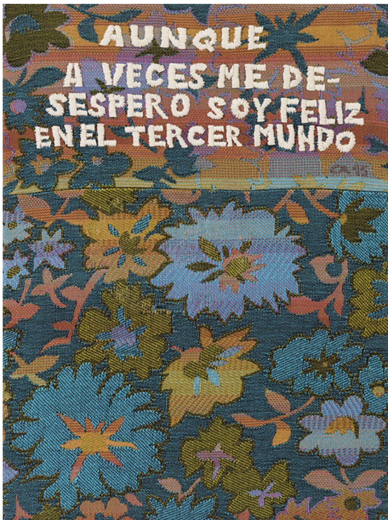
Aunque a veces me desespero