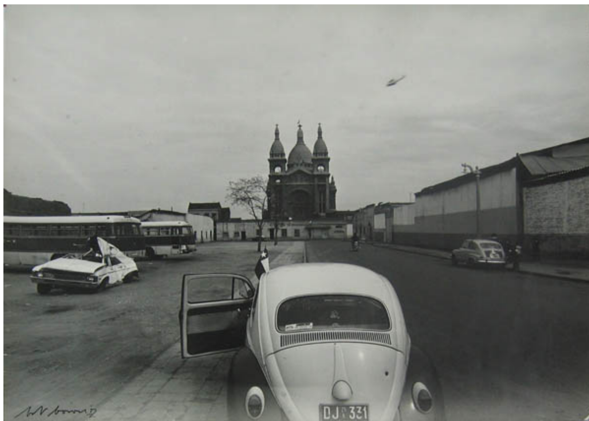
Un 18 surrealista