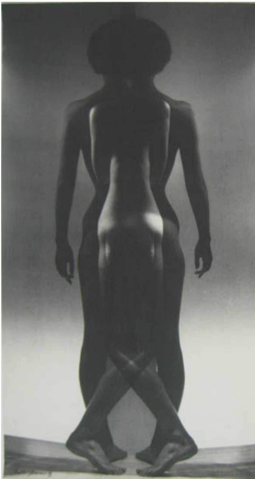
Milonga en negro