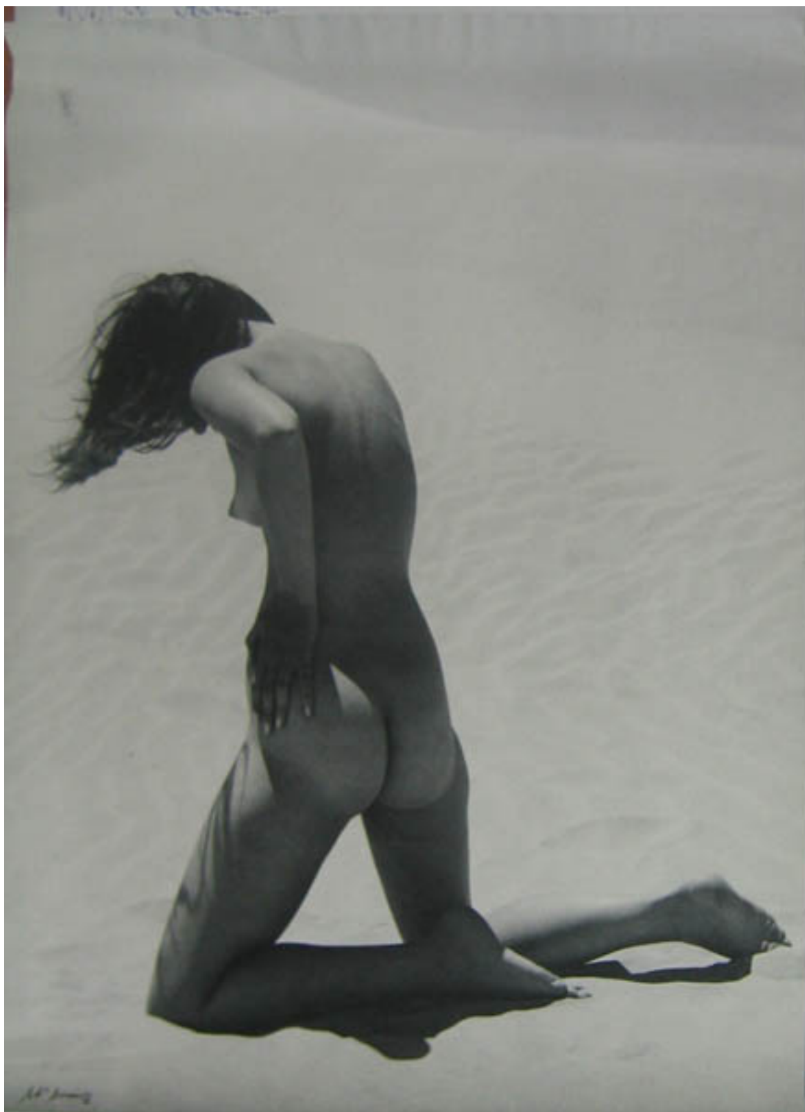
La mujer del desierto