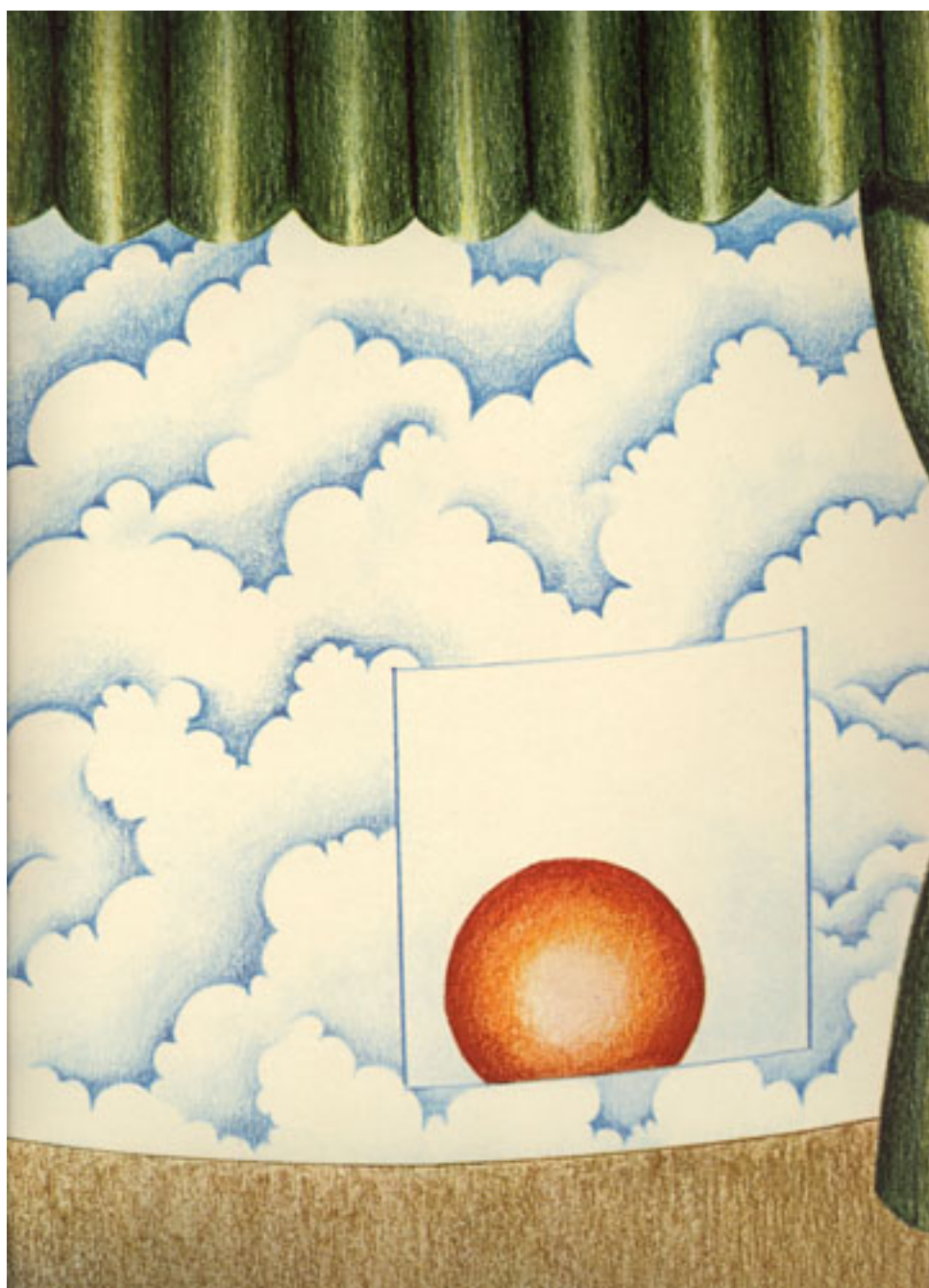
SIN TÍTULO (detalle)