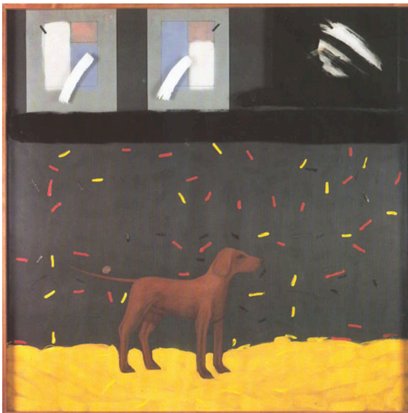
POLÍPTICO IMAGEN VERDADERA OBJETO CANON