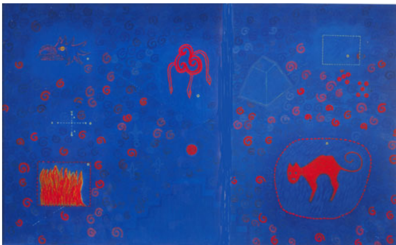
DE LA SELECCIÓN AITLAN