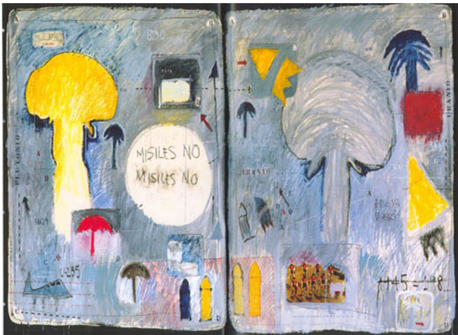
MIRA UN PARACAIDAS II