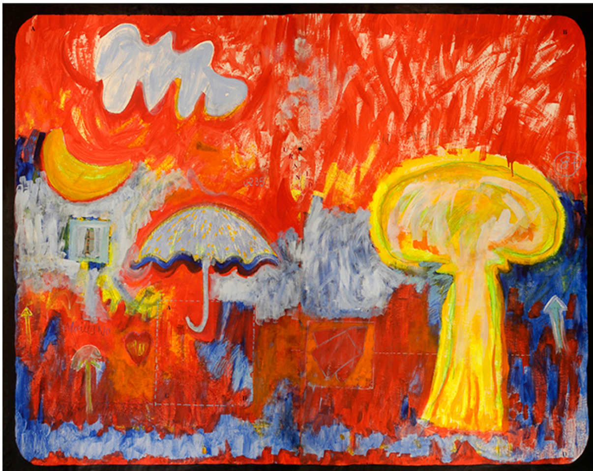
DE LA SERIE LITTLE BOY