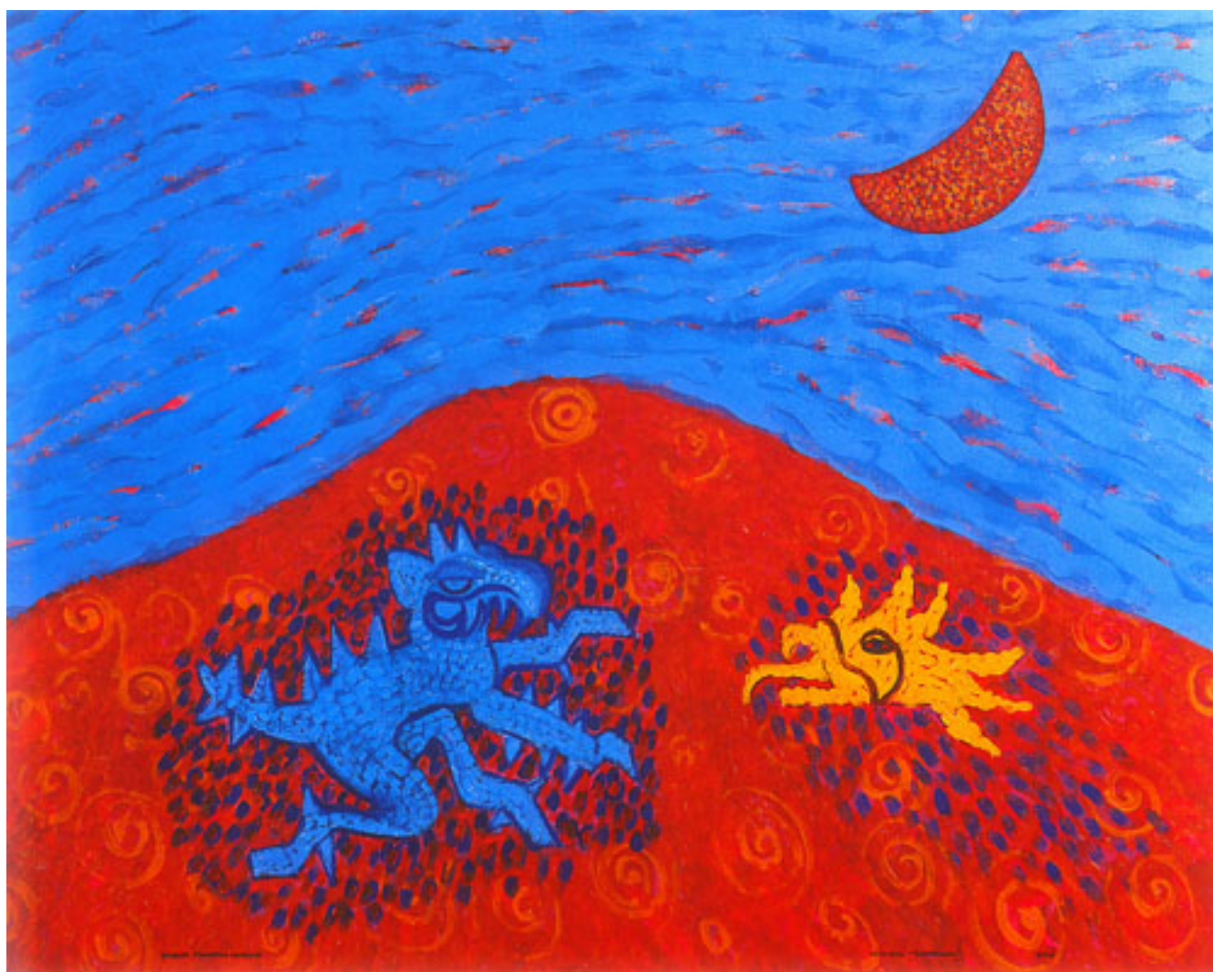
DE LA SERIE INFRAMUNDO