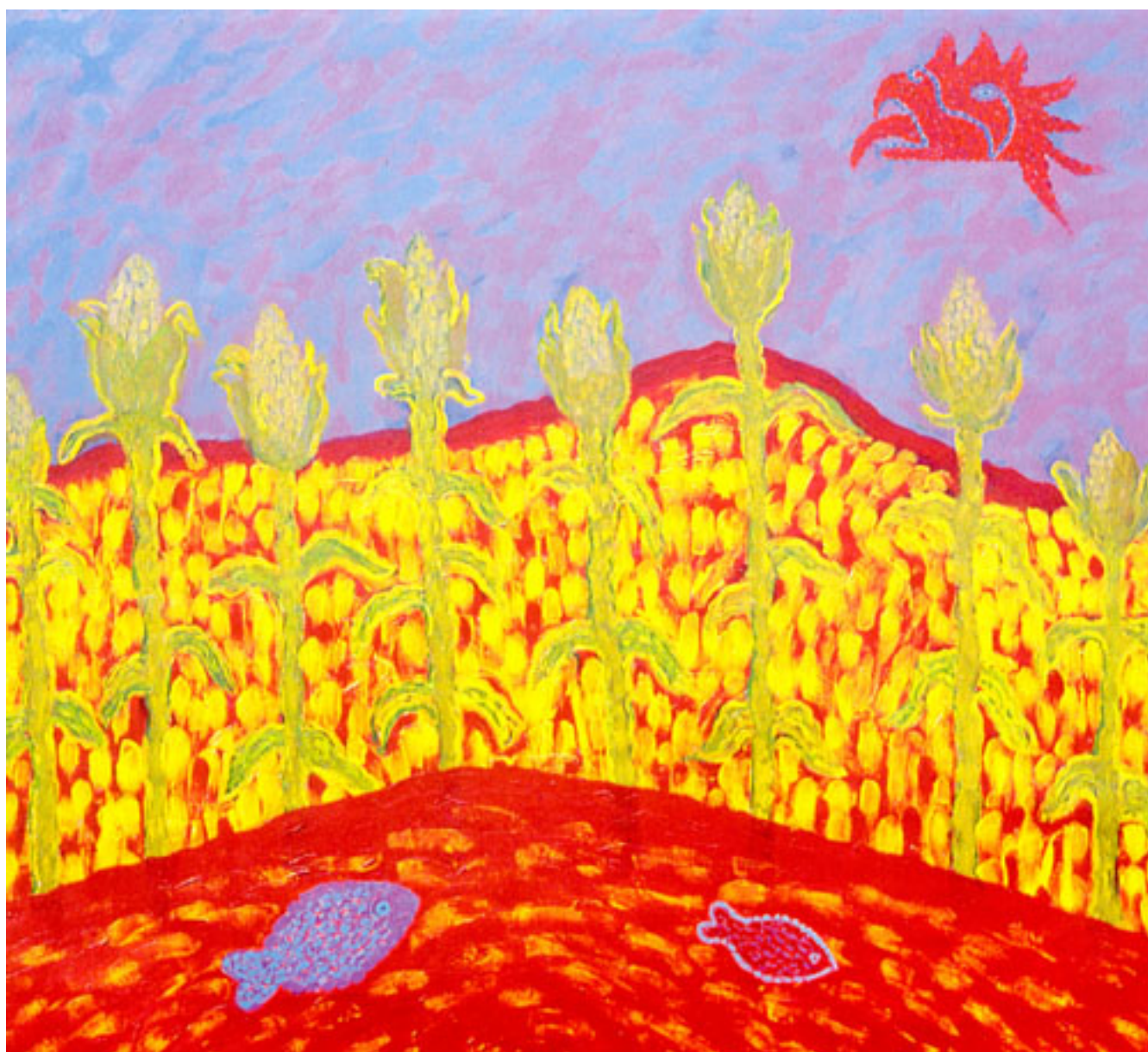
HOMENAJE A AMÉRICA