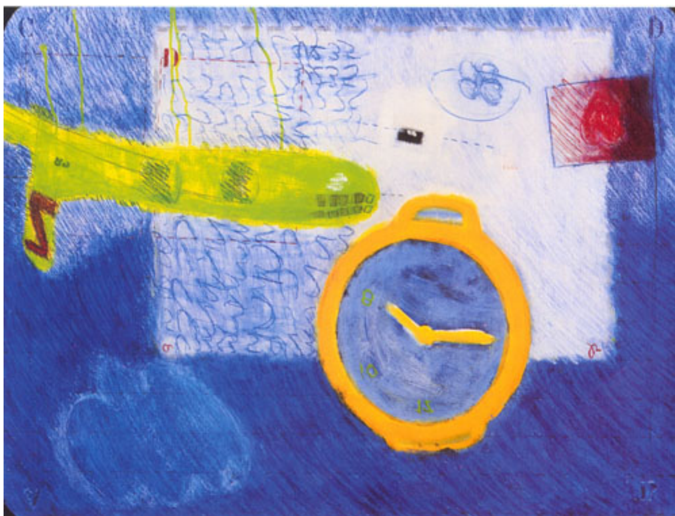
SIN TÍTULO DE LA SERIE ENOLAGAY