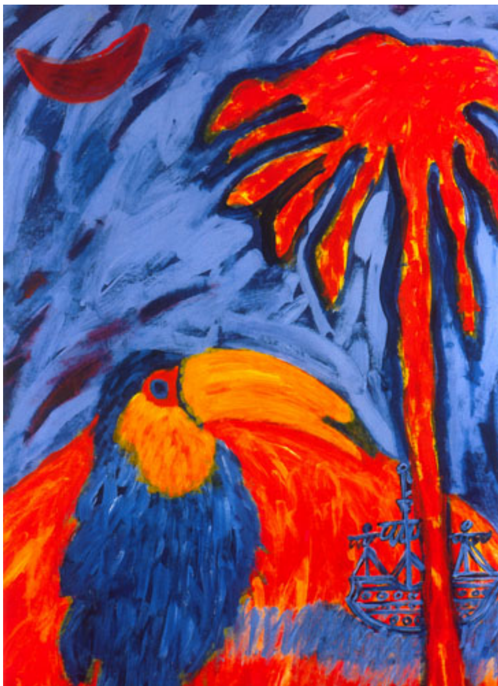
TUCÁN DE LA SERIE BUSCANDO AMÉRICA