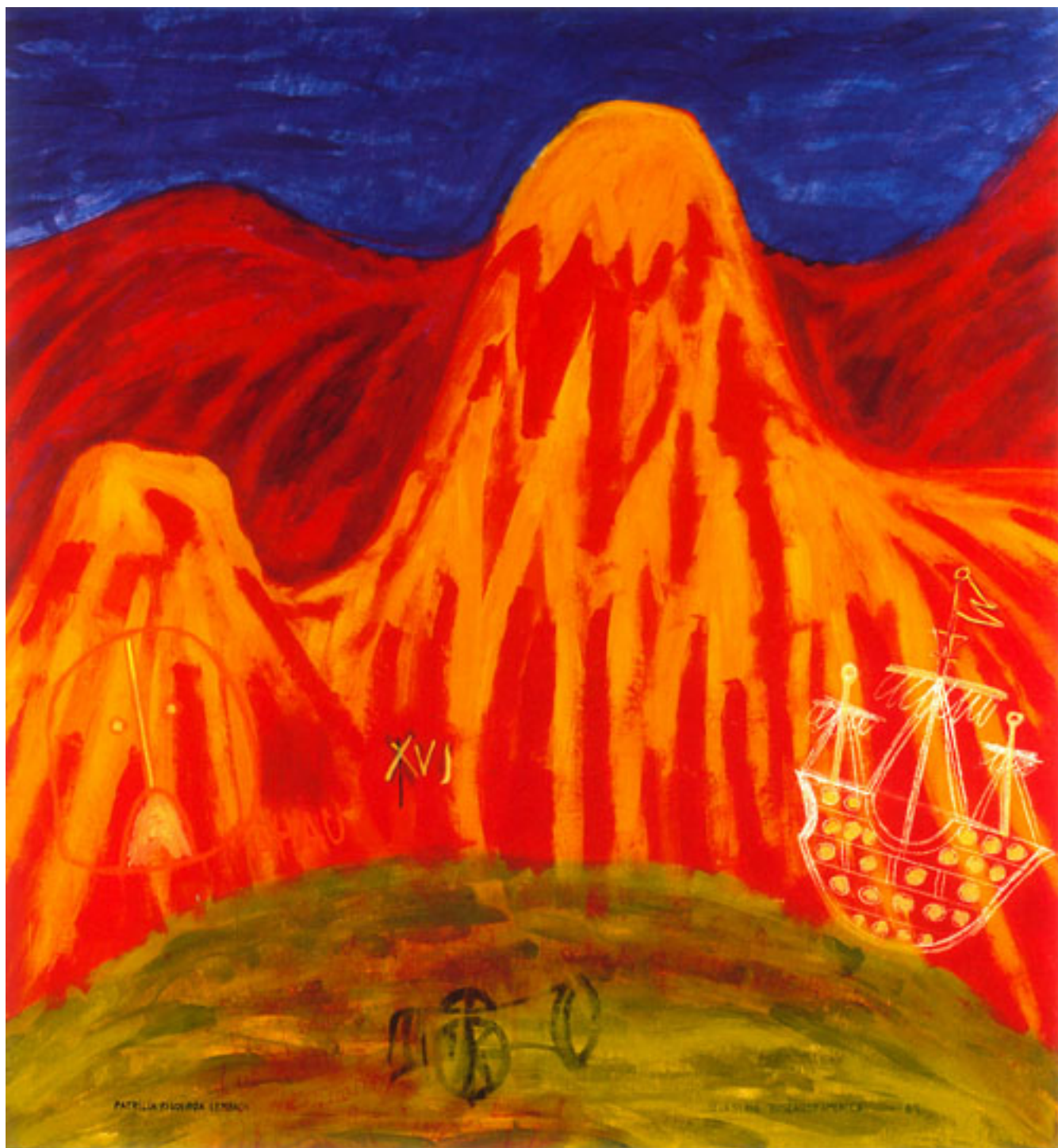
DE LA SERIE BUSCANDO AMÉRICA