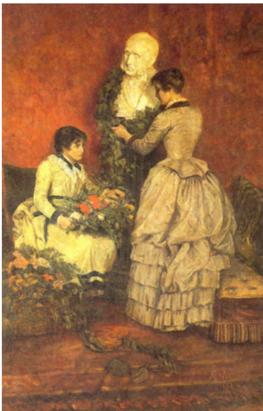
RINCÓN DE SALÓN