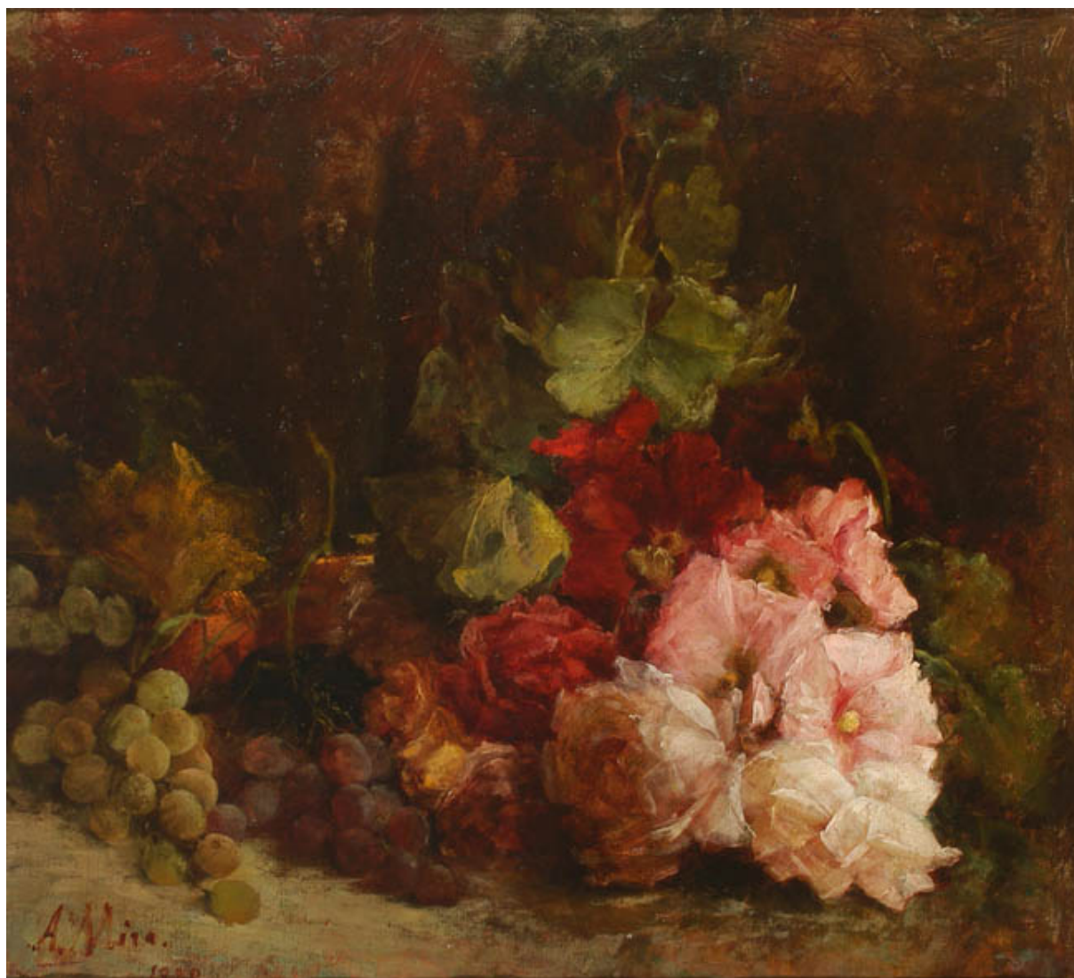
FLORES Y FRUTAS