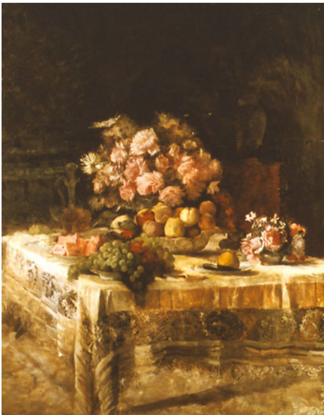
MESA DE COMEDOR