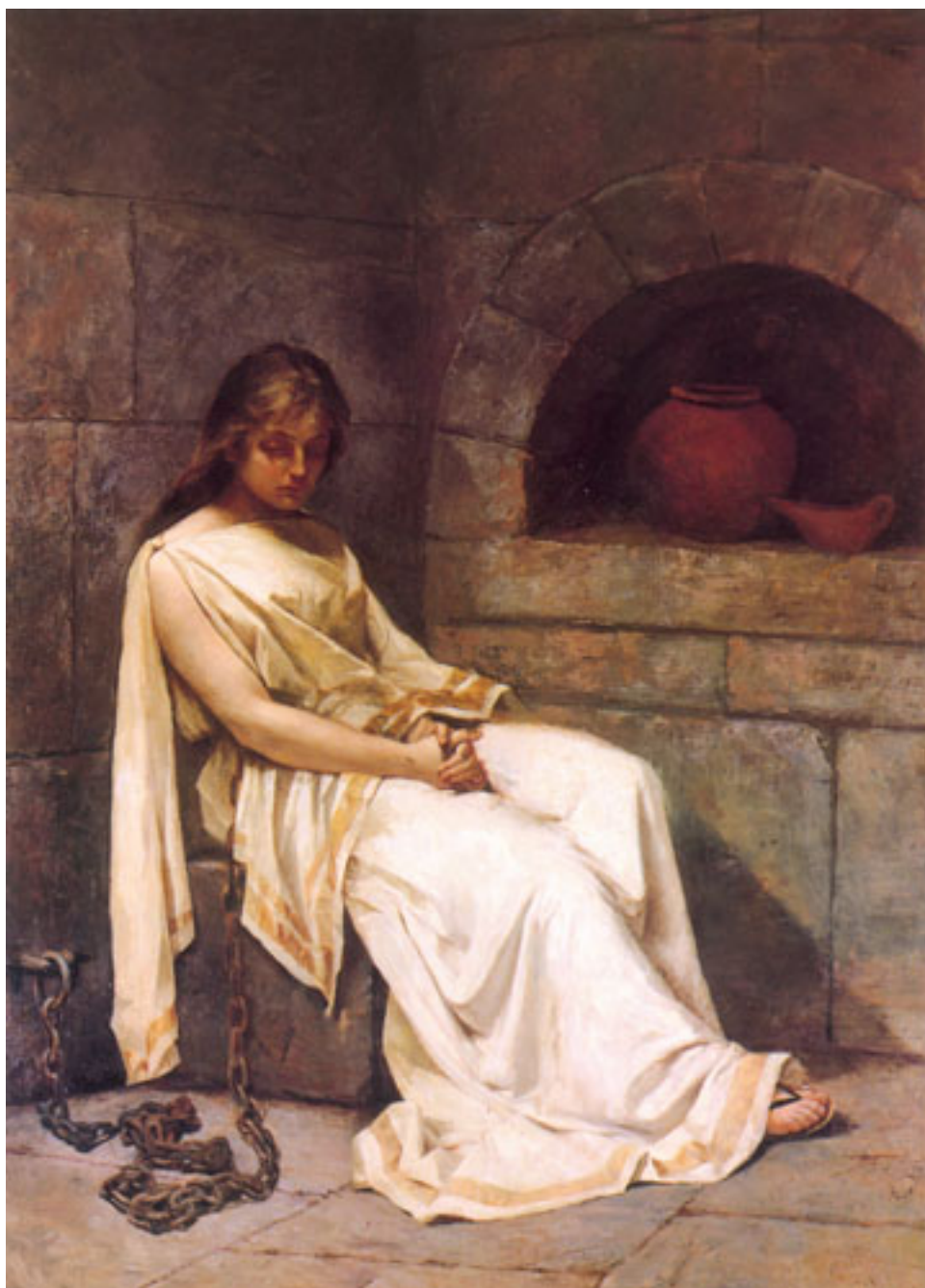
AGRIPINA METELA ENCADENADA