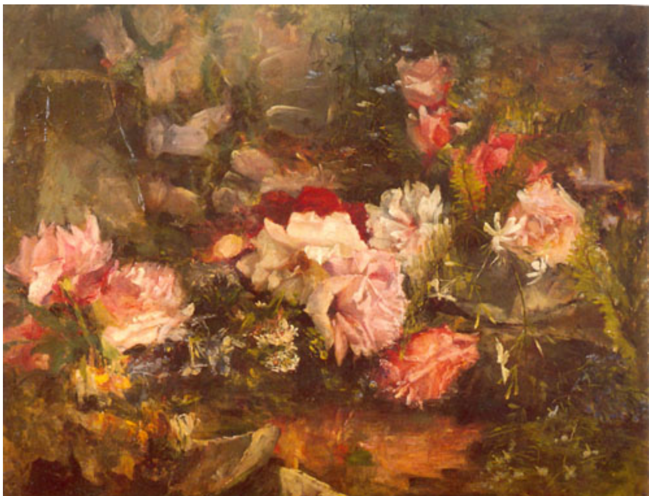
ROSAS Y ROCAS