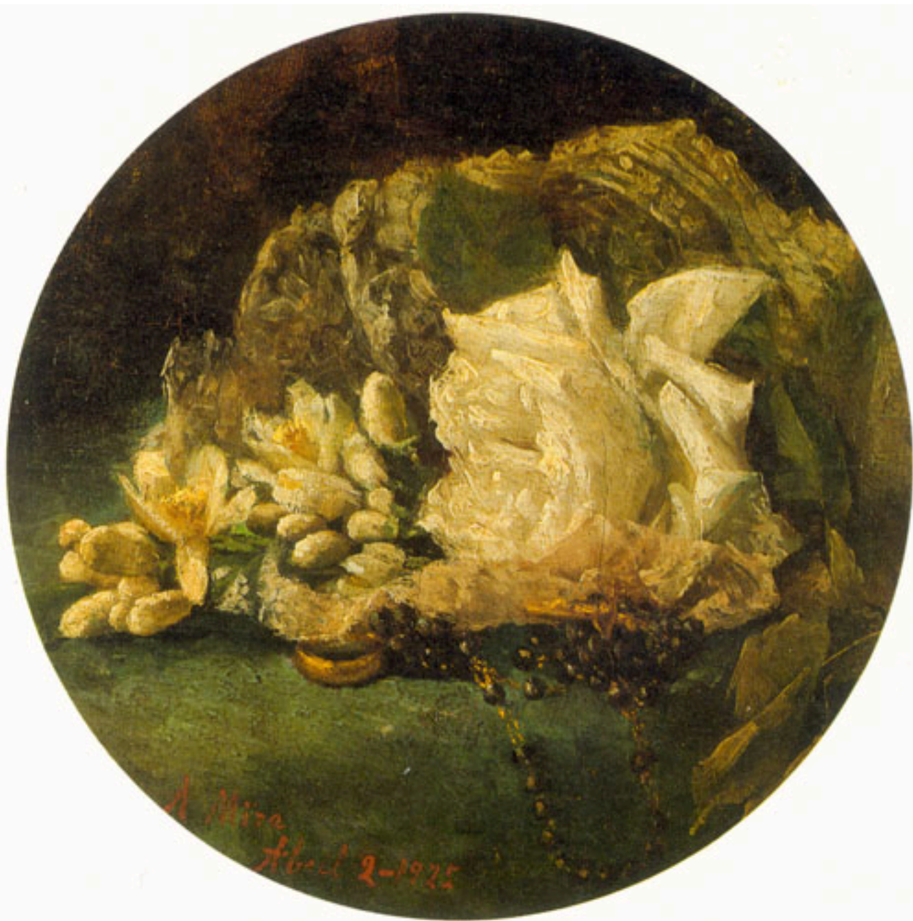
RAMO DE NOVIA