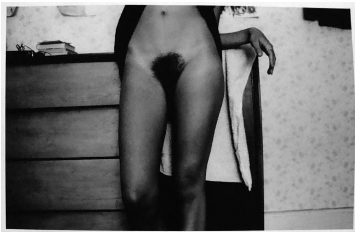
DE LA SERIE DESNUDOS 2