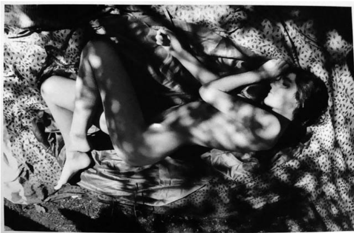
DE LA SERIE DESNUDOS 3