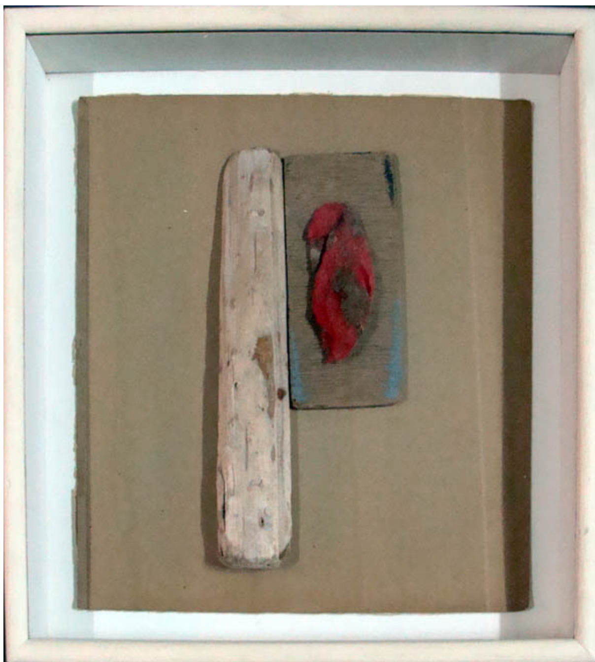
SIN TÍTULO: C