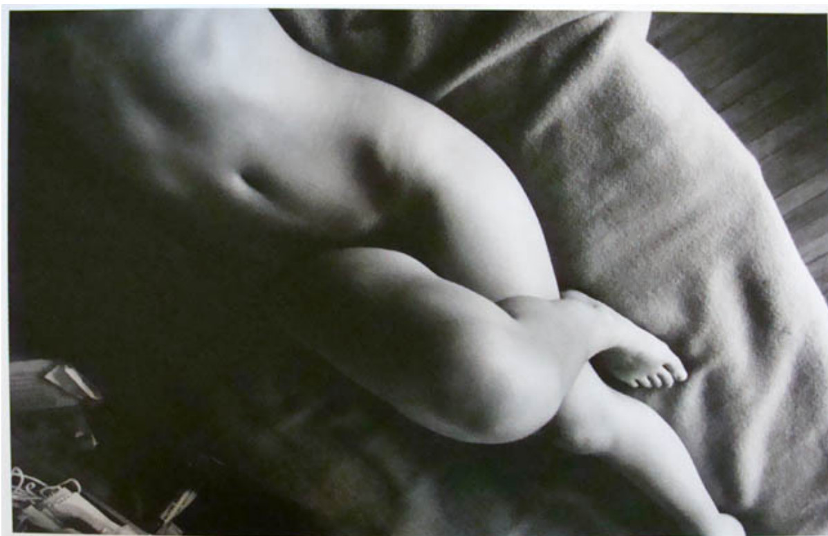
DE LA SERIE DESNUDOS 5