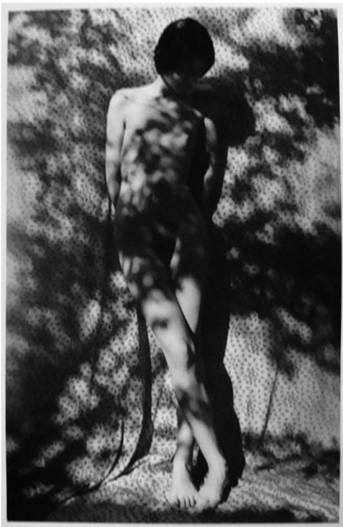
DE LA SERIE DESNUDOS 7