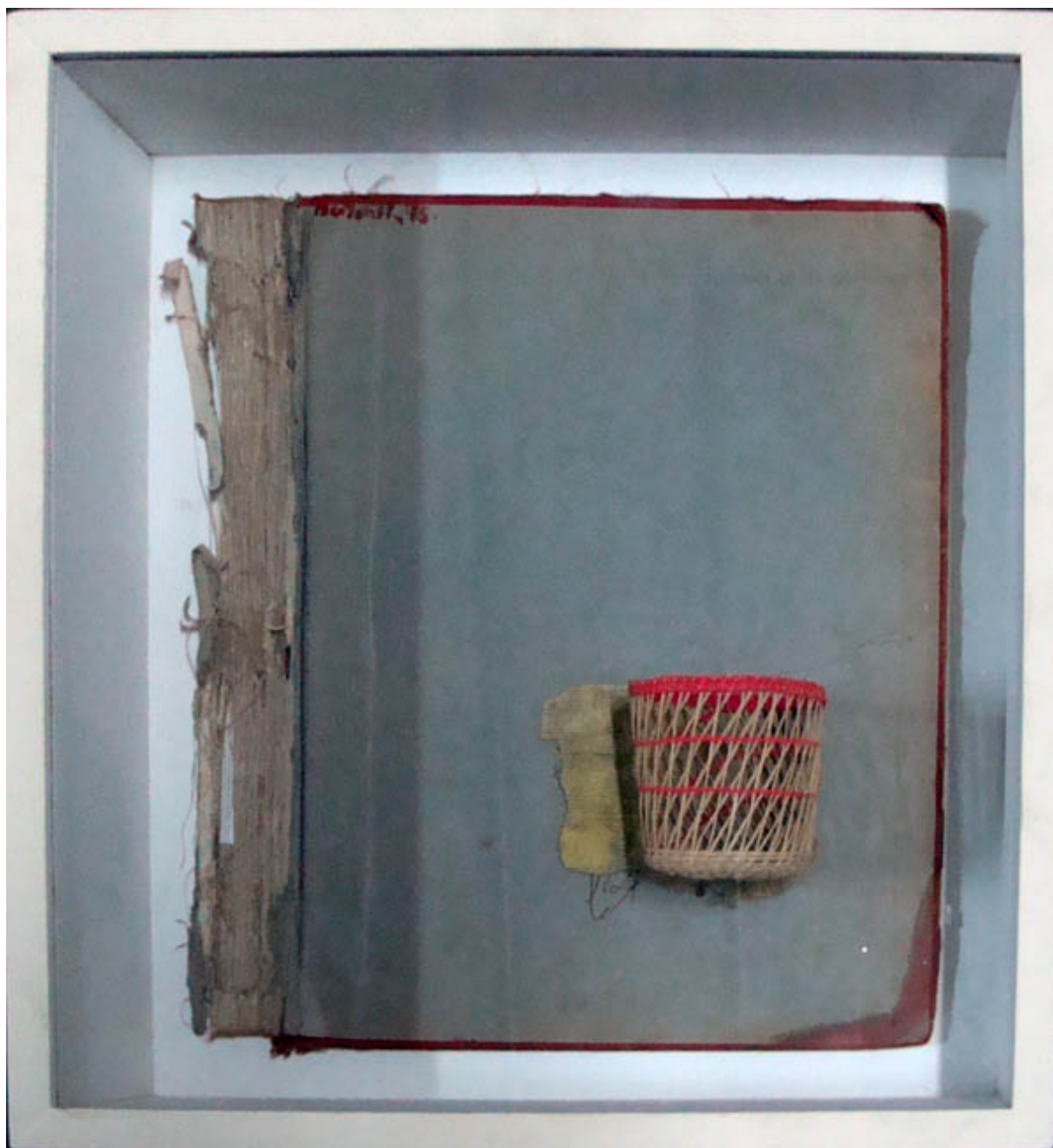
SIN TÍTULO: B