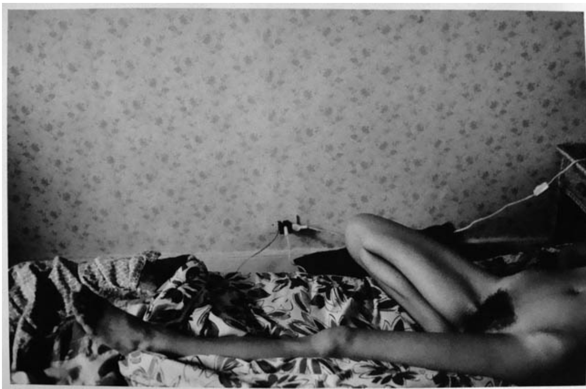
DE LA SERIE DESNUDOS