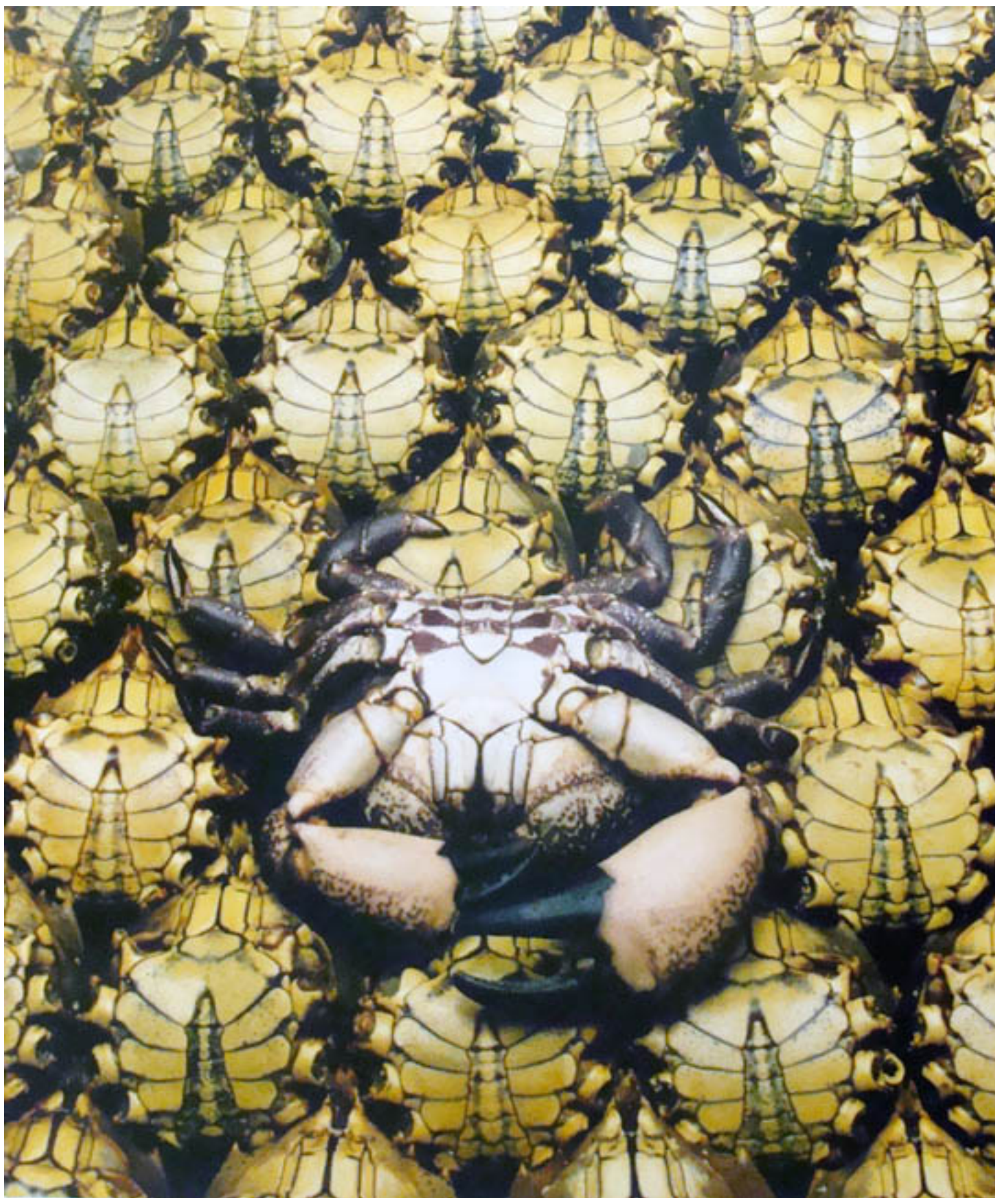
MUTILACIÓN, ARMA DE DOBLE FILO