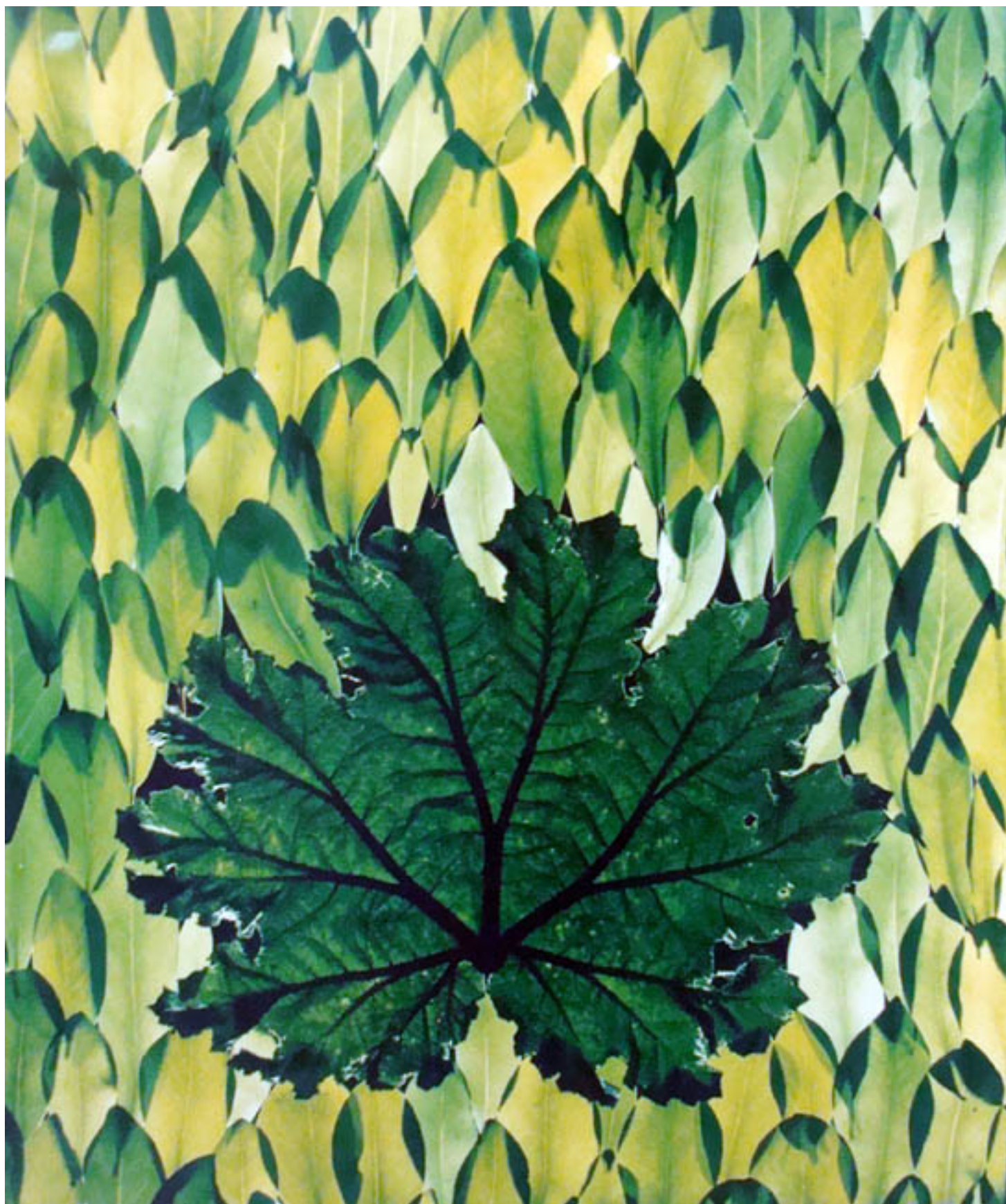
LAS GRANDES HOJAS, EL VERDE INVADE EL ESPACIO