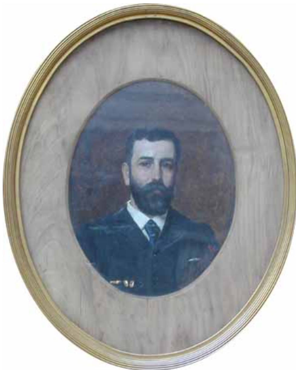
RETRATO DE DON GENARO BENAVIDES