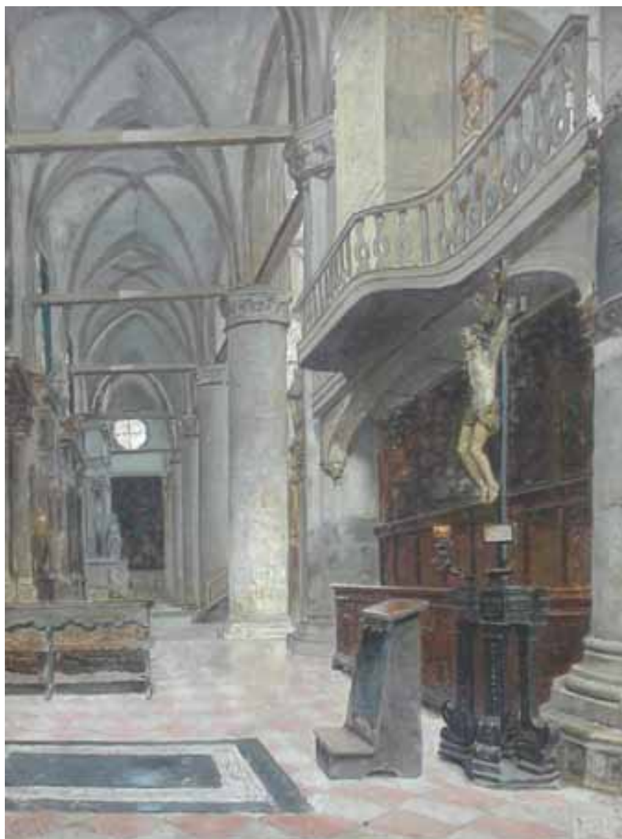
INTERIOR DE IGLESIA