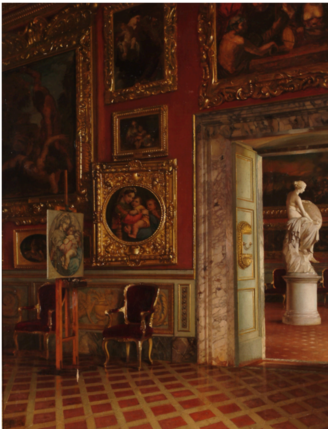
INTERIOR DE LA GALERIA PITTI