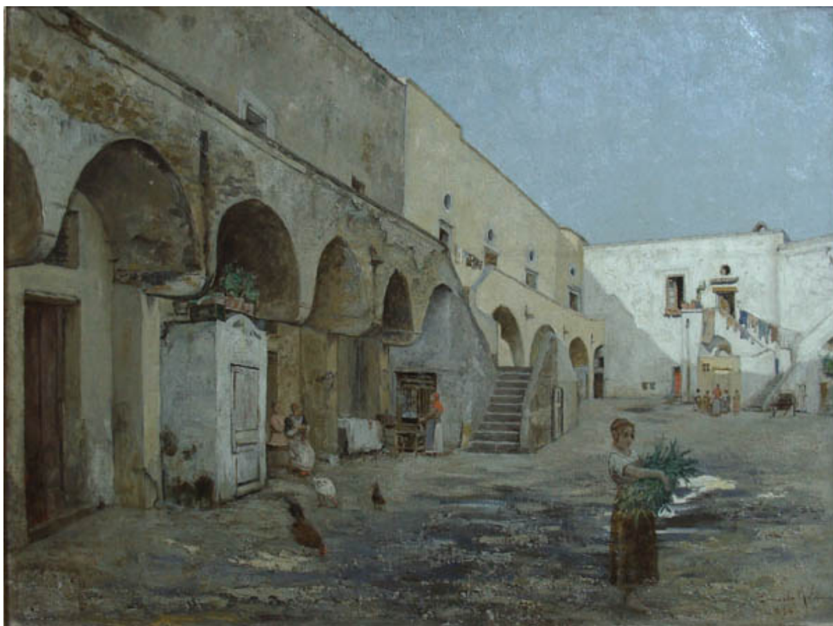
PATIO DE NÁPOLES