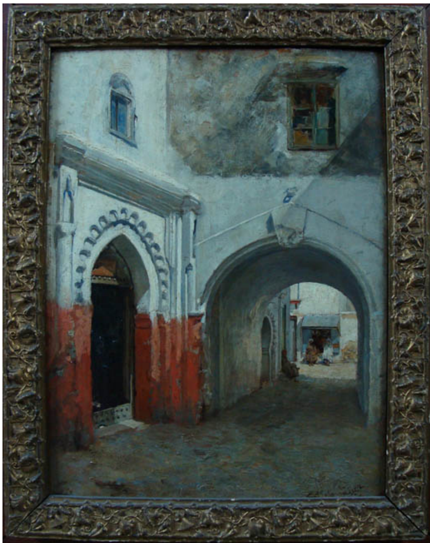
CALLE DE TANGER