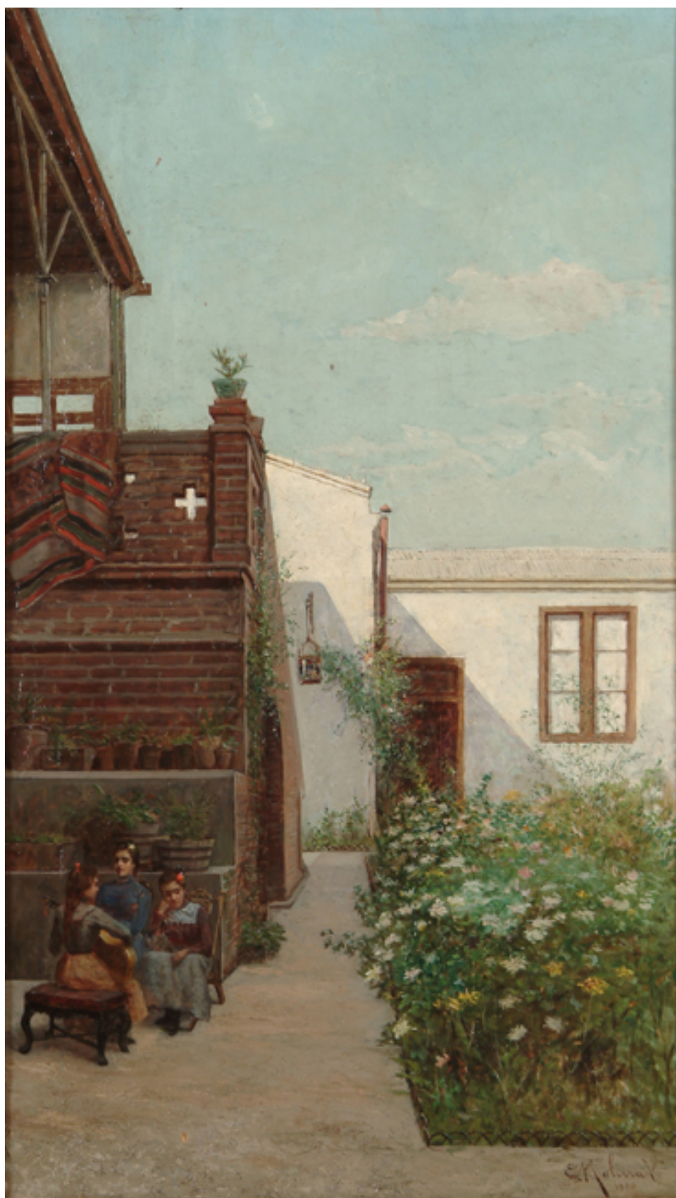
ENTRADA AL TALLER