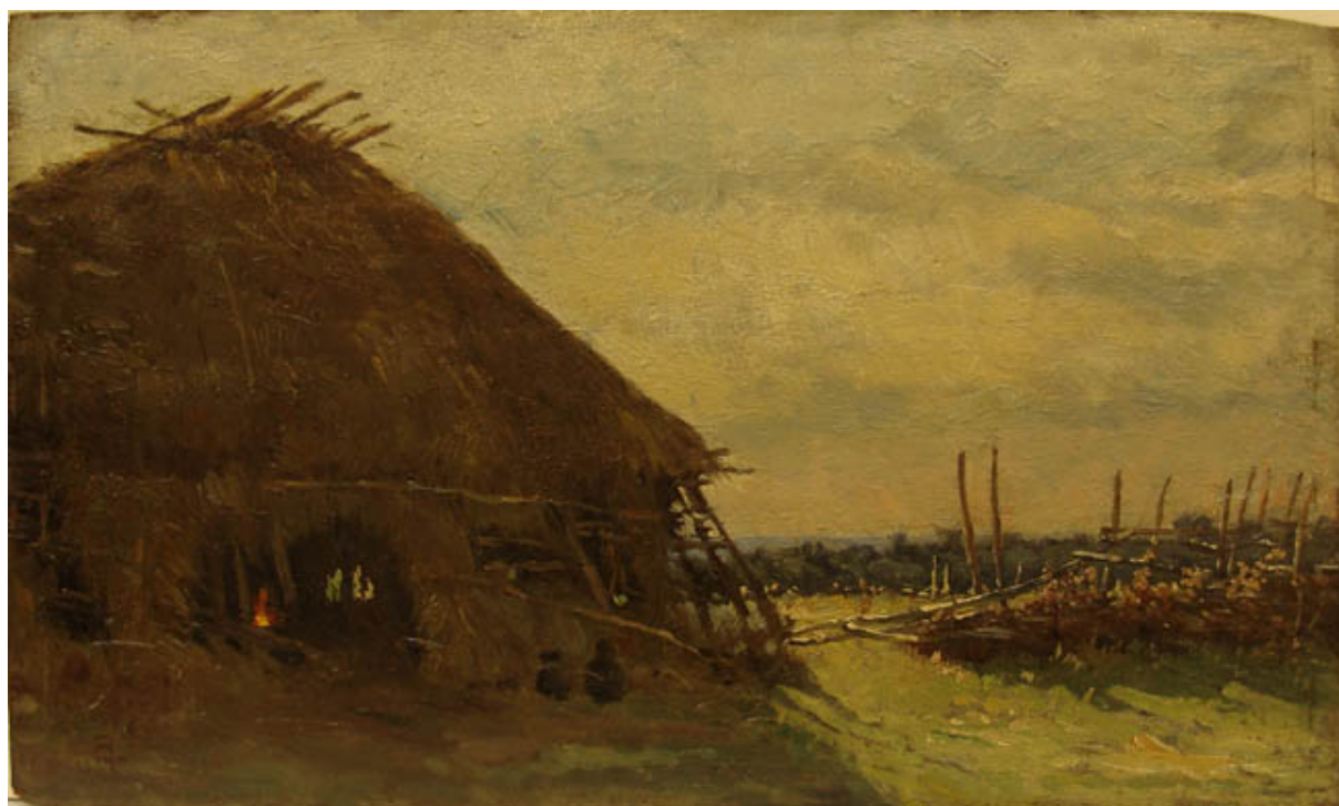
LA RUCA ARAUCANA