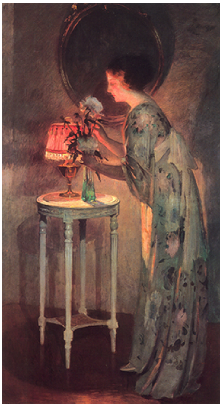
DAMA FRENTE A UNA LAMPARA