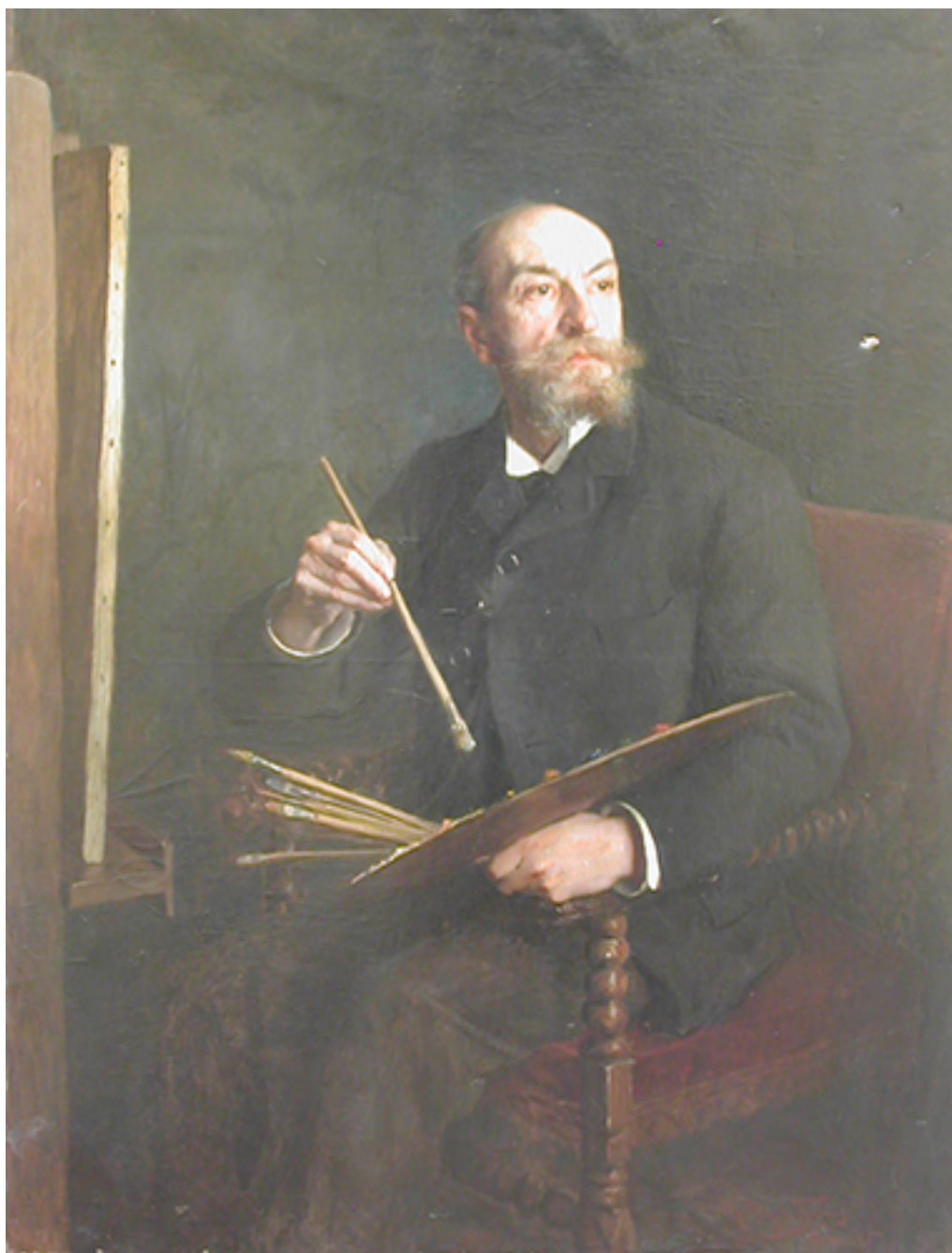
RETRATO DEL PINTOR FRANCÉS M. LE POITTEVIN