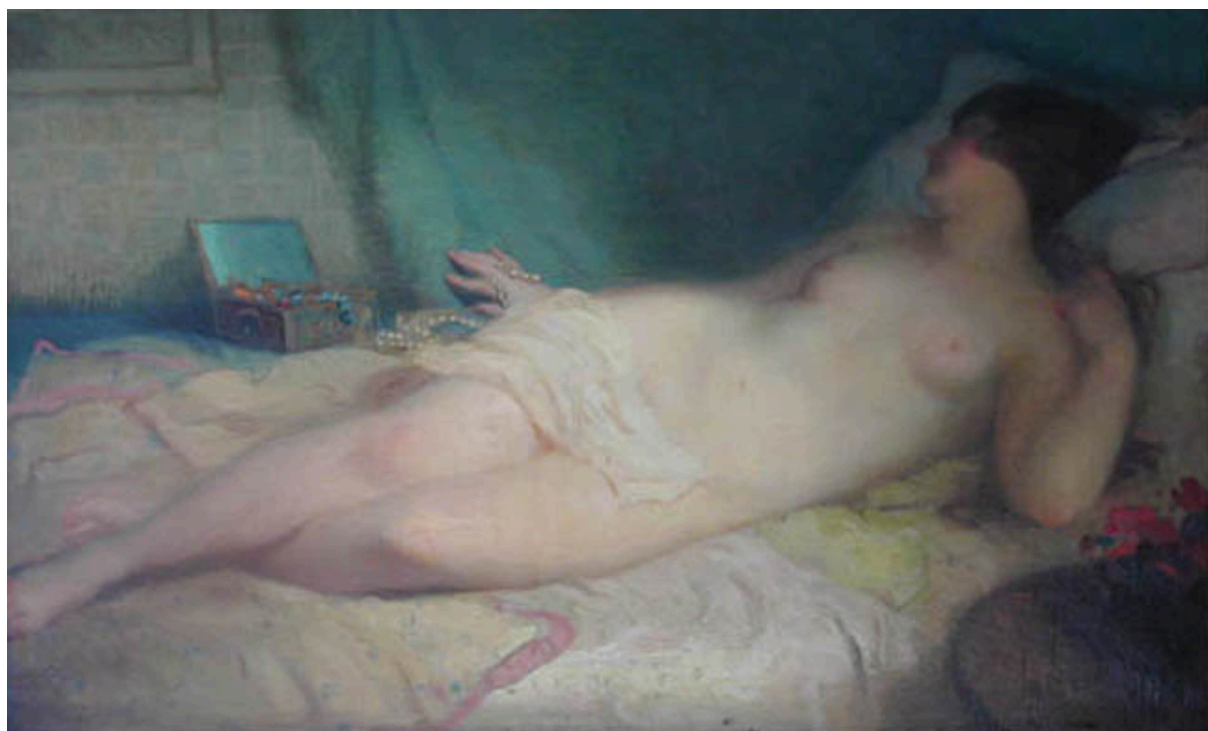
DESNUDO DE MUJER