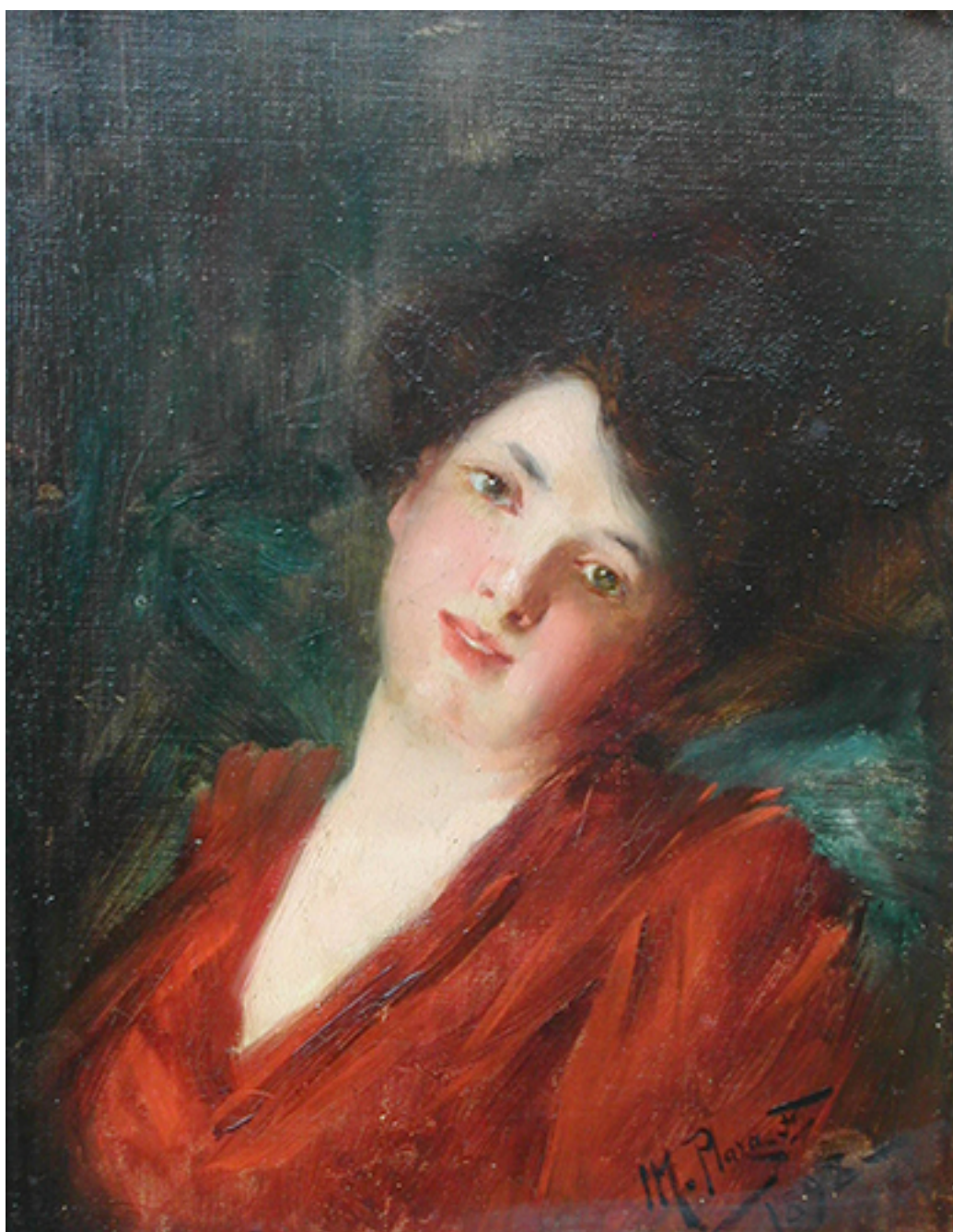
CABEZA DE NIÑA

ZAMORANO PEREZ Pedro, CORTÉS LOPEZ Claudio y MUÑOZ ZÁRATE Patricio, 2006. Pintura chilena 1920-1960: algunas categorías y periodizaciones. Universum [en línea]. Talca: Universum, vol. 1, no. 21 pp. 2 -29 [consulta junio de 2018] Disponible en: https://scielo.conicyt.cl/scielo.php?script=sci_arttext&pid=S0718-23762006000100013