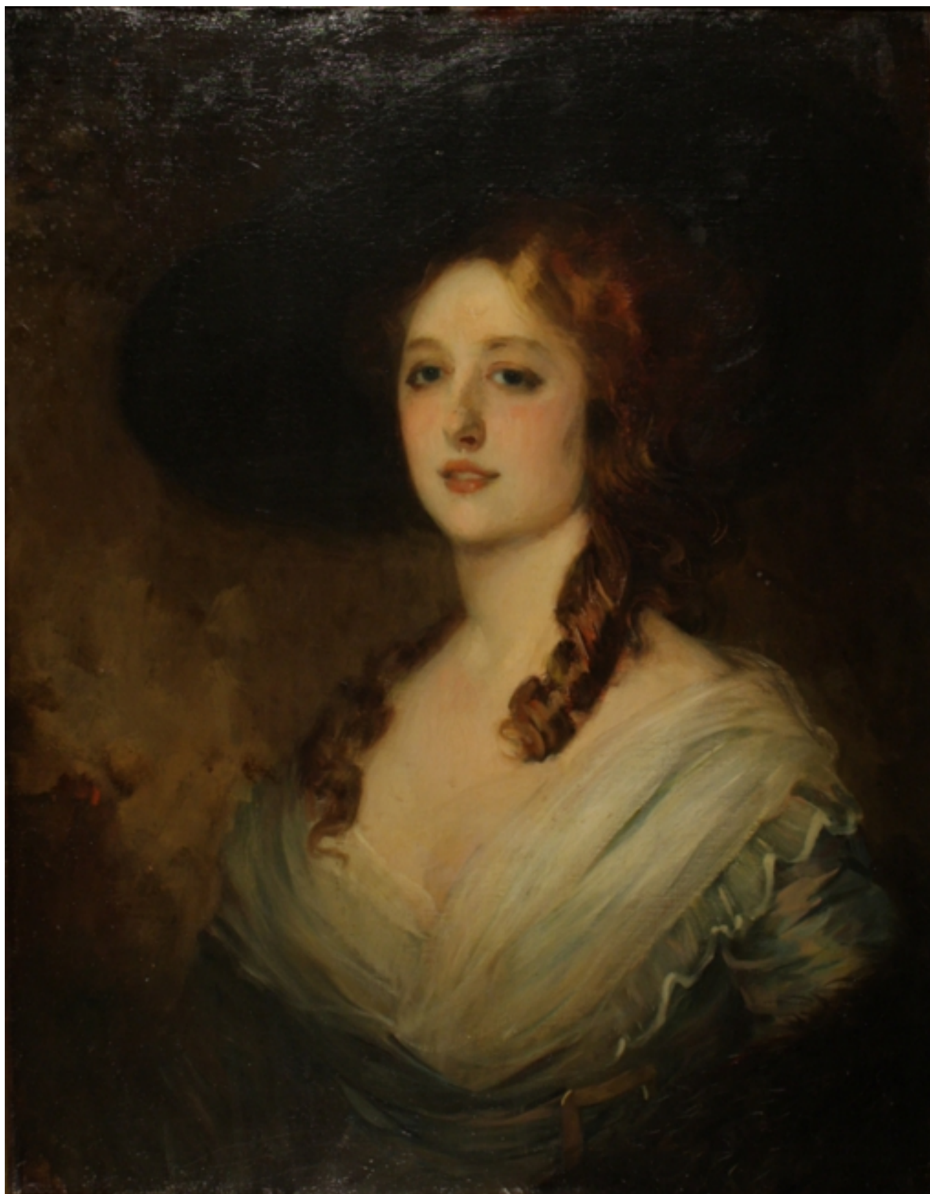
RETRATO DE SEÑORA