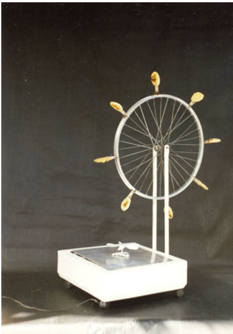
CUANDO DUCHAMP Y TINGUELY TOMARON ONCE EN SANTIAGO DE CHILE