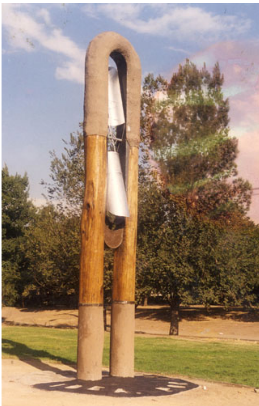
POR AQUÍ PASA LA IDEA

BIBLIOTECA/MNBA. Colección de Artículos de Prensa del Artista RODRIGO PIRACÉS publicados en los diarios y revistas entre 1994-2011.