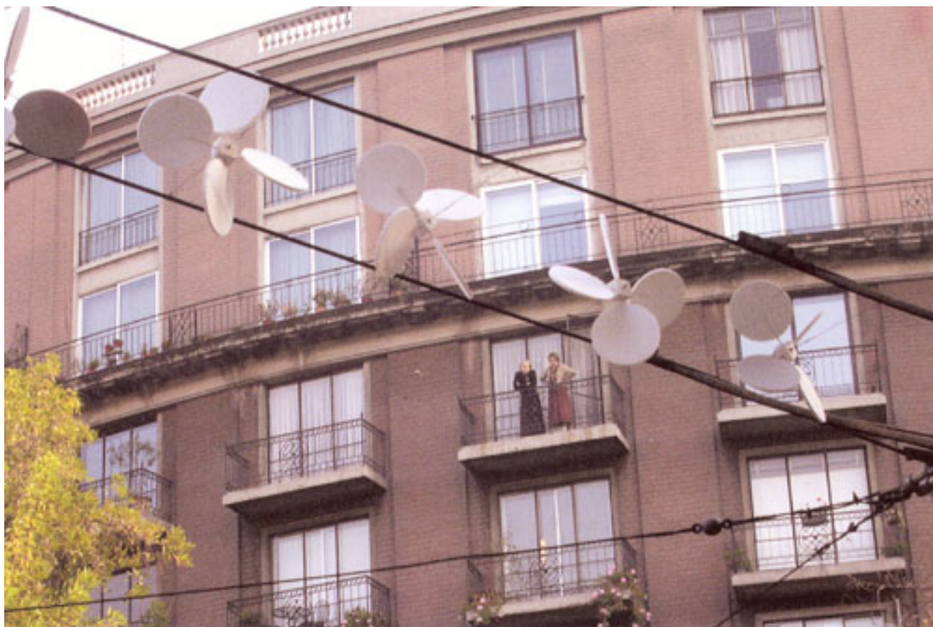
KARMICA PROYECTO QUINTRAL (Registro de la intervención)