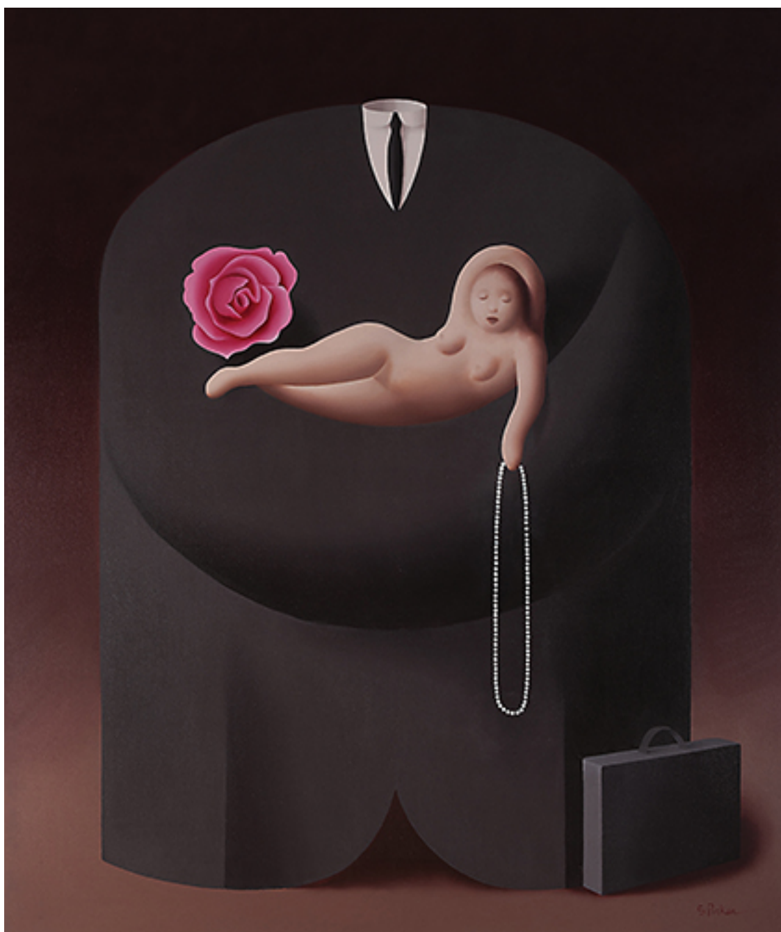
AMOR Y DINERO