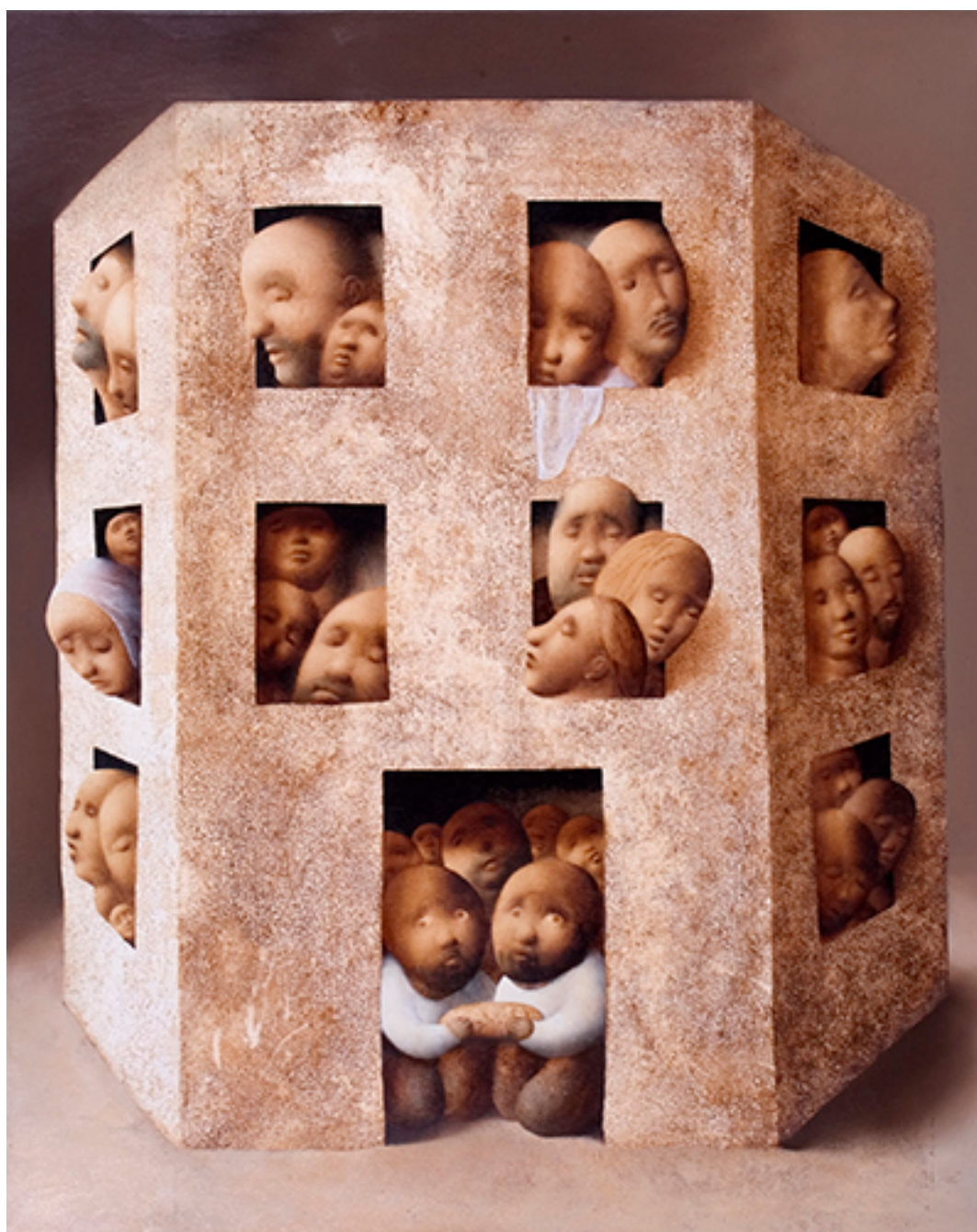
COMO SUBE TODO

BIBLIO/MNBA. Colección de Artículos de Prensa del artista Sebastián Picker, publicados en diarios y revistas entre 1970 - 2012.