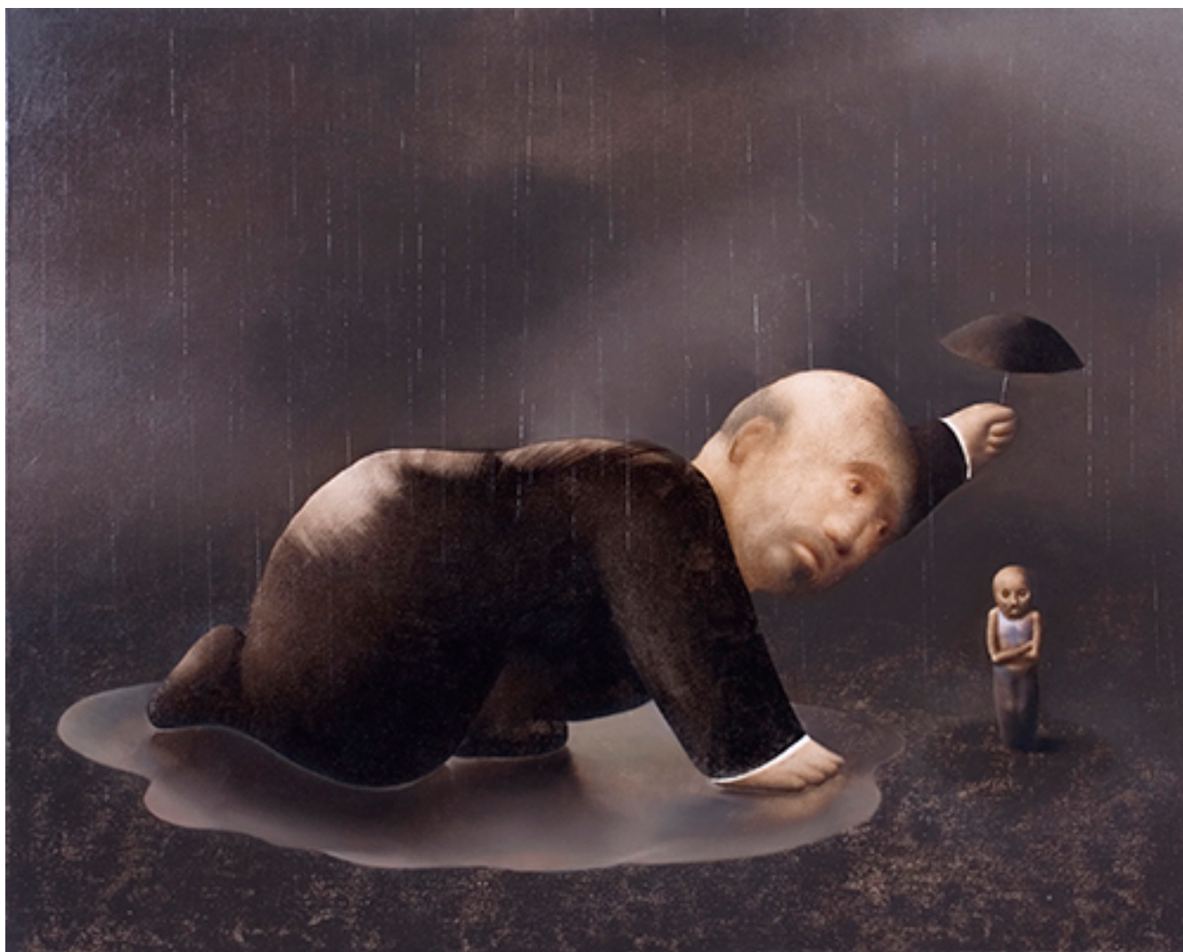
EL PLACER DE LA BONDAD