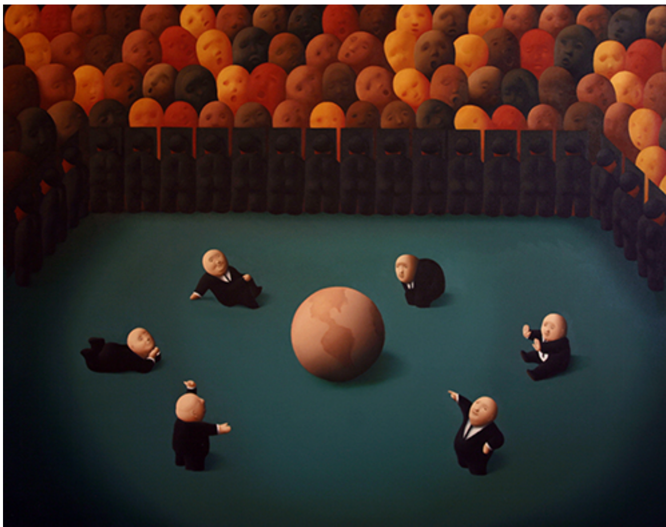
EL OTRO MUNDIAL