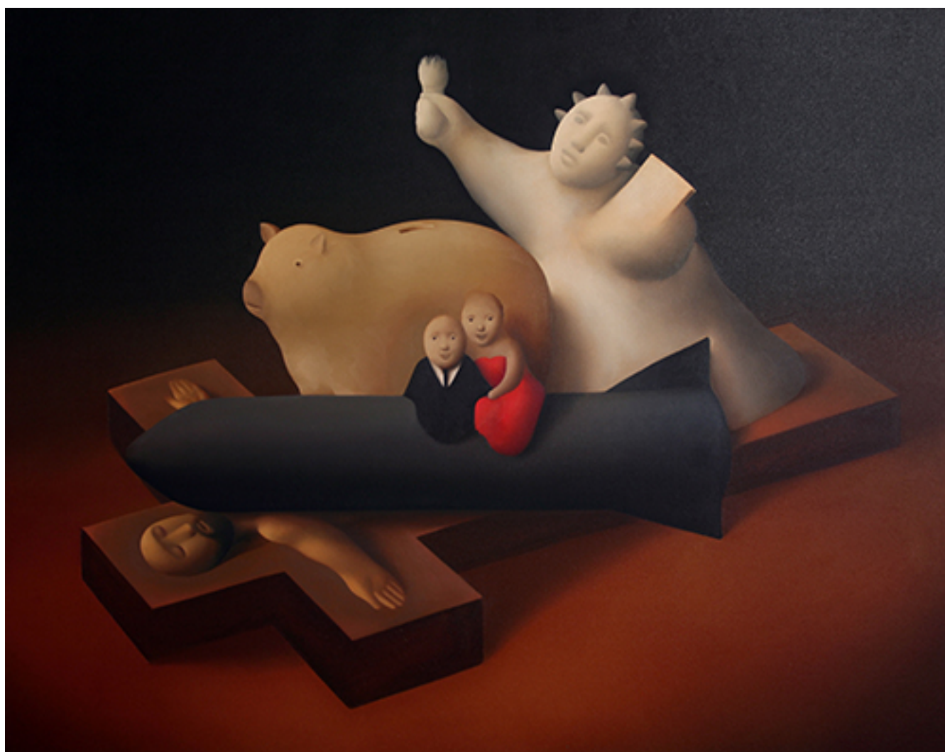
EL TRIUNFO DE LA BUENA APARIENCIA