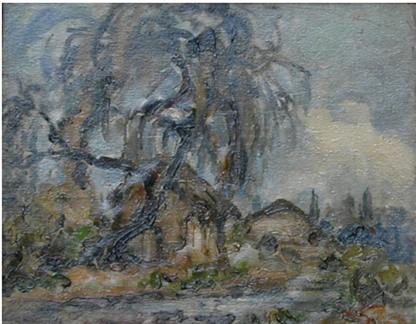
PAISAJE DE INVIERNO