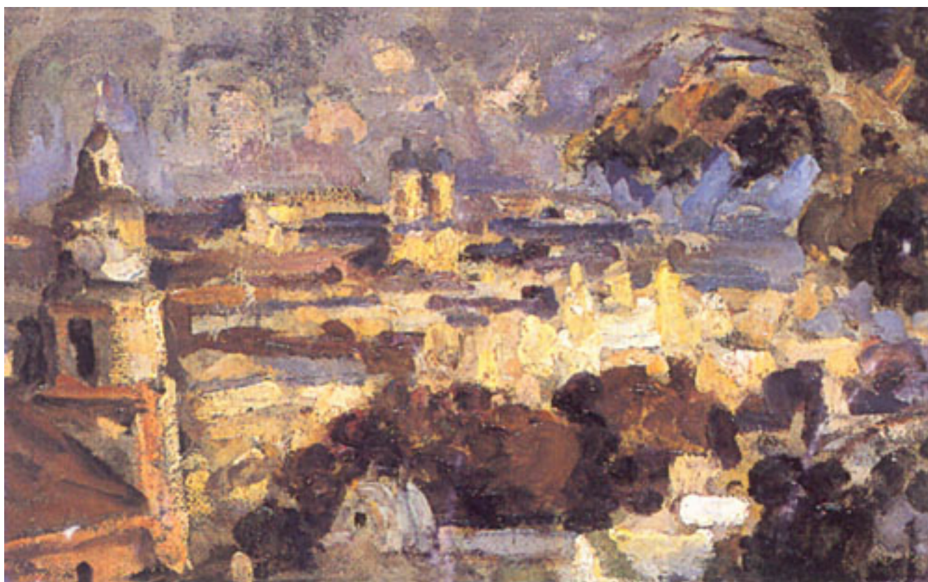
PANORAMA DE SANTIAGO