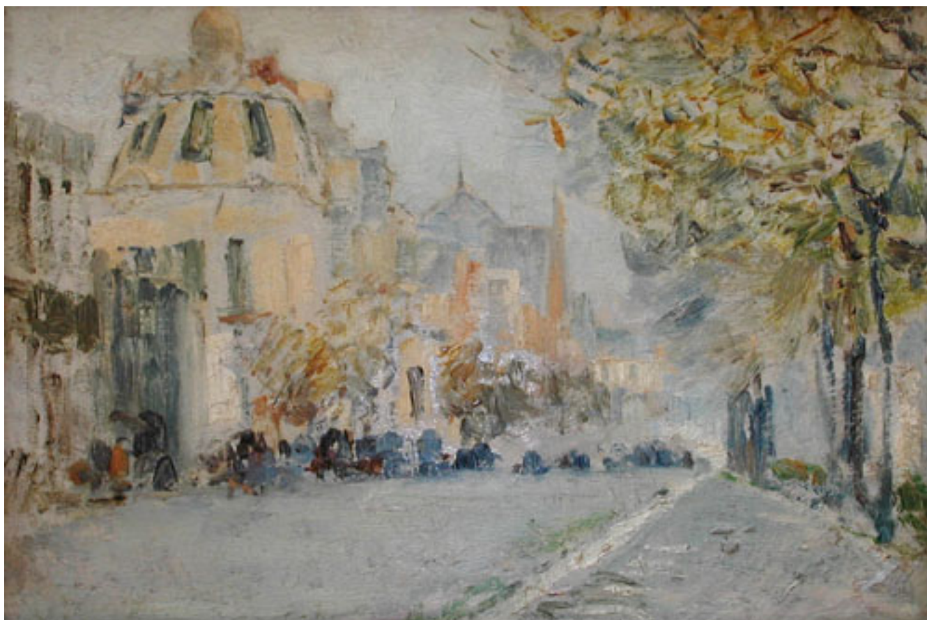
VISTA DE LA CIUDAD