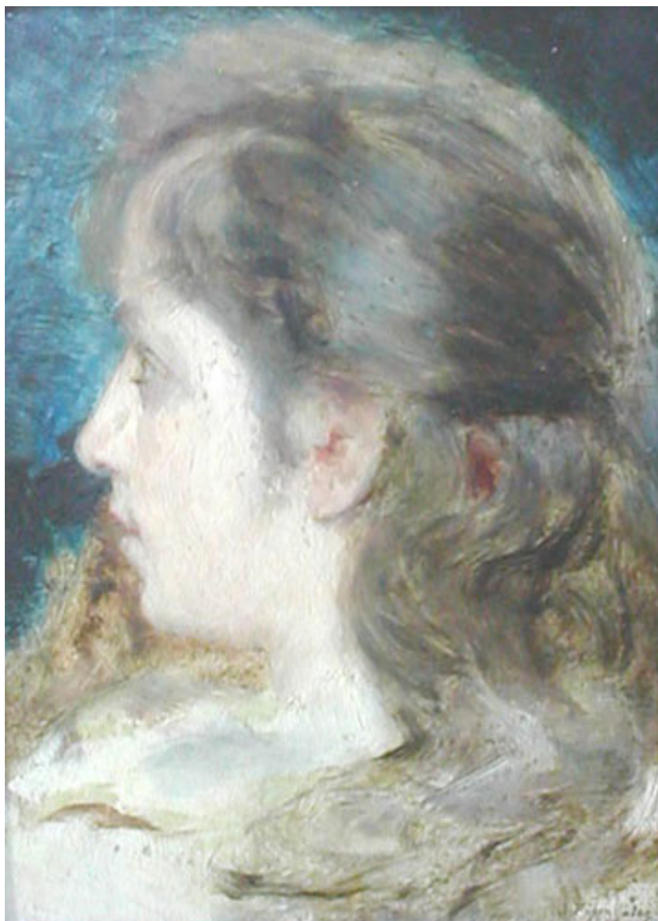
CABEZA DE NIÑA