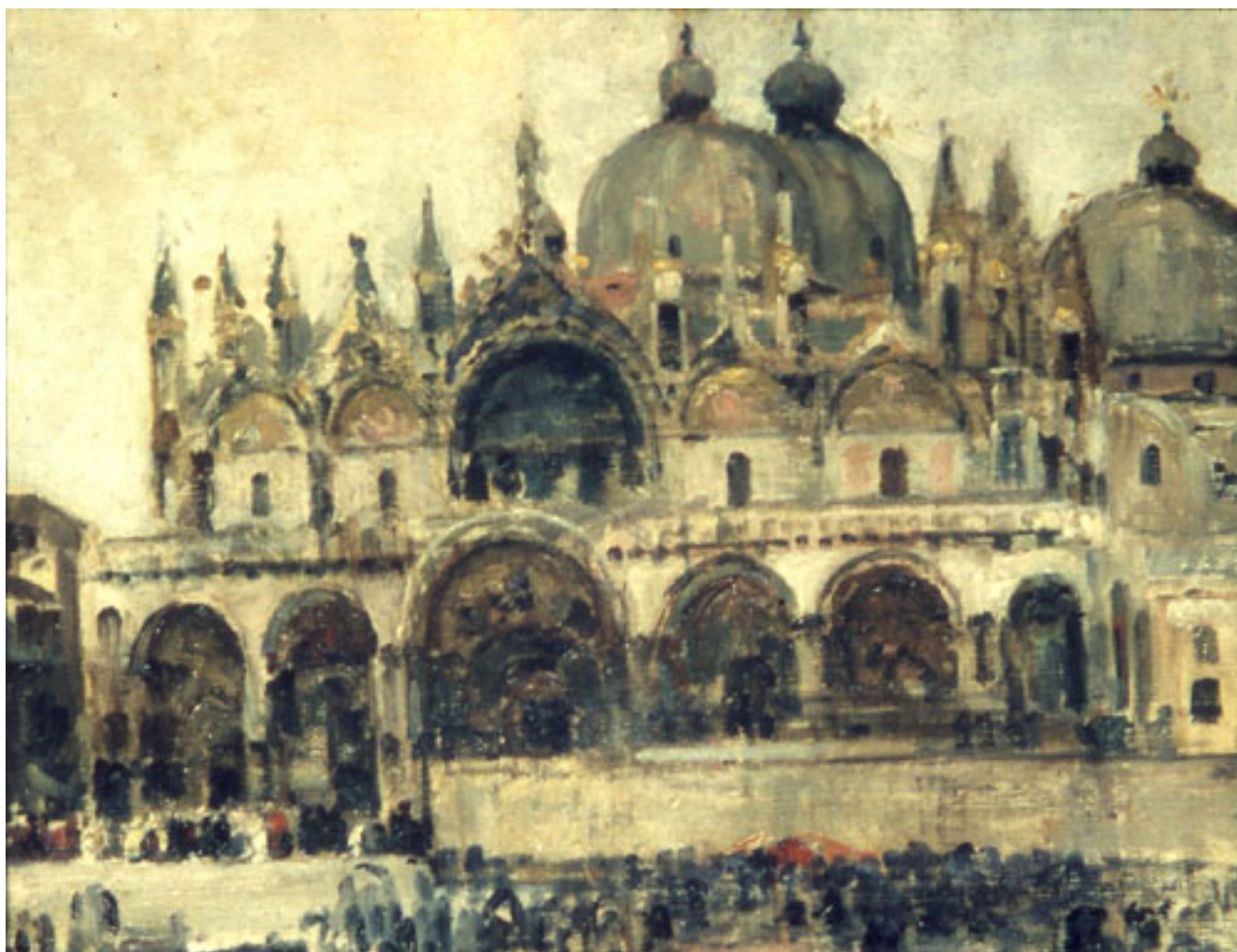
LA BASILICA DE SAN MARCOS, VENECIA