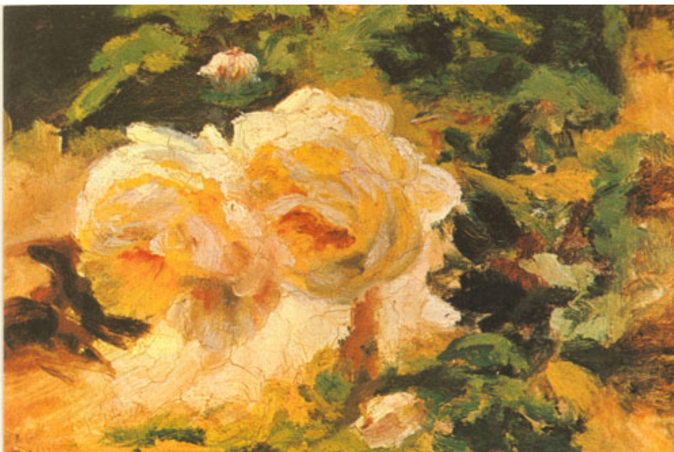
ROSAS AL SOL