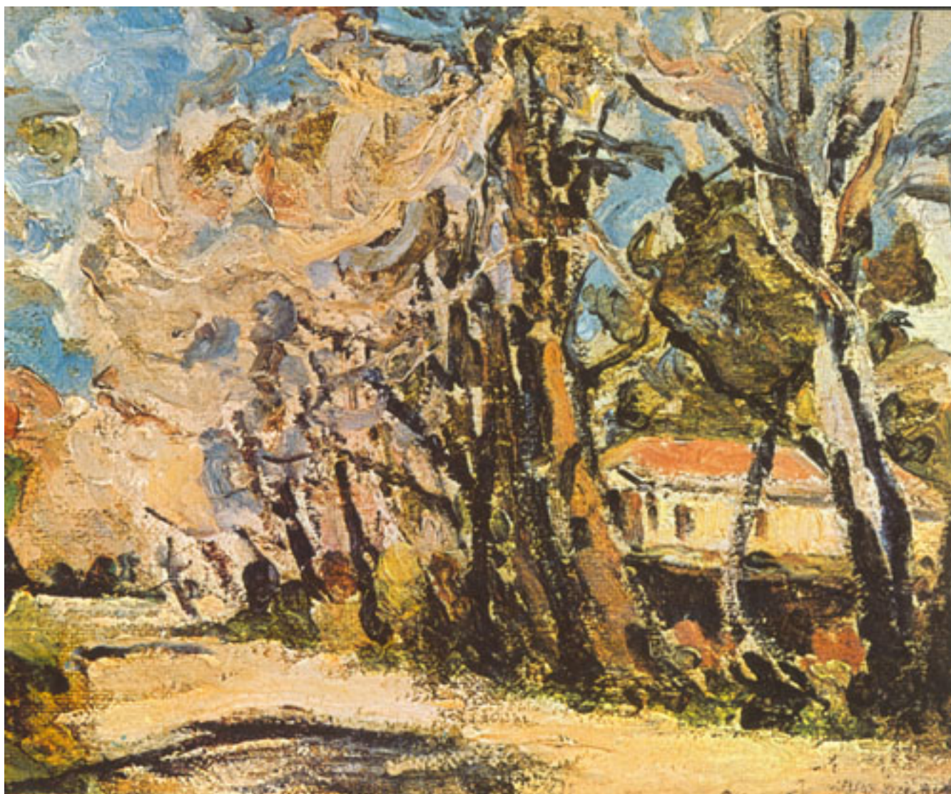
CALLE DE MELIPILLA