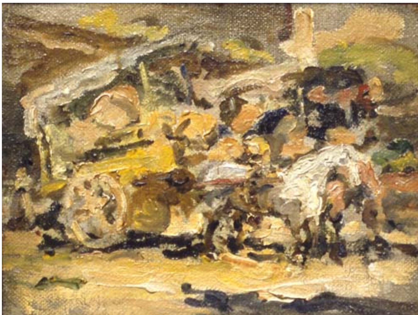
CARRETELAS DE LA VEGA