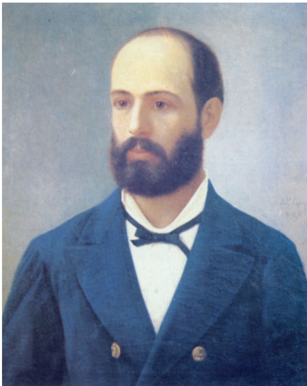
ARTURO PRAT CHACÓN