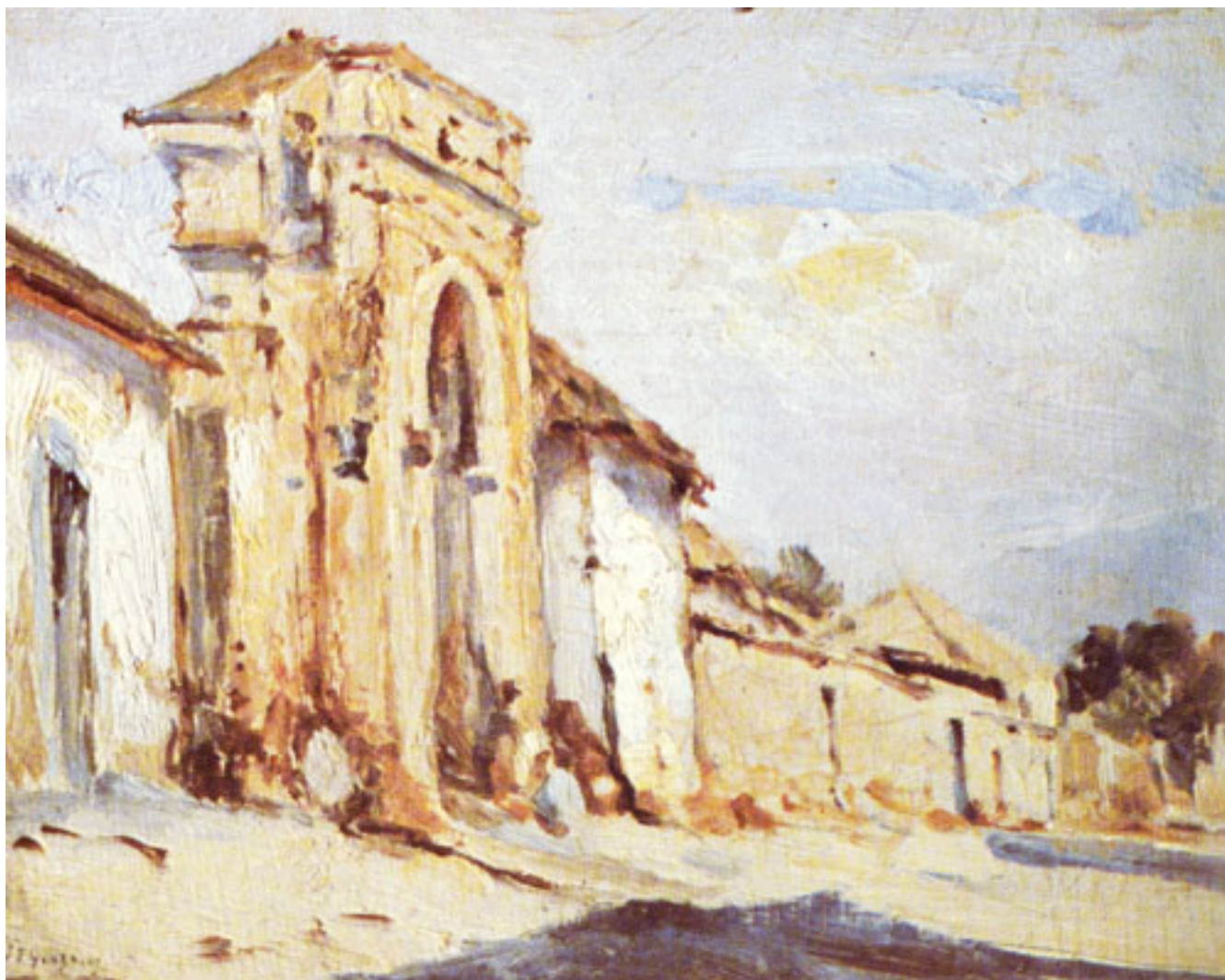
PORTÓN DE LA SERENA