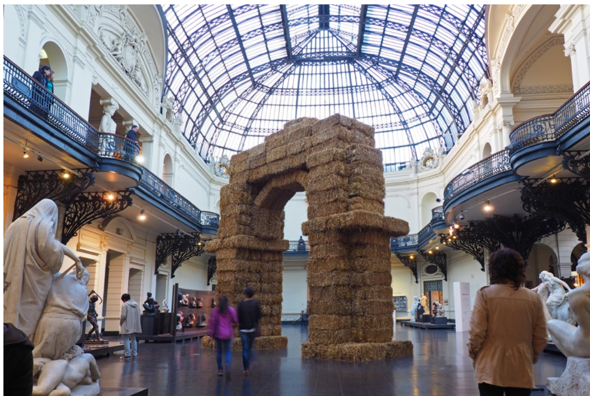
EL TRIUNFO DEL ARCO (vista de la intervención en el Museo Nacional de Bellas Artes, Santiago, Chile)