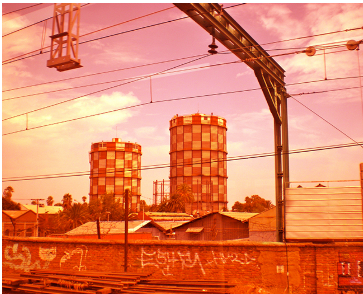
Líneas infinitas 1