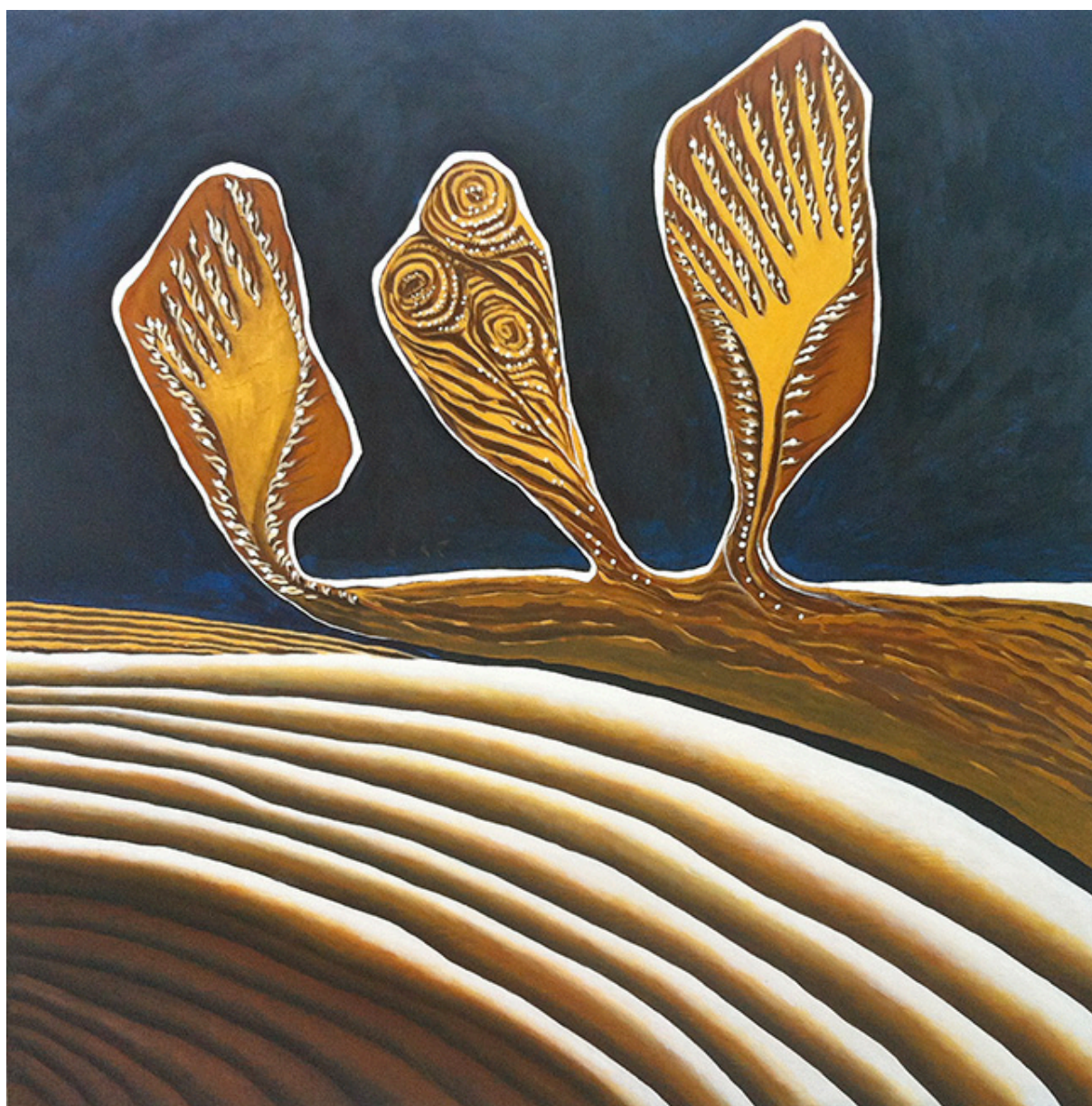
Azar objetivo. Abducción III