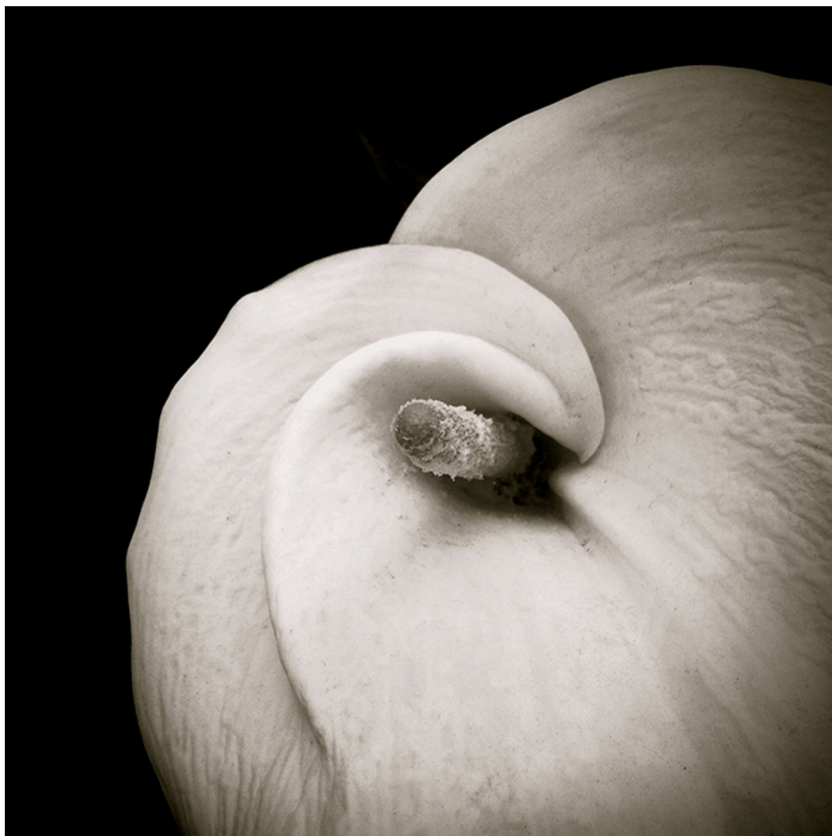
Retrato de cala 1