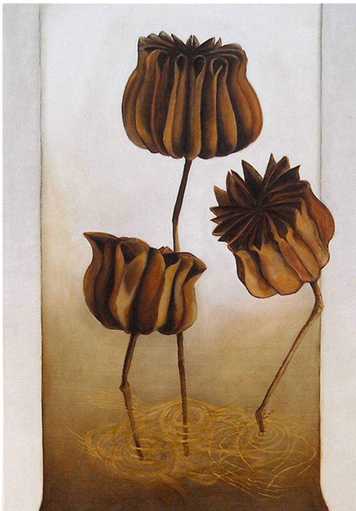
Flor en semillas con hilos dorados