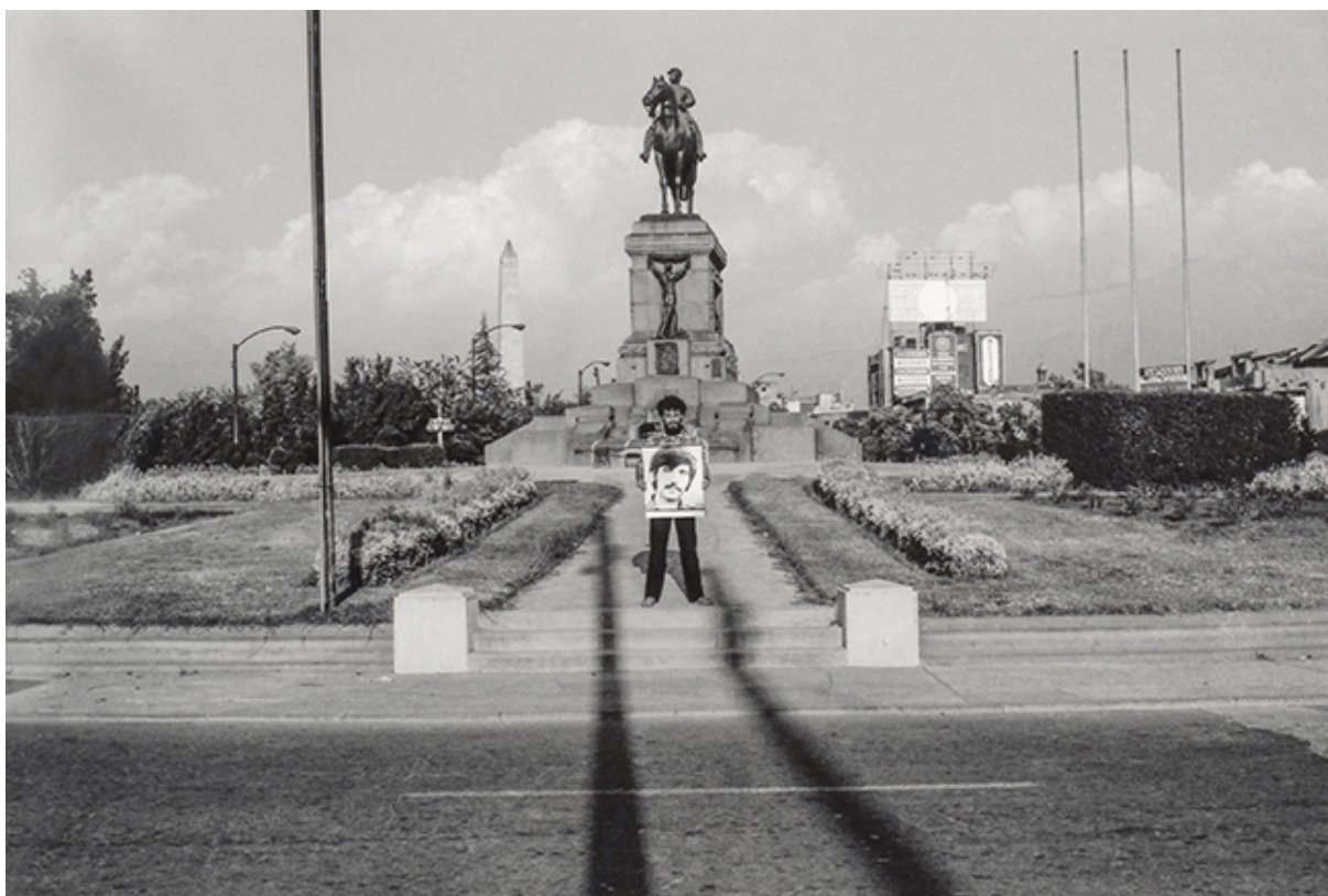
Plaza Italia (serie intervención urbana con letrero)