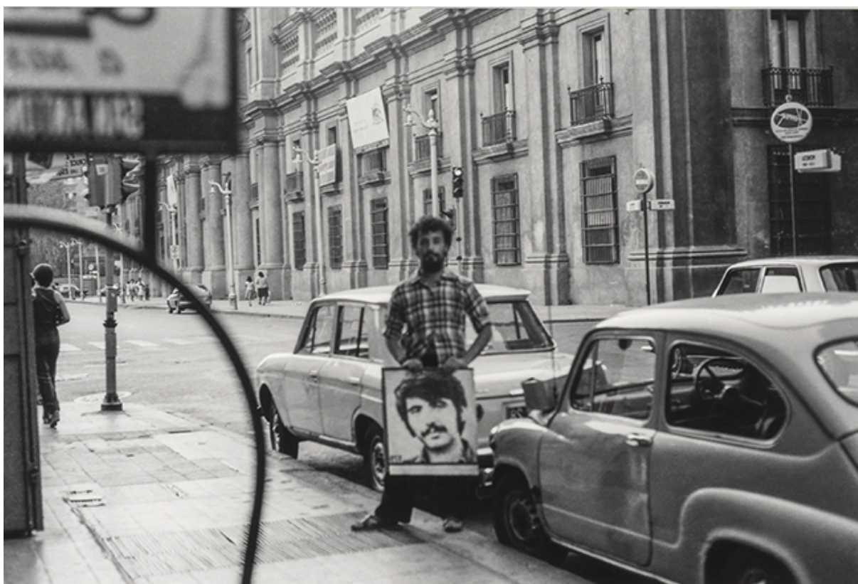
La Moneda (serie intervención urbana con letrero)