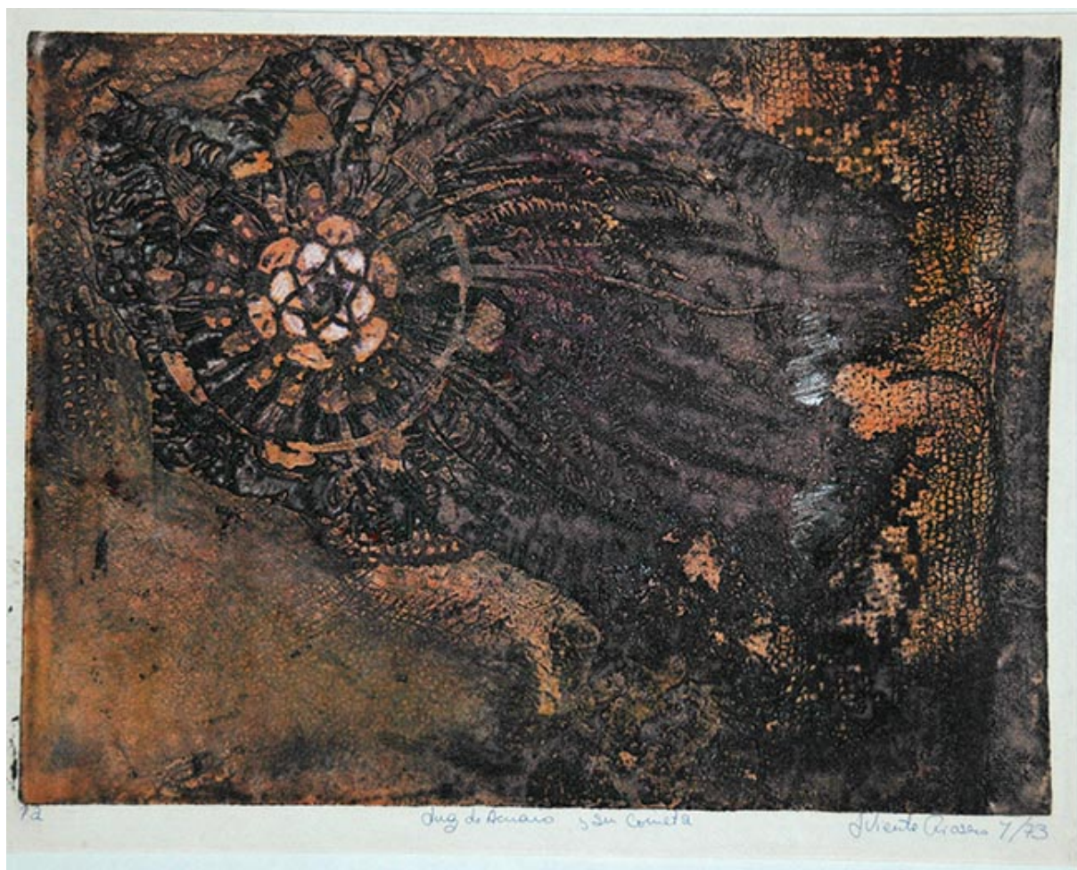
LUZ DE ACUARIO Y SU COMETA