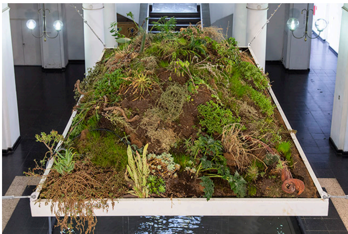
Tejado de vidrio