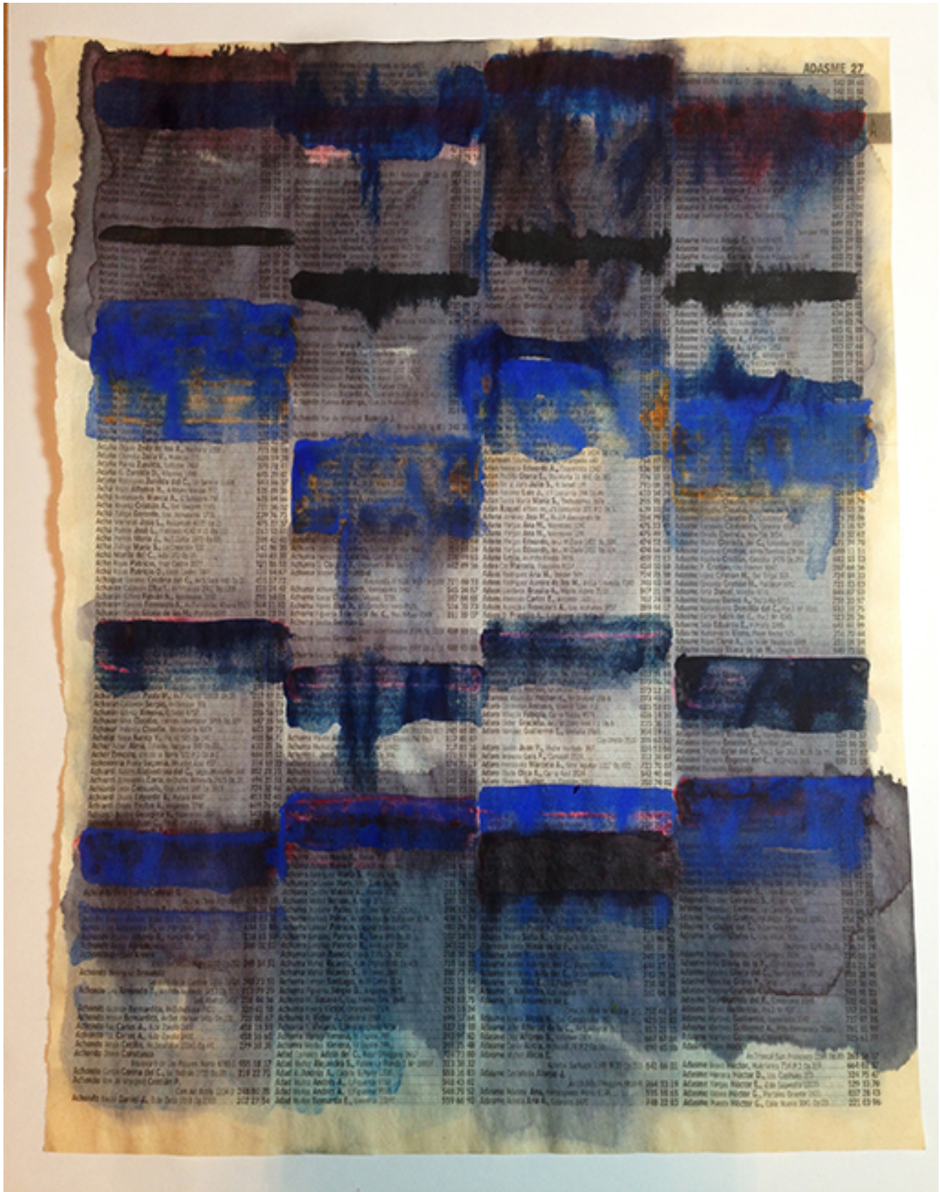
Secuenciación del azul marino