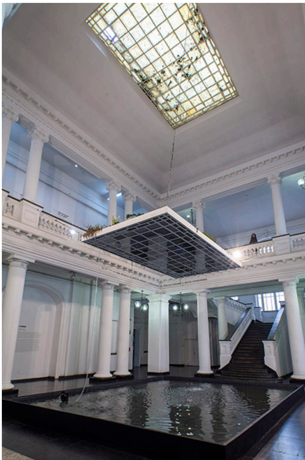
Tejado de vidrio