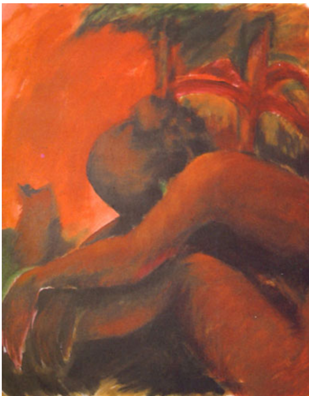
RAÍCES DE AMÉRICA (serie Tierra asombro)

http://www.youtube.com/watch?v=sujKhtTSLUA http://www.youtube.com/watch?v=pshKAPB0wak