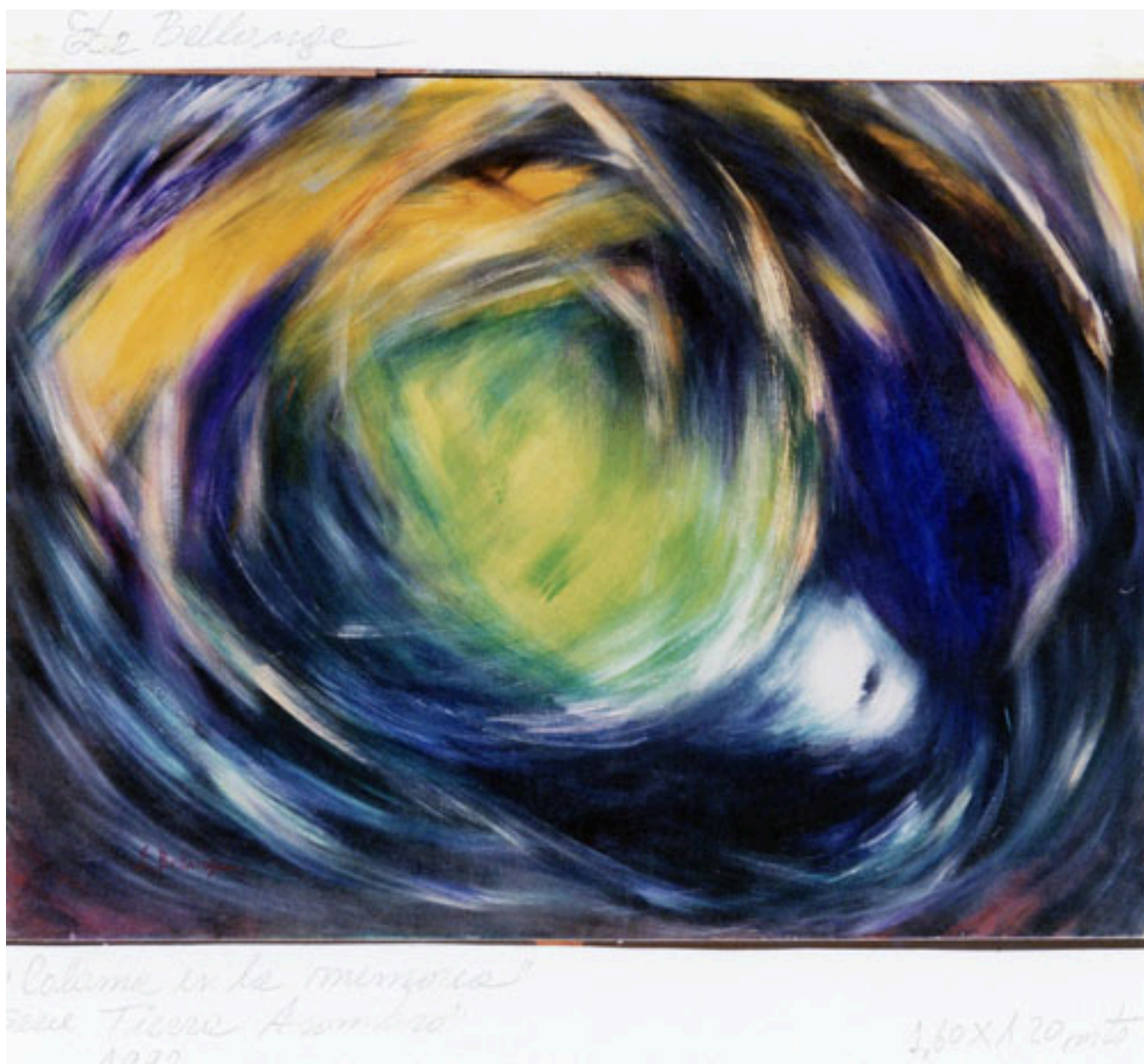
CALAMA (serie Tierra asombro)