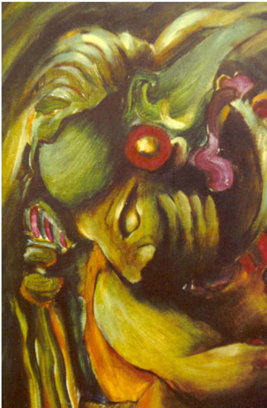
RAÍCES DE AMÉRICA (serie Tierra asombro)