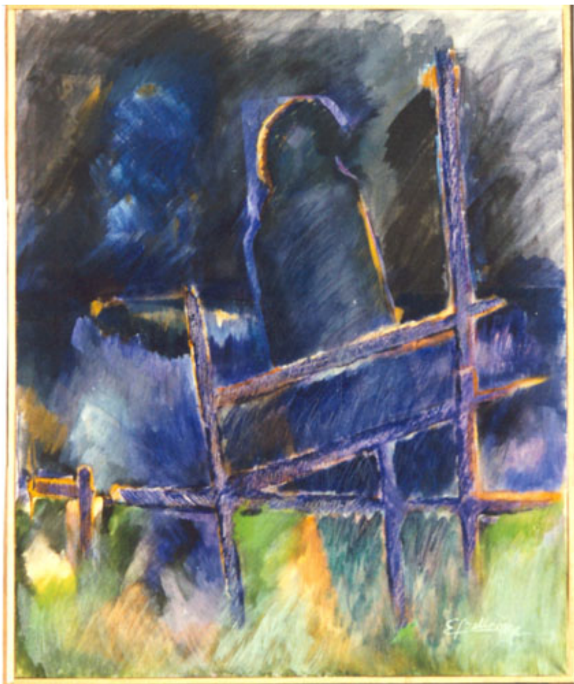
N.N. (serie Tierra asombro)