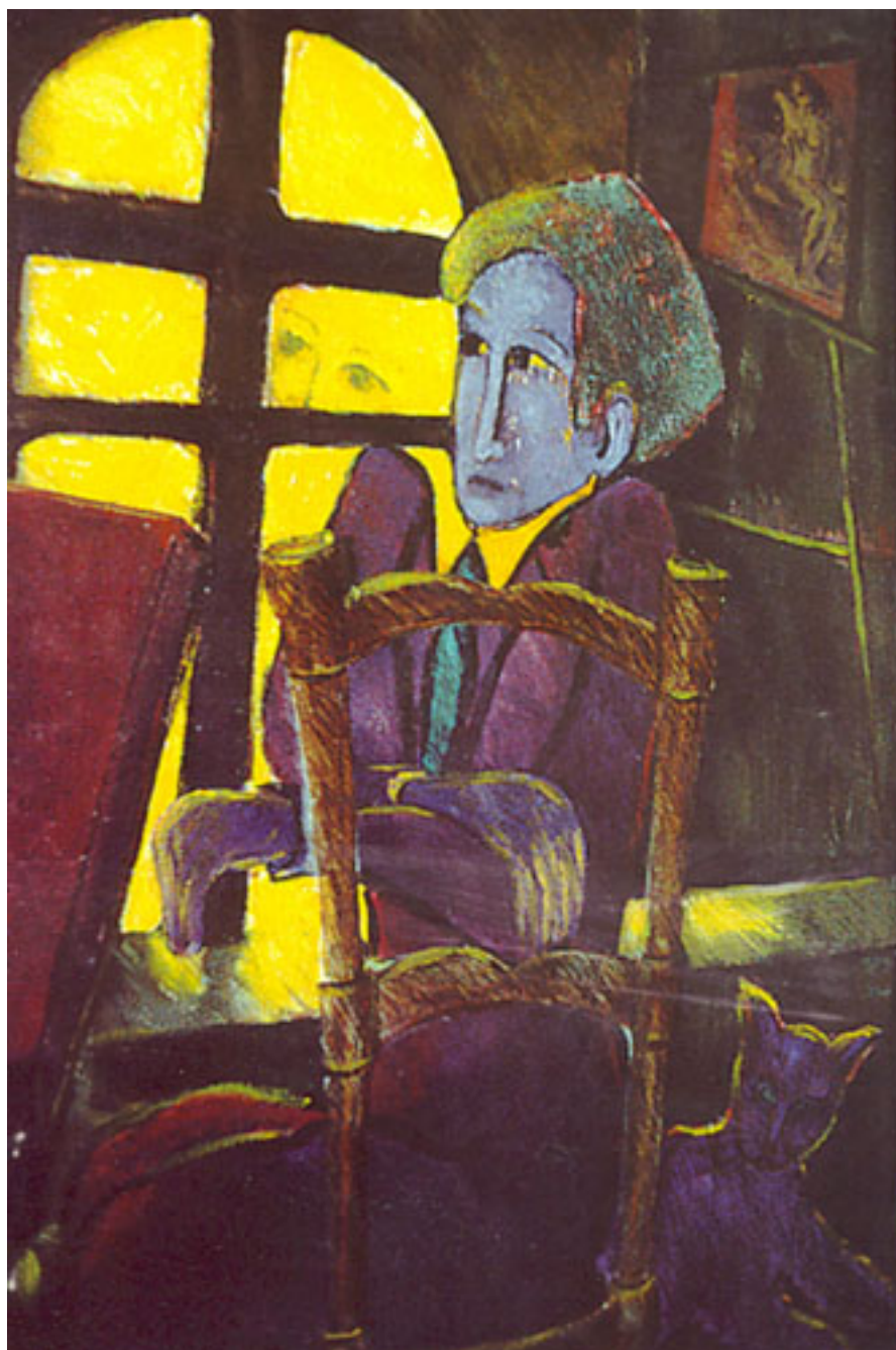
LA ESPERA (serie Tierra asombro)