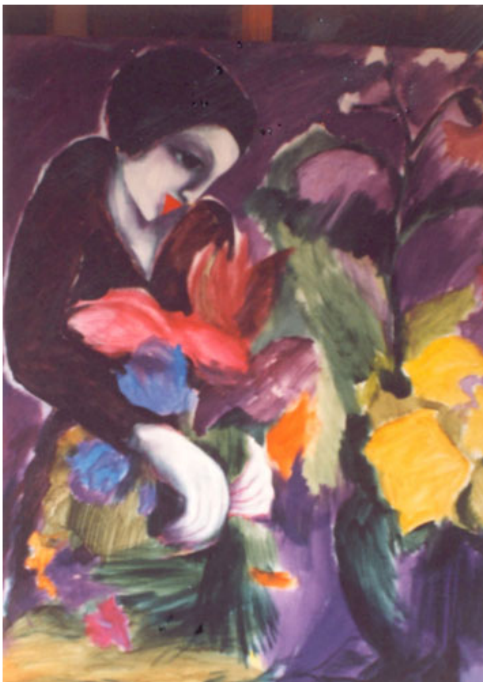
FLORES OLVIDADAS (serie Tierra asombro)