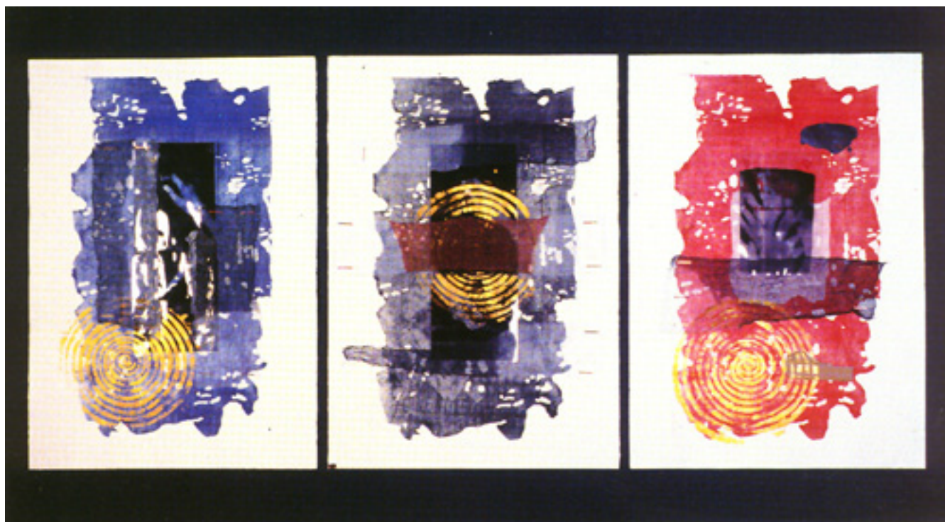
I CINQUE SENSI II TATTO