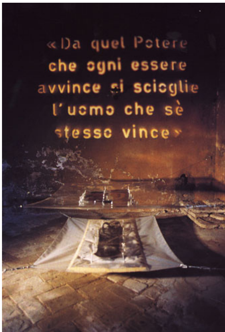
MATERNIDAD (registro de instalación)