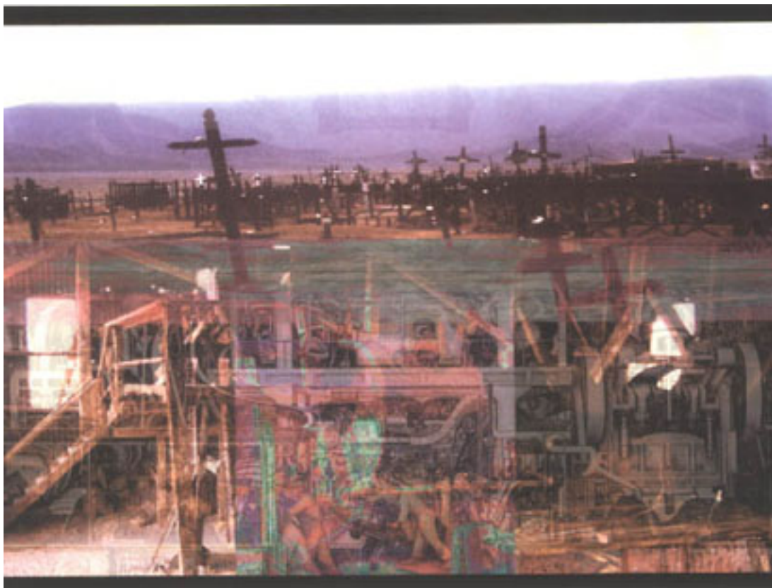
METAFÍSICA DE UN DESIERTO (registro de instalación)