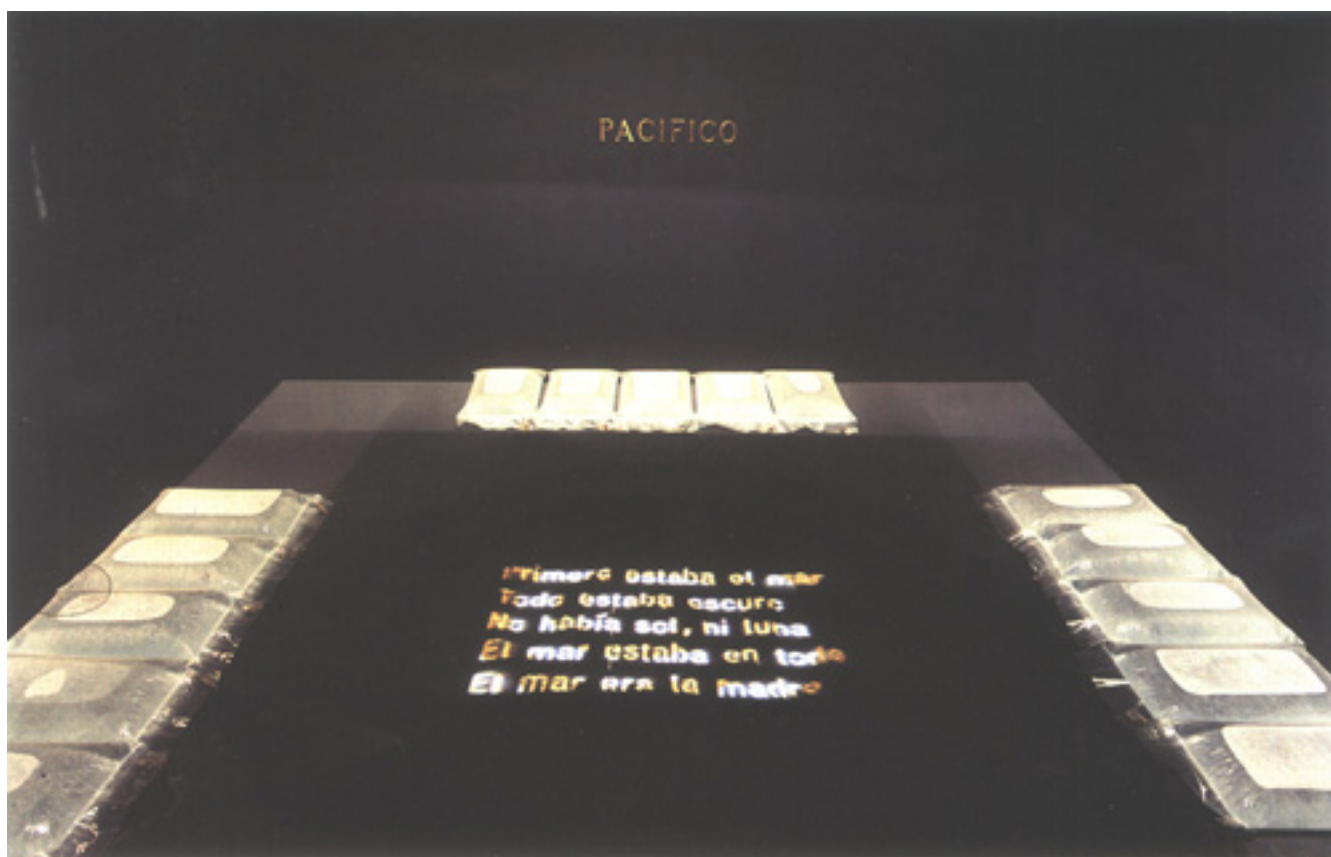
ATLÁNTICO-INDICO_PACIFICO (registro de instalación)