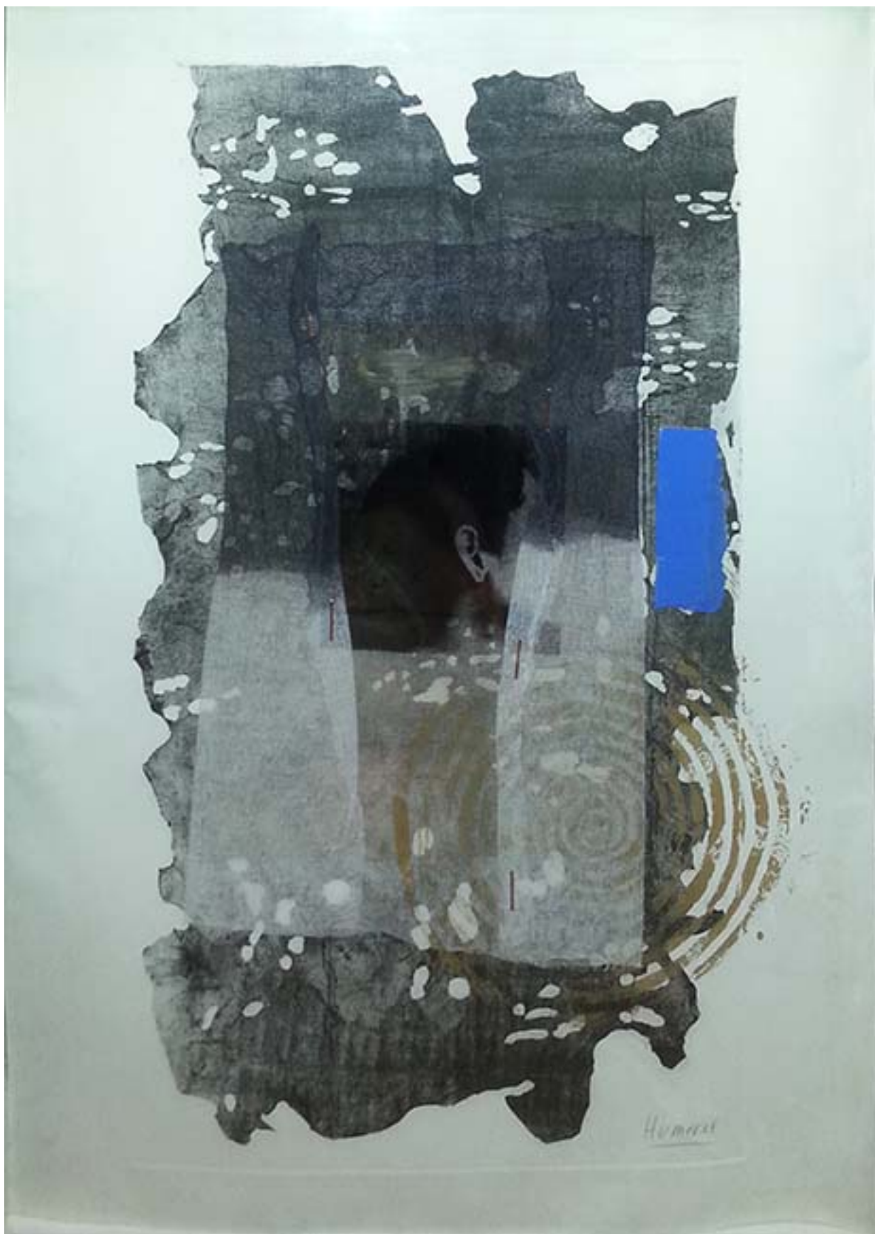
DE LA SERIE DE LOS CINCO SENTIDOS, EL OÍDO