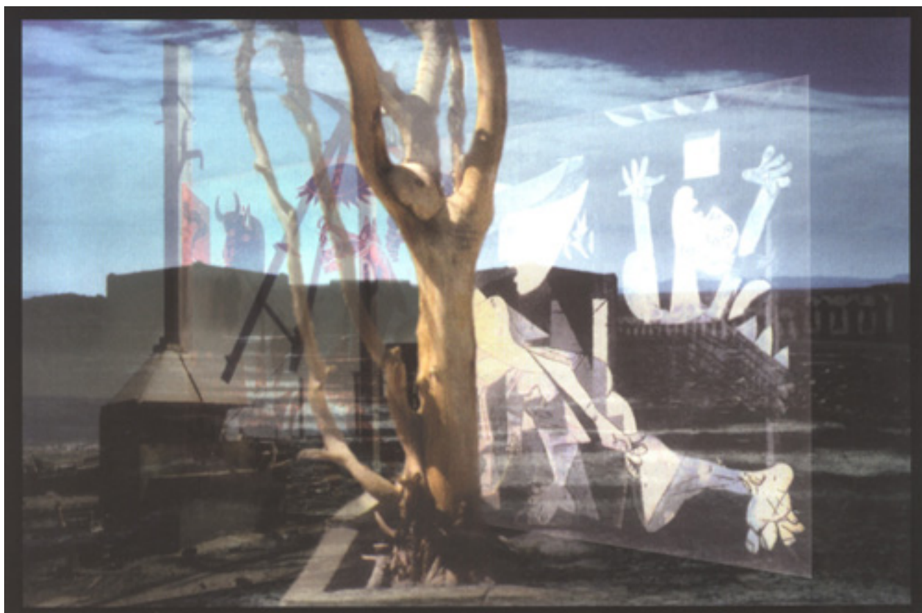
METAFÍSICA DE UN DESIERTO (registro de instalación)