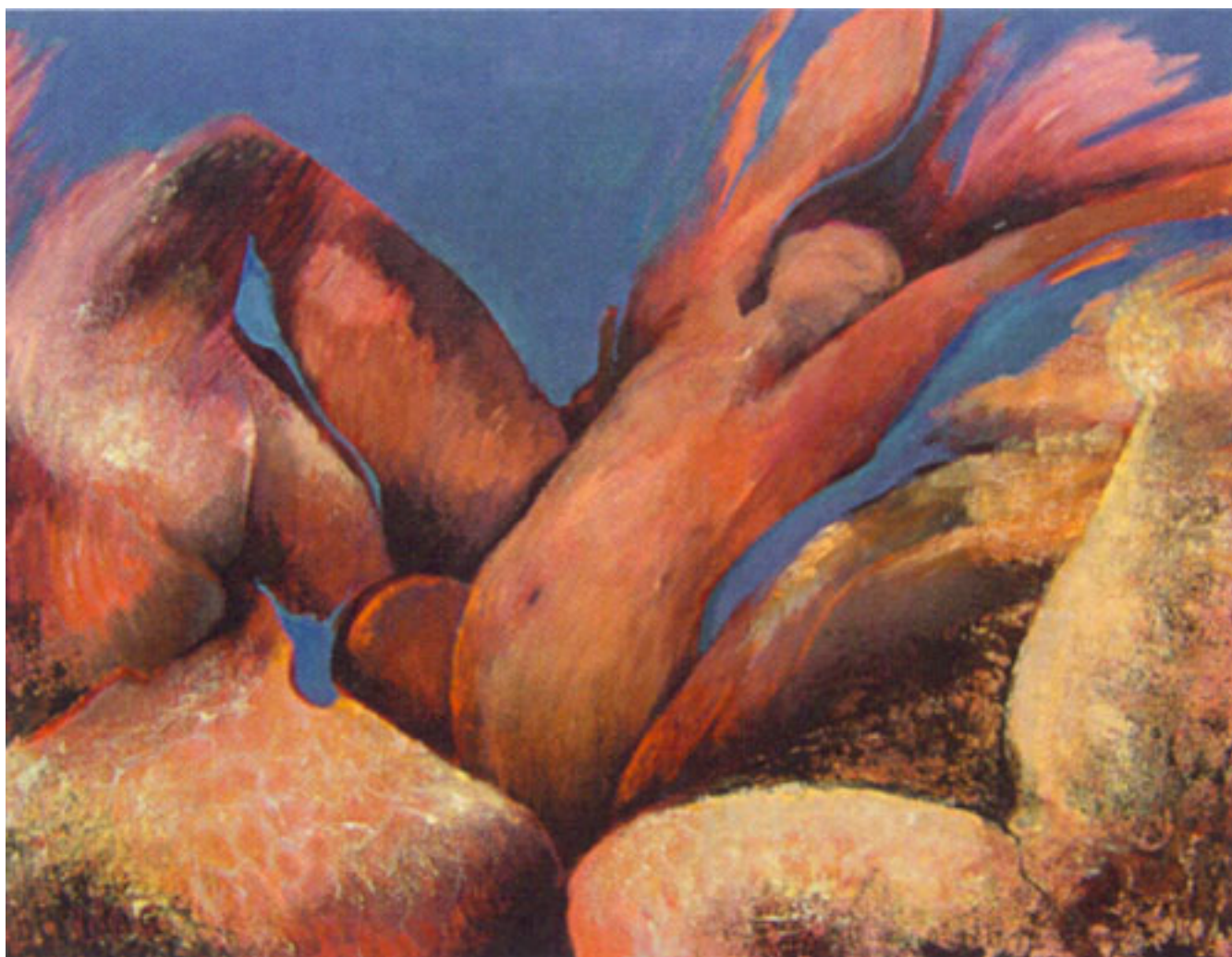
NACIMIENTO DE KUANIP (HÉROE ONA)