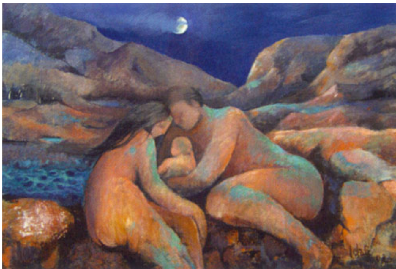
FAMILIA DE COBRE