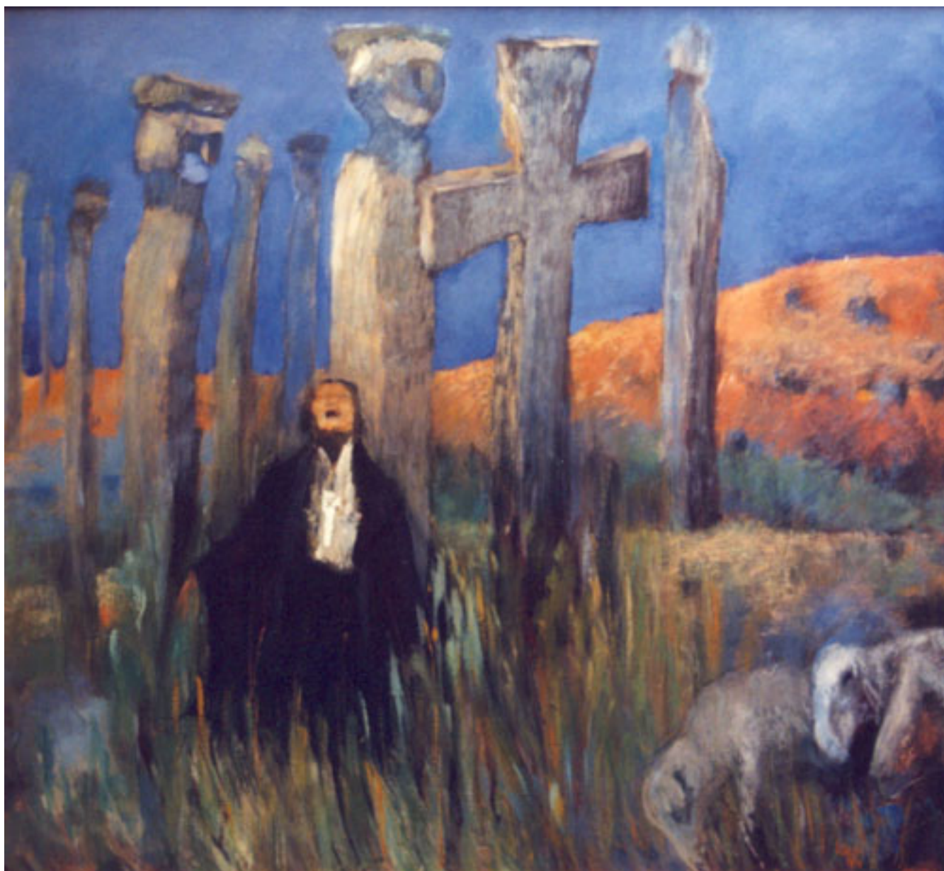
LA CONVOCATORIA, SERIE LA PRIMITIVA HUMANIDAD