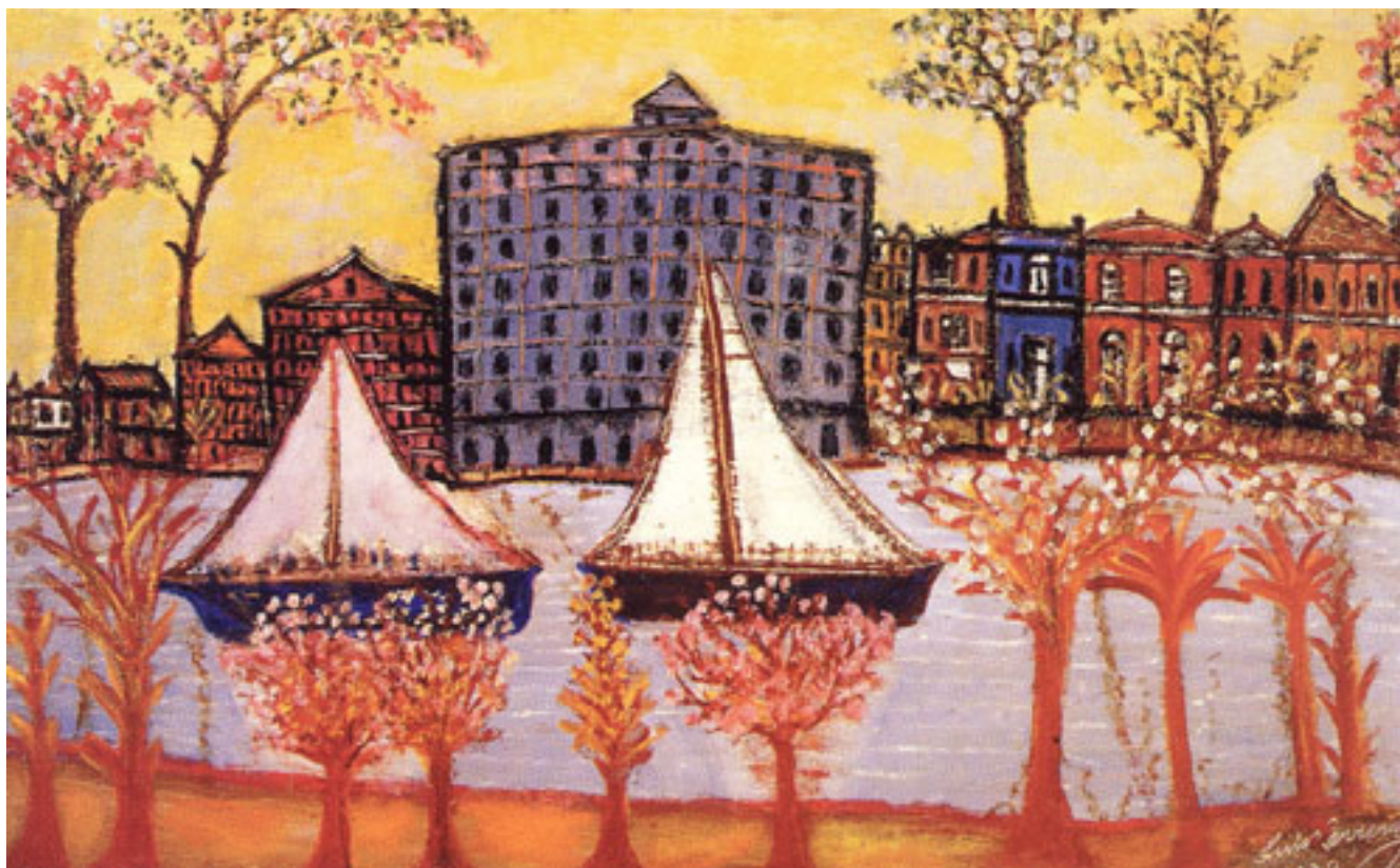
LANCHONES EN EL PARQUE

SOMMER, WALDEMAR. Banco Central de Chile. Pinacoteca 1925-1977. Santiago, sin fecha.