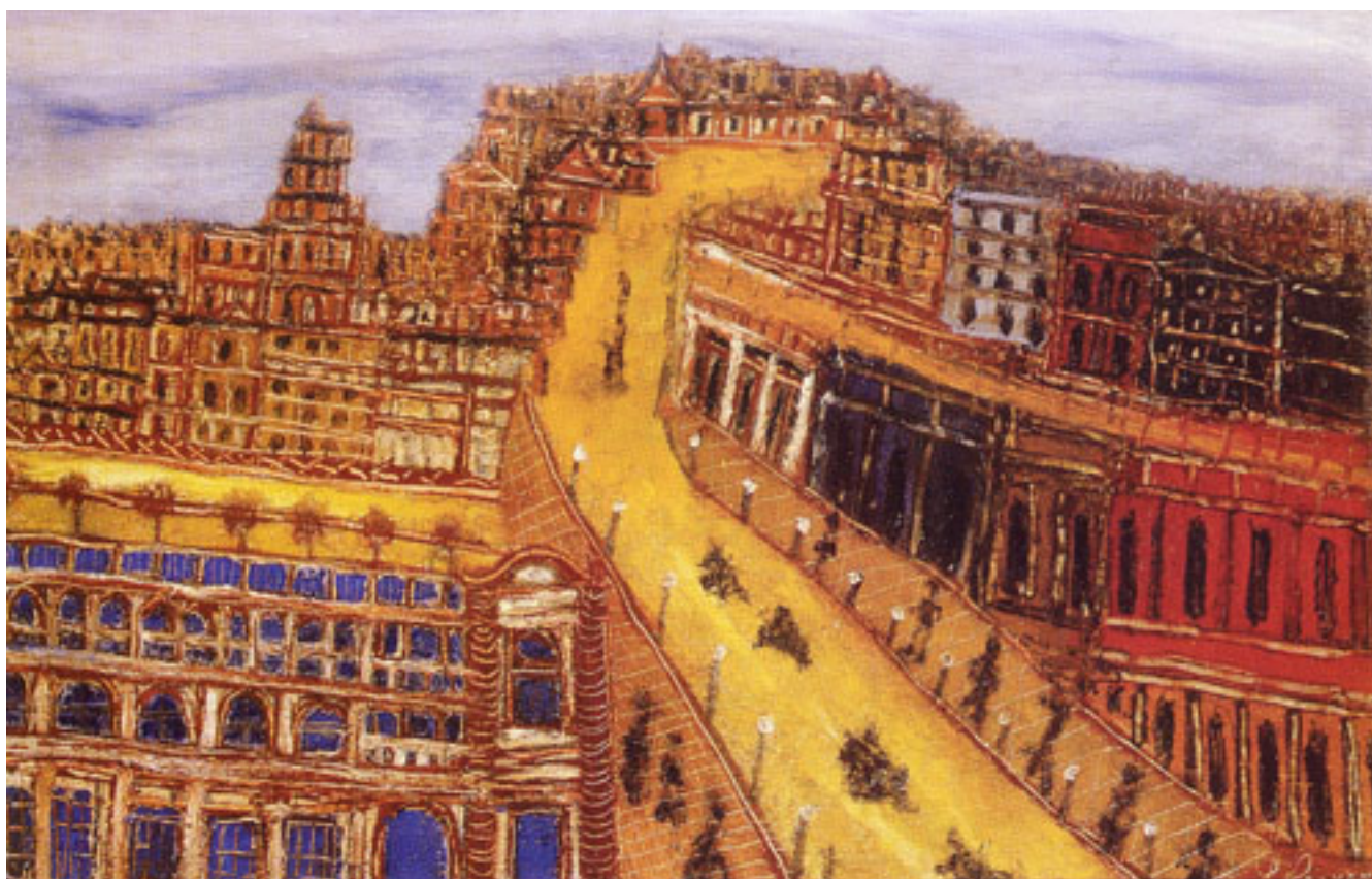
CERRO DE CERRO VALPARAÍSO