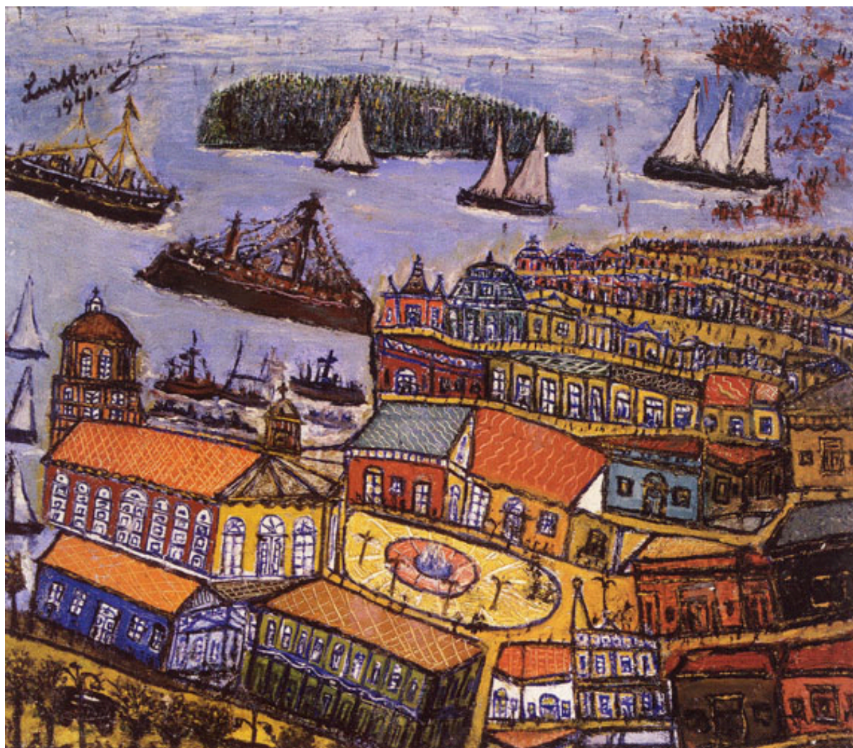
PUERTO DE VALPARAÍSO