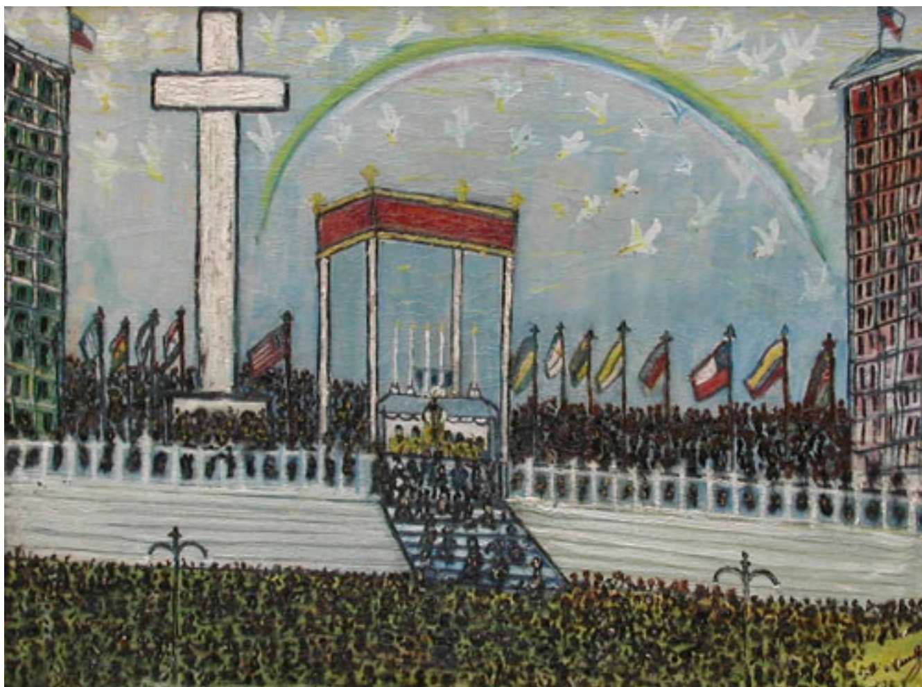
CONGRESO EUCARÍSTICO DE SANTIAGO