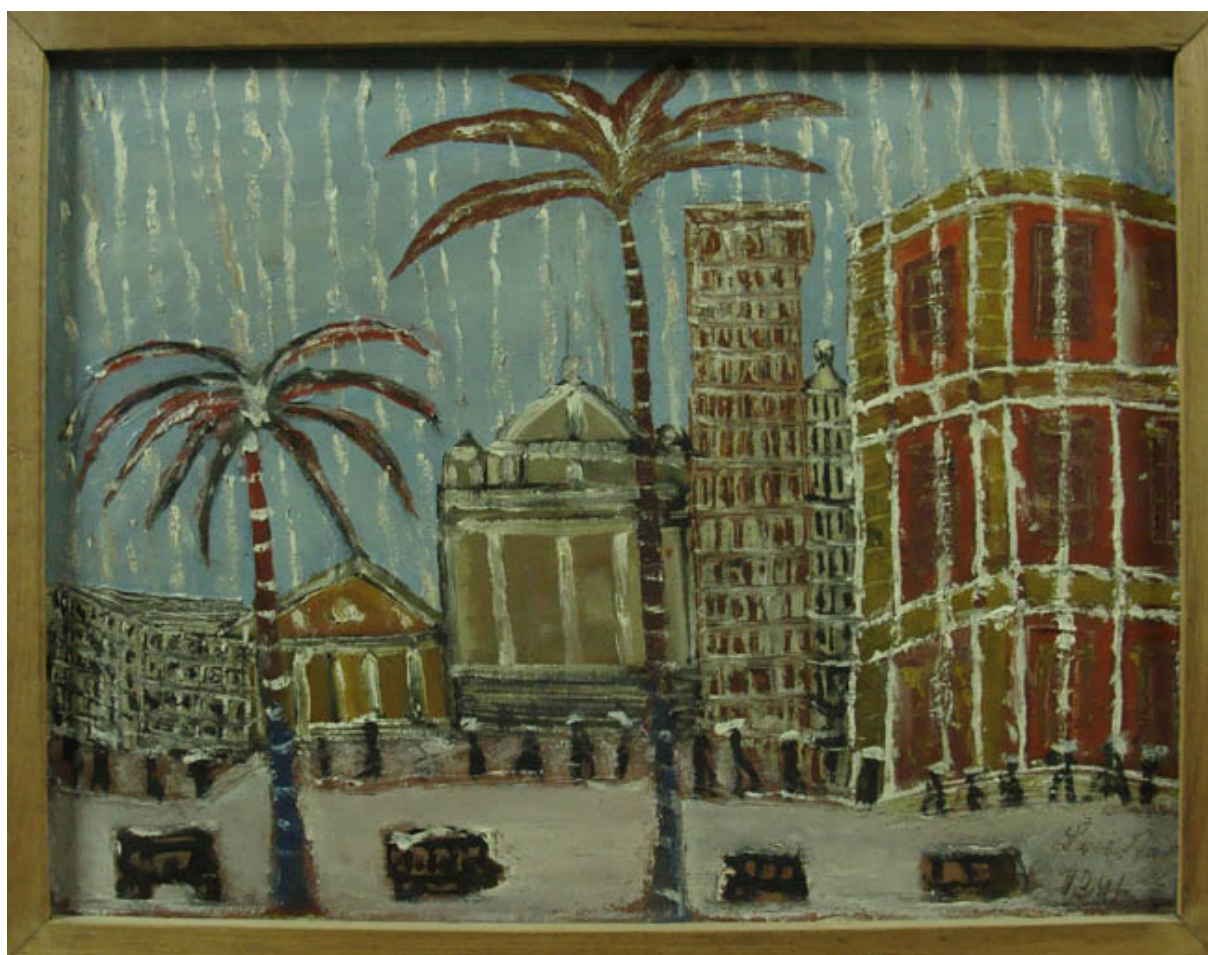
PAISAJE CON PALMERAS