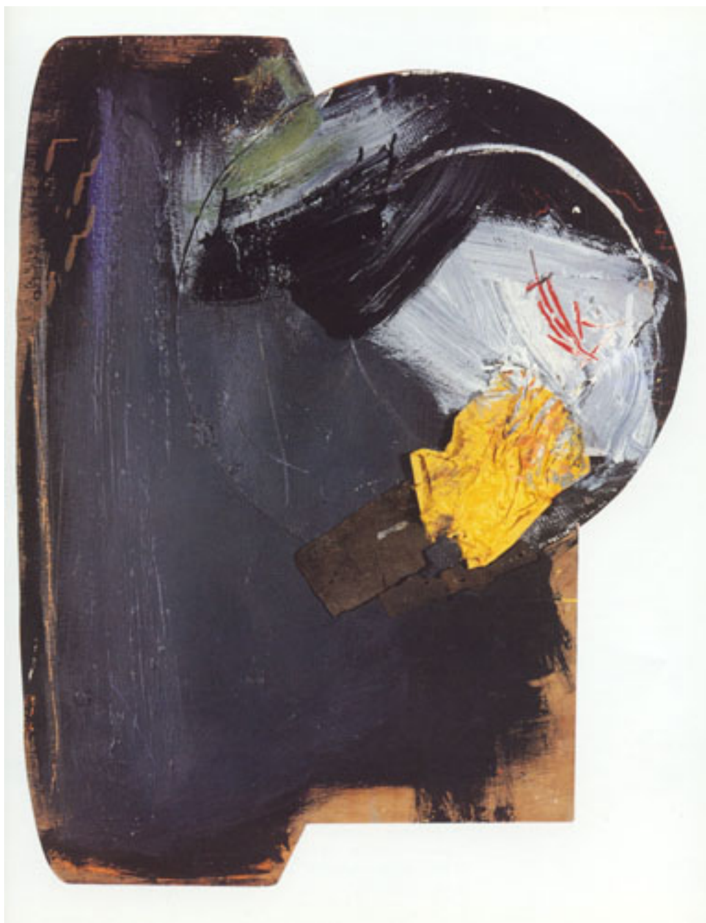
RETRATO DE LOS TIEMPOS