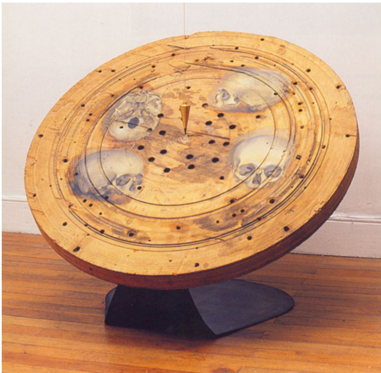
COMO UN VIENTO CALIENTE (registro de instalación)