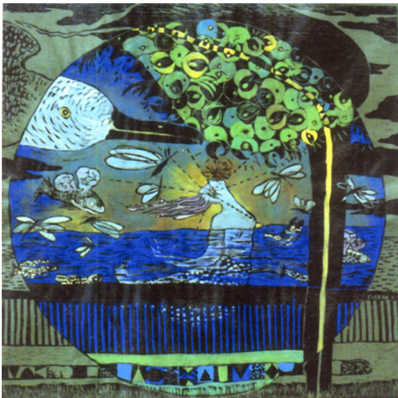
RECUPERACIÓN DEL MAPOCHO