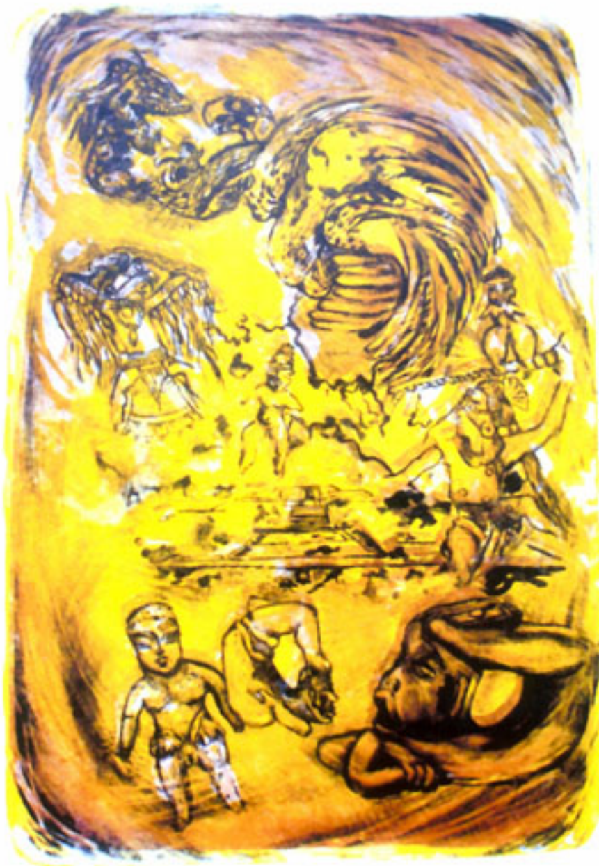
HOMENAJE A REGINA REINA DE MÉXICO