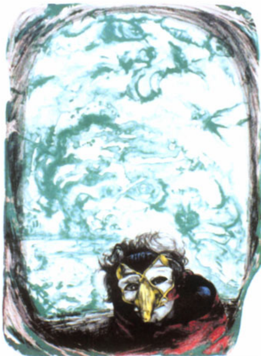
DUENDE YURI Y ÁRBOL DE VIDA