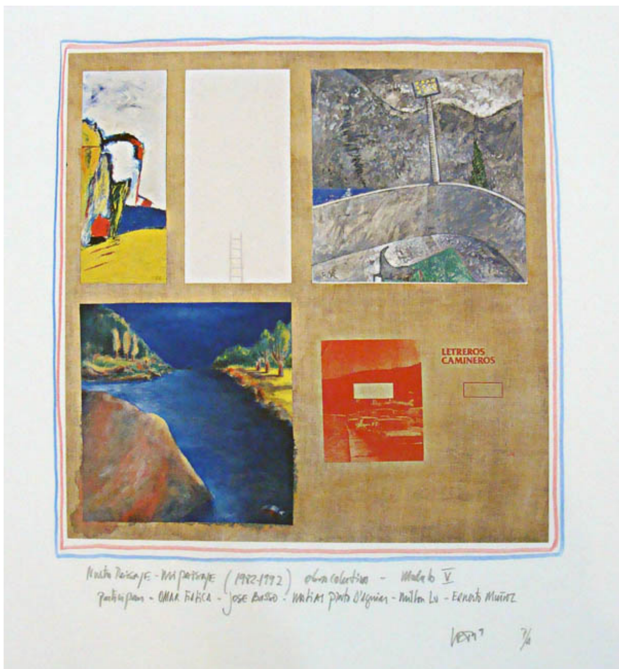
MÓDULO V DE LA SERIE NUESTRO PAISAJE-MI PAISAJE OBRA COLECTIVA