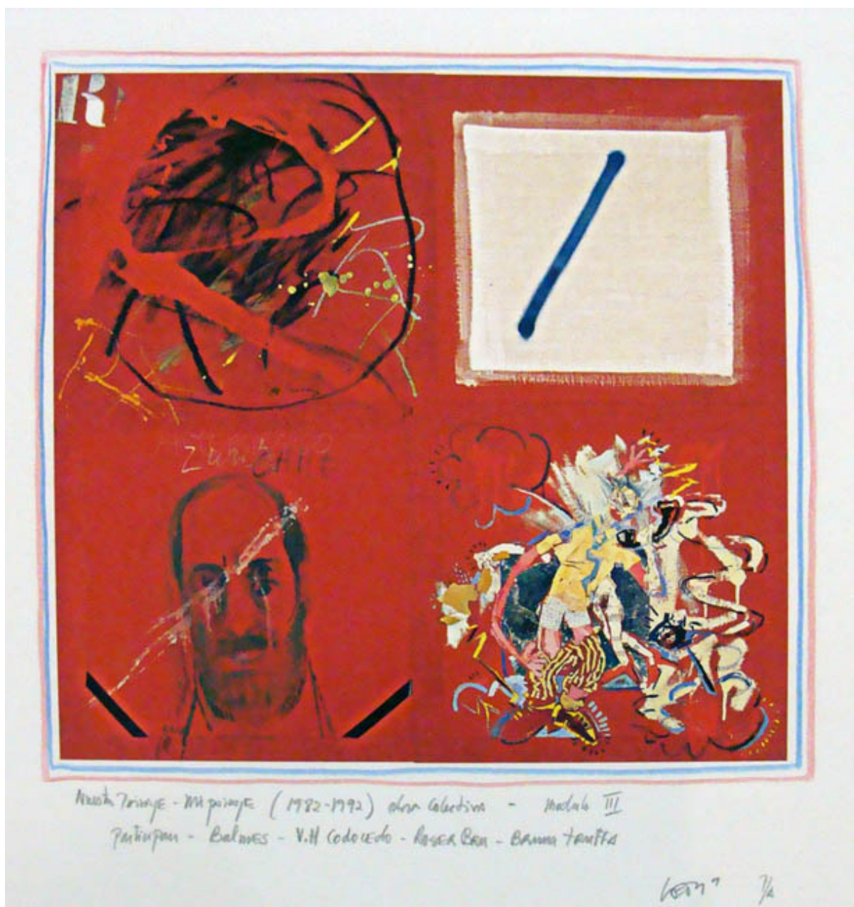
MÓDULO III DE LA SERIE NUESTRO PAISAJE-MI PAISAJE OBRA COLECTIVA