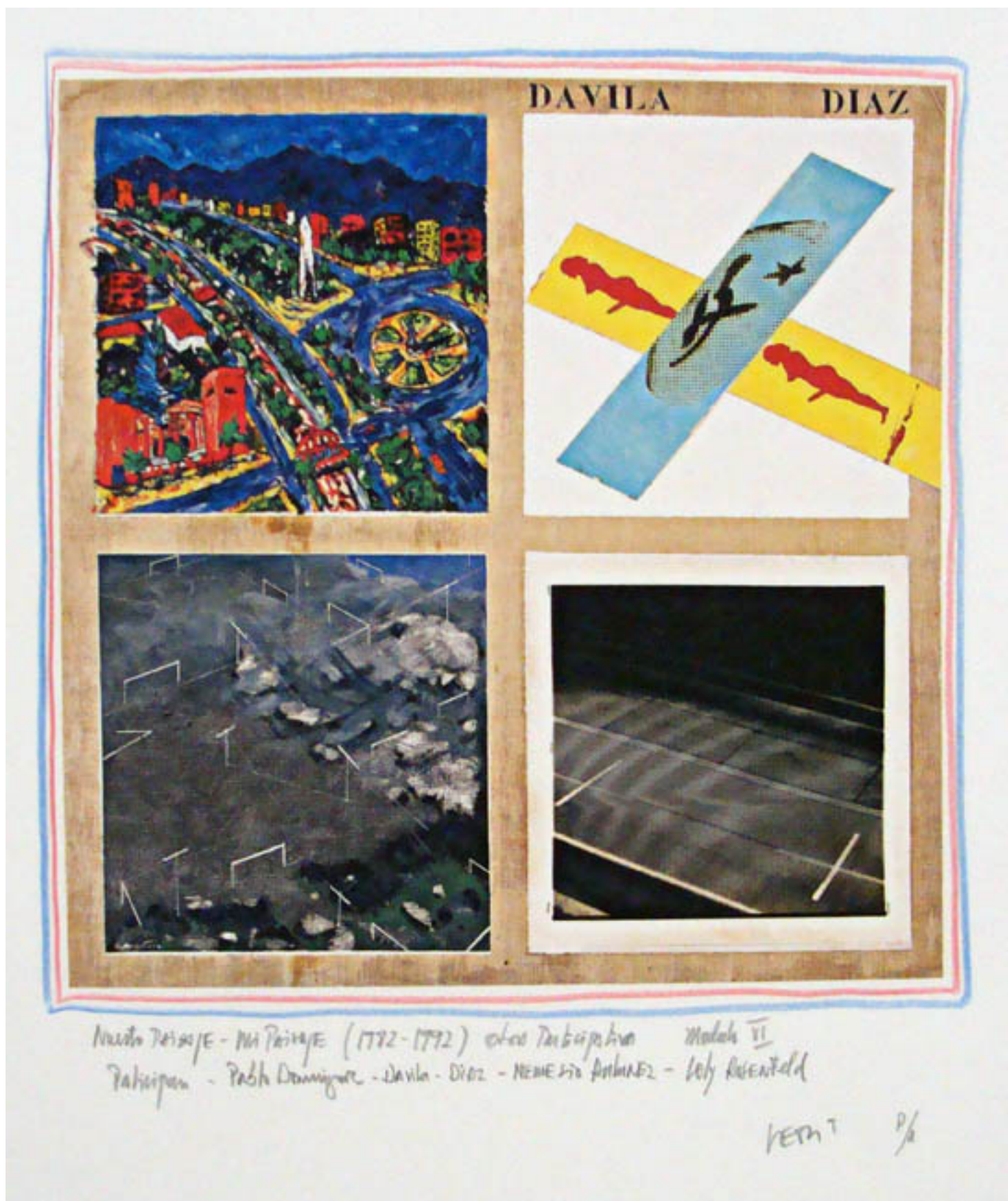
MÓDULO VI DE LA SERIE NUESTRO PAISAJE-MI PAISAJE OBRA COLECTIVA