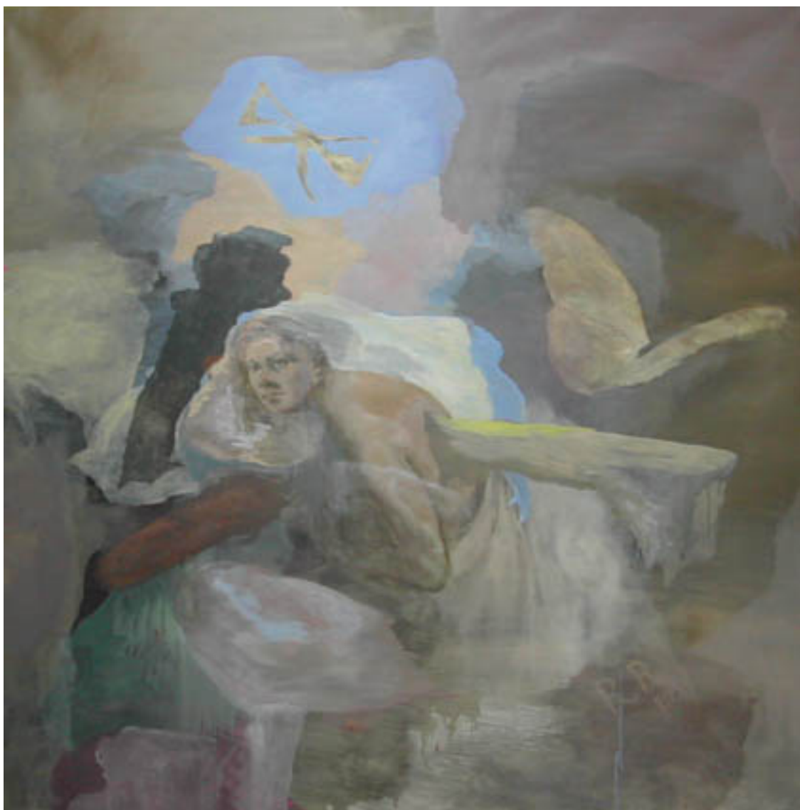
VISIÓN DE RADOMIR R., UN HOMBRE DE 45 AÑOS