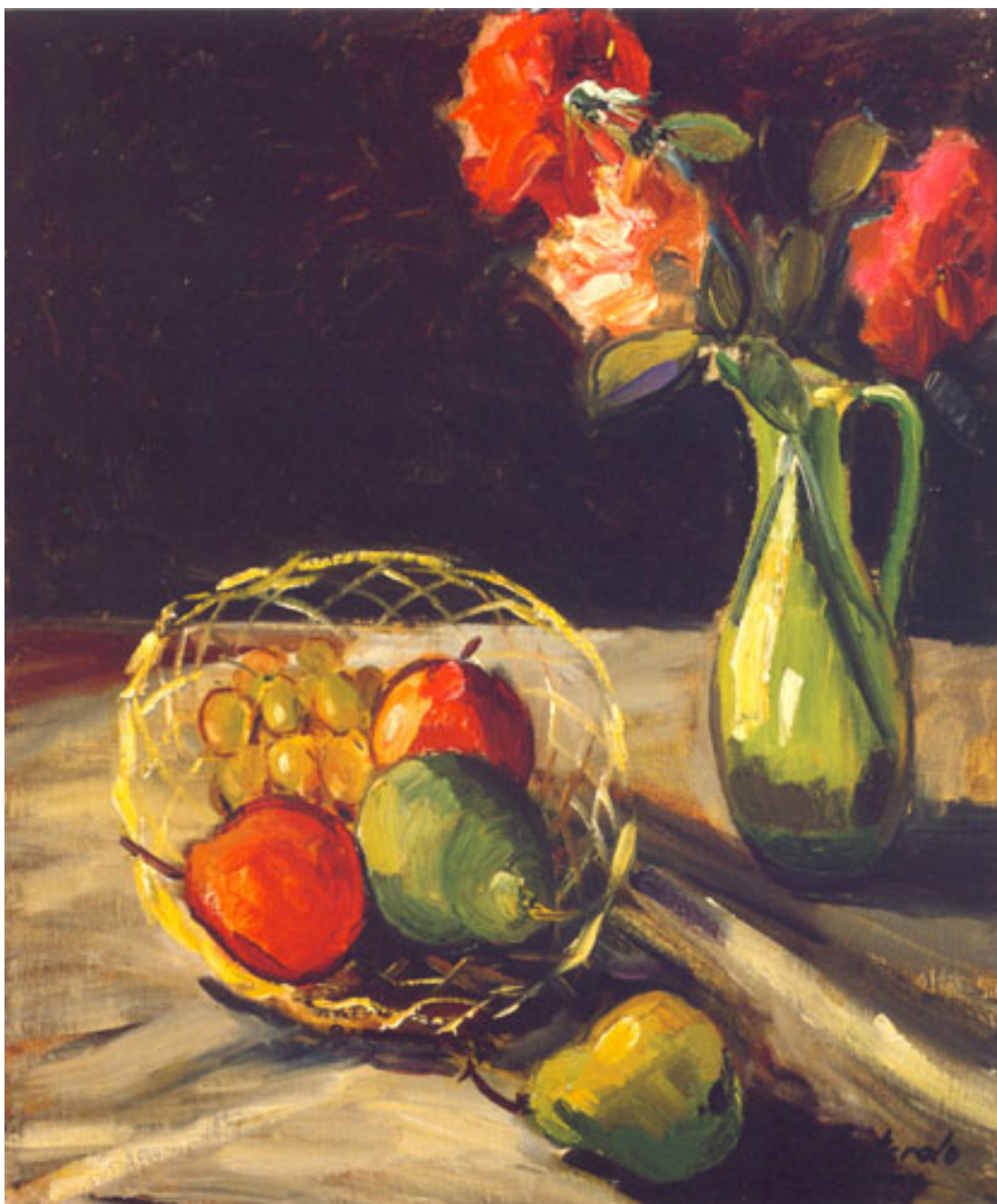
NATURALEZA MUERTA CON FLORES Y FRUTAS