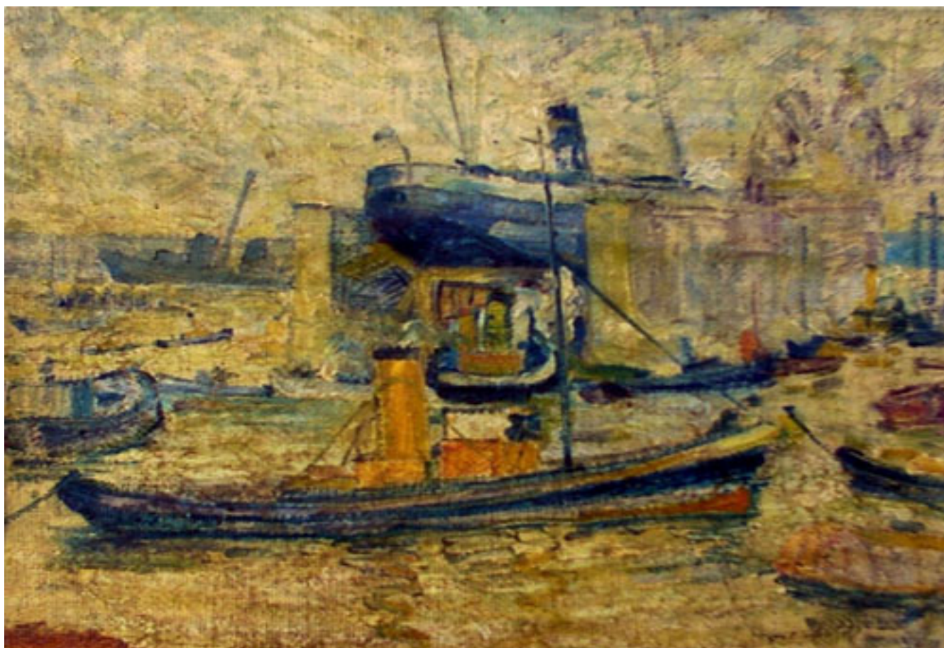
DIQUE DE VALPARAÍSO