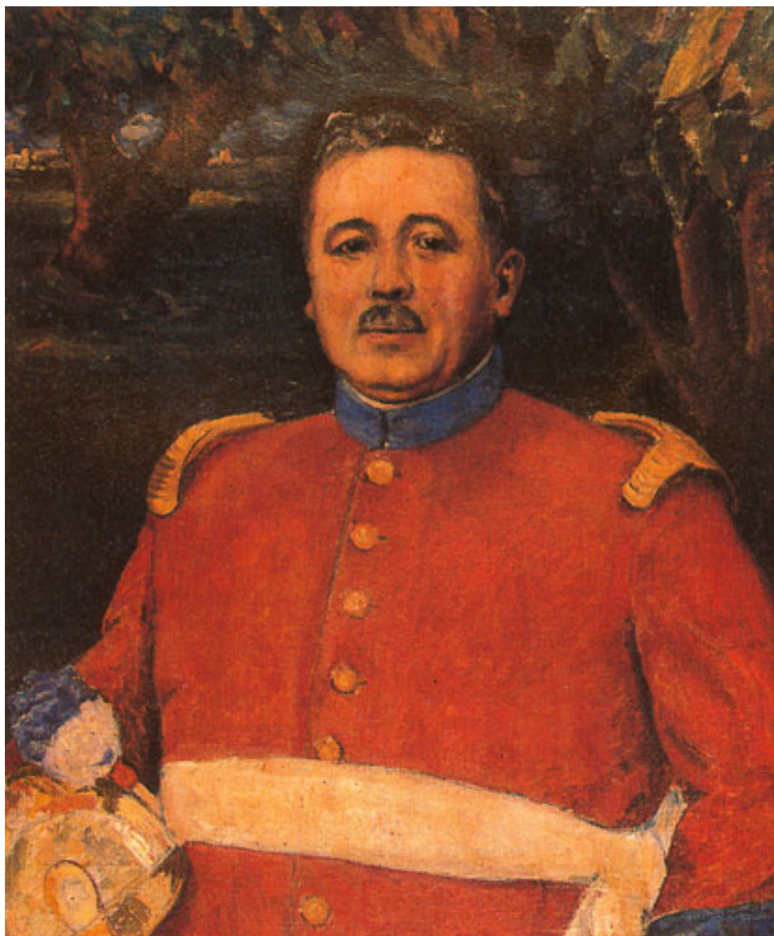
EL PADRE DEL PINTOR