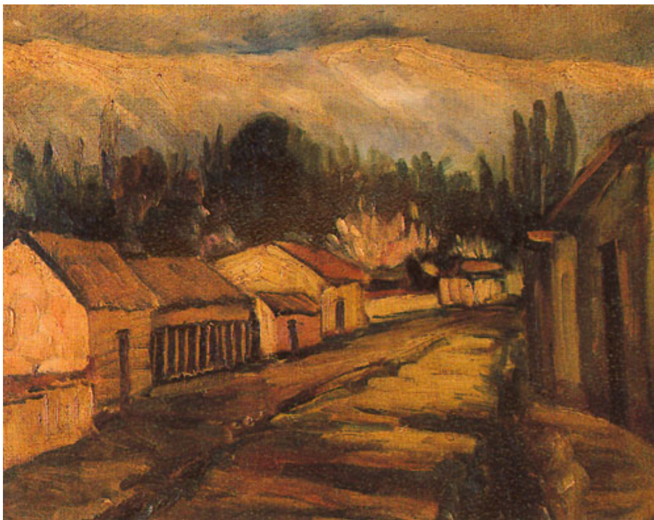
PAISAJE DE MACHALÍ