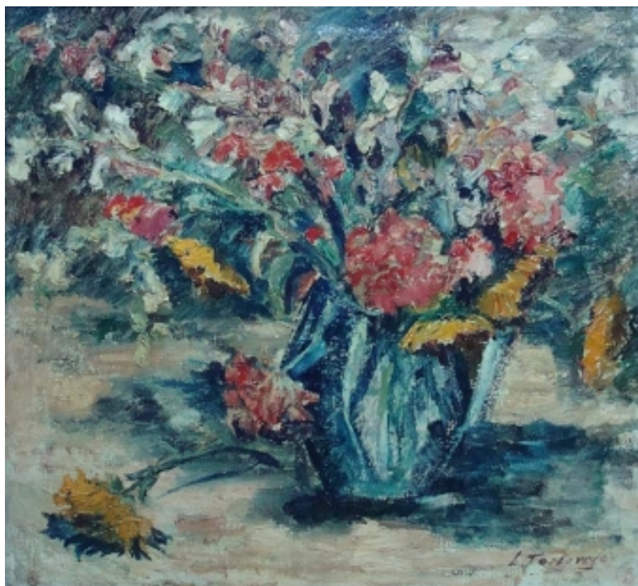
JARRÓN AZUL CON FLORES

BIBLIOTECA/MNBA. Colección de Artículos de Prensa del Artista LUIS TORTEROLO publicados en los diarios y revistas entre 1930-2000.