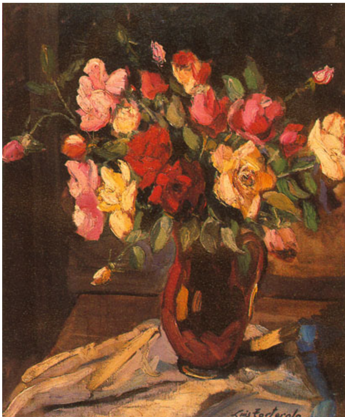
RAMO DE ROSAS