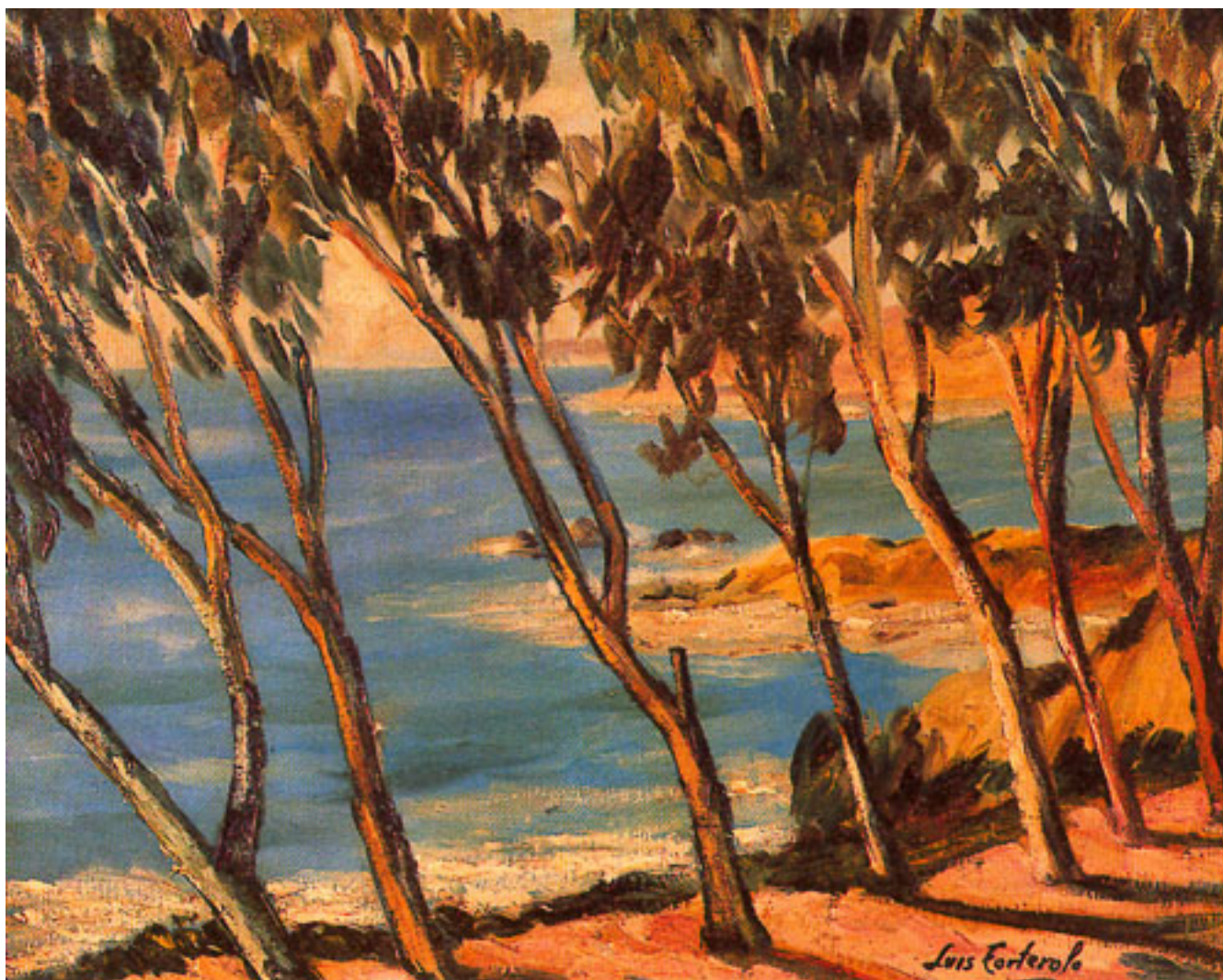
PAISAJE DE ÁRBOLES A LA ORILLA DE COSTA