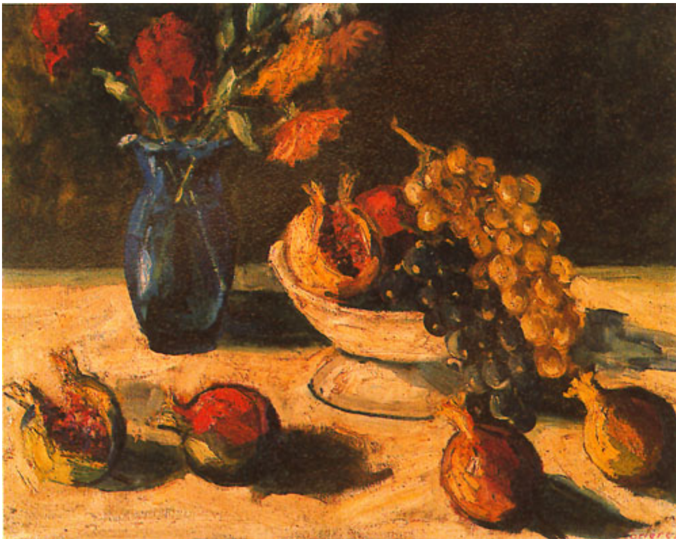
NATURALEZA MUERTA CON FLORES Y FRUTAS