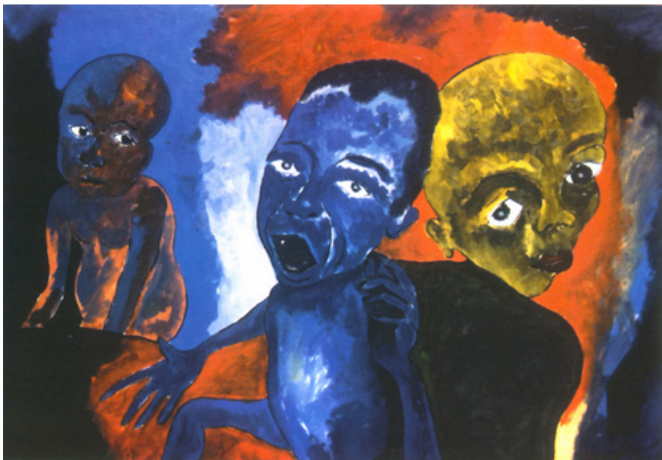
LOS NIÑOS DE RUANDA