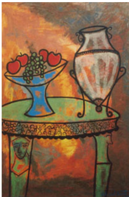
FRUTERA Y JARRO