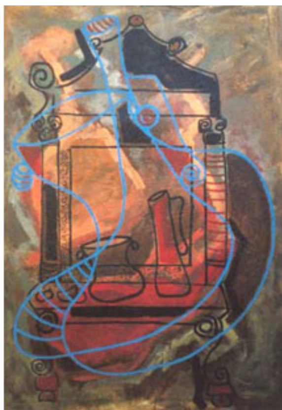
MUEBLES CON JARROS