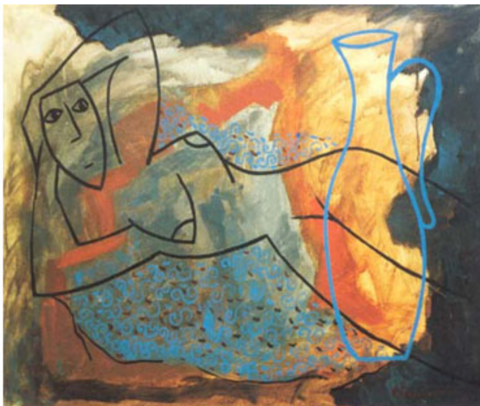
FIGURA CON JARRO