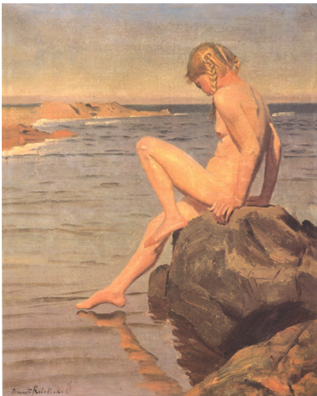
NIÑA FRENTE AL MAR