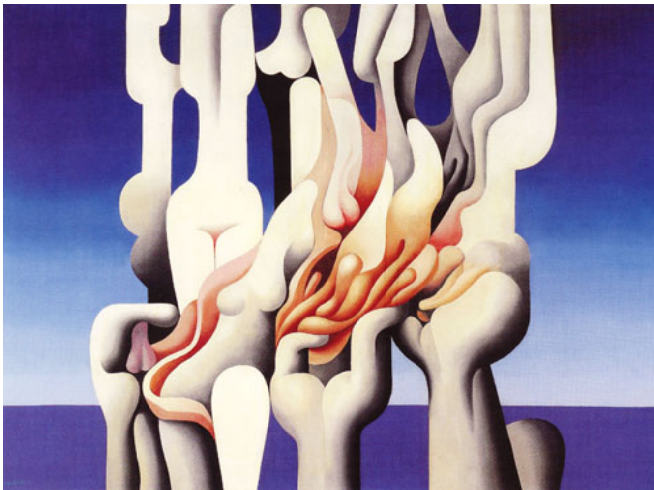
LA COSA HUMANA