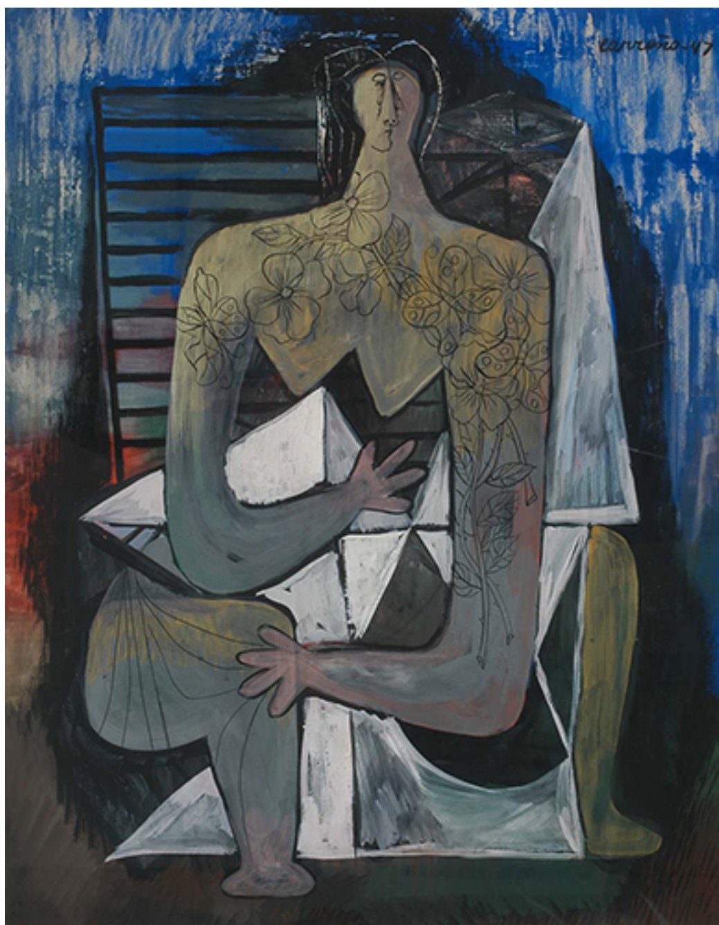
FIGURA CON TATUAJE