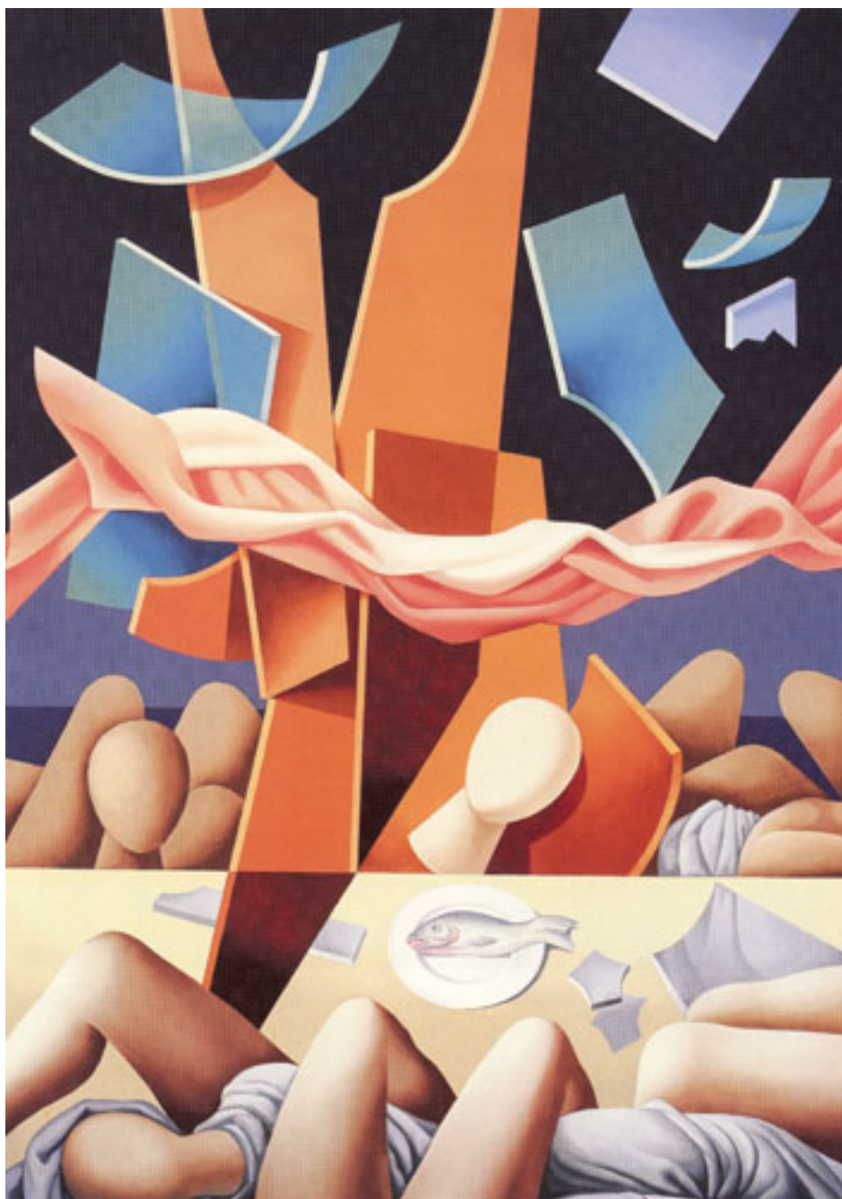
DE LA SERIE LA CAIDA DE LOS GRANDES MITOS