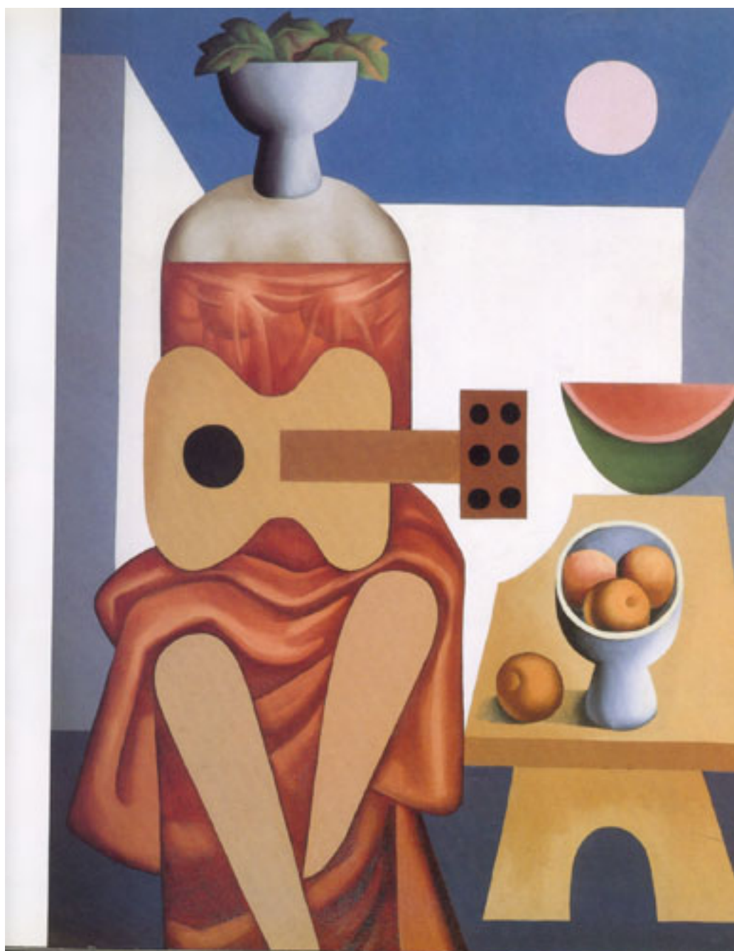
MUJER CON GUITARRA