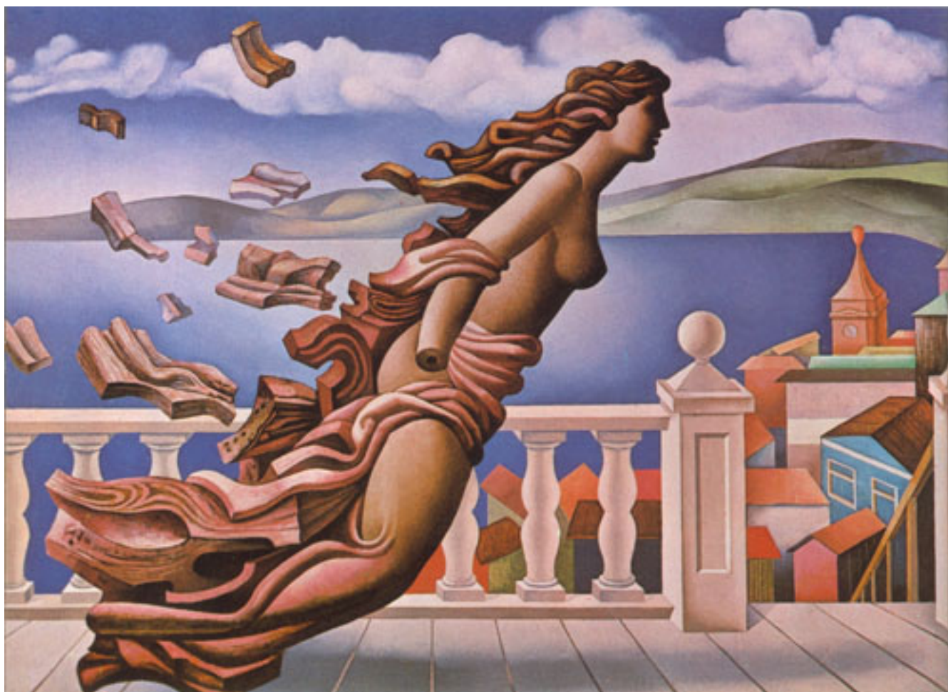
MASCARÓN DE PROA