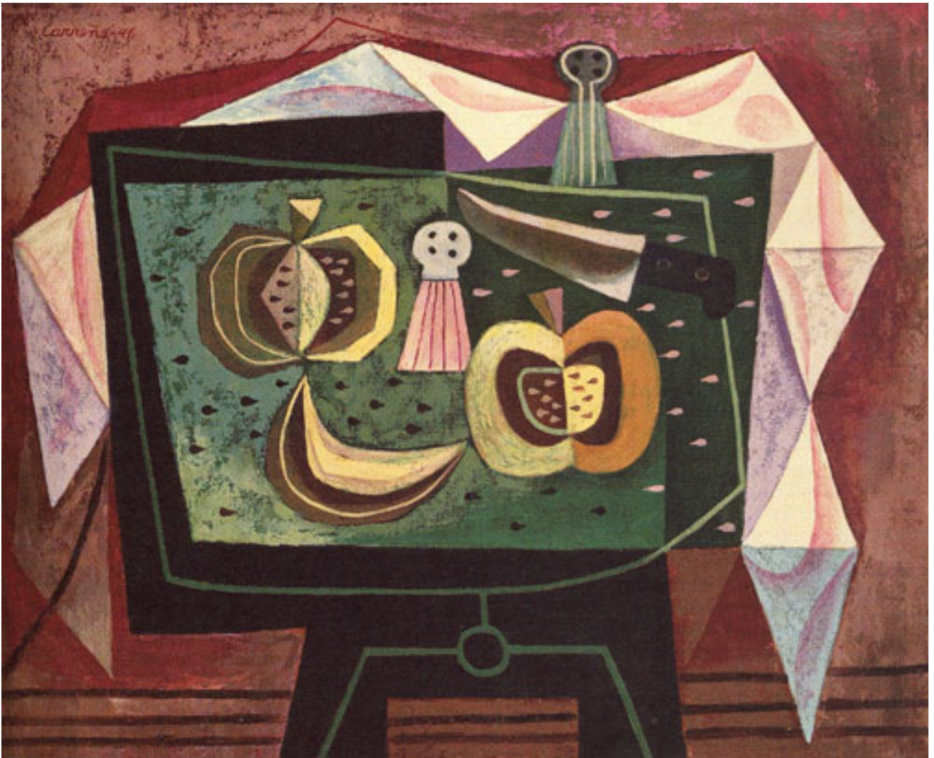
STILL LIFE WITH FRUITS