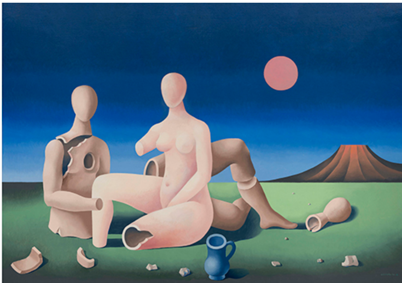
PAREJA EN EL DESIERTO