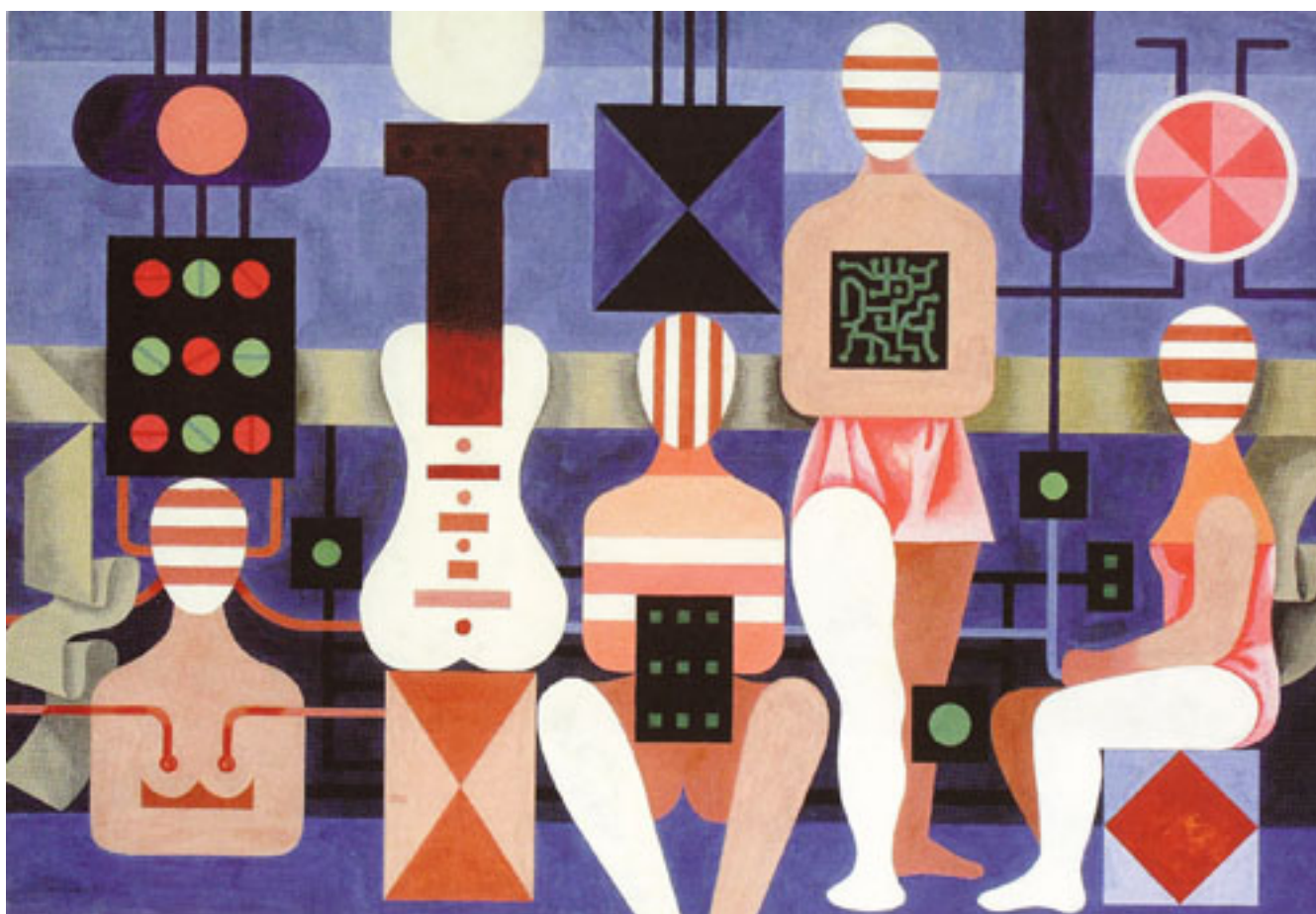
LAS COMPUTADORAS DE LA NOCHE