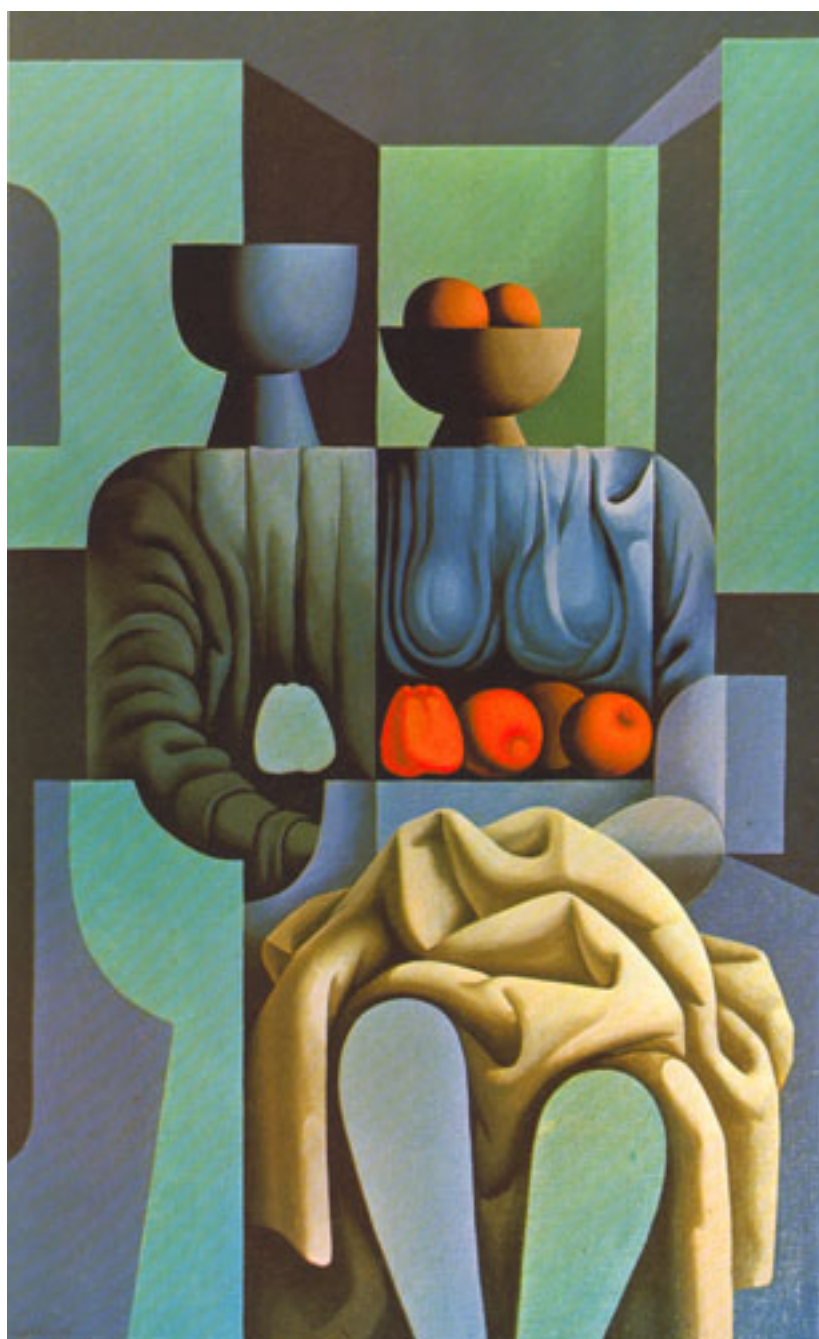
LA MANZANA EVADIDA