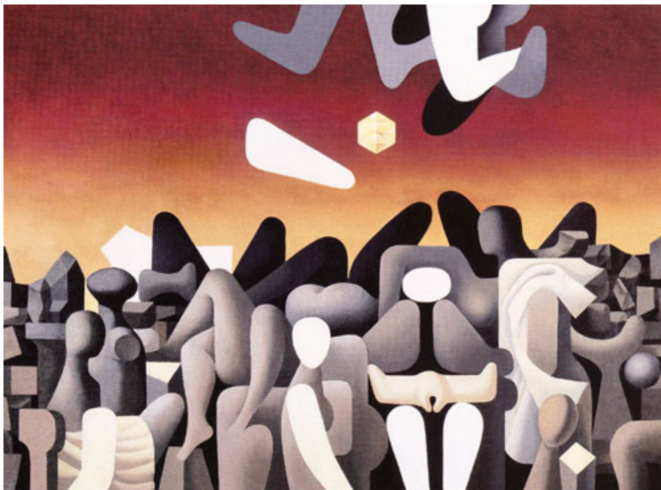
DE LA SERIE LA CAIDA DE LOS GRANDES MITOS