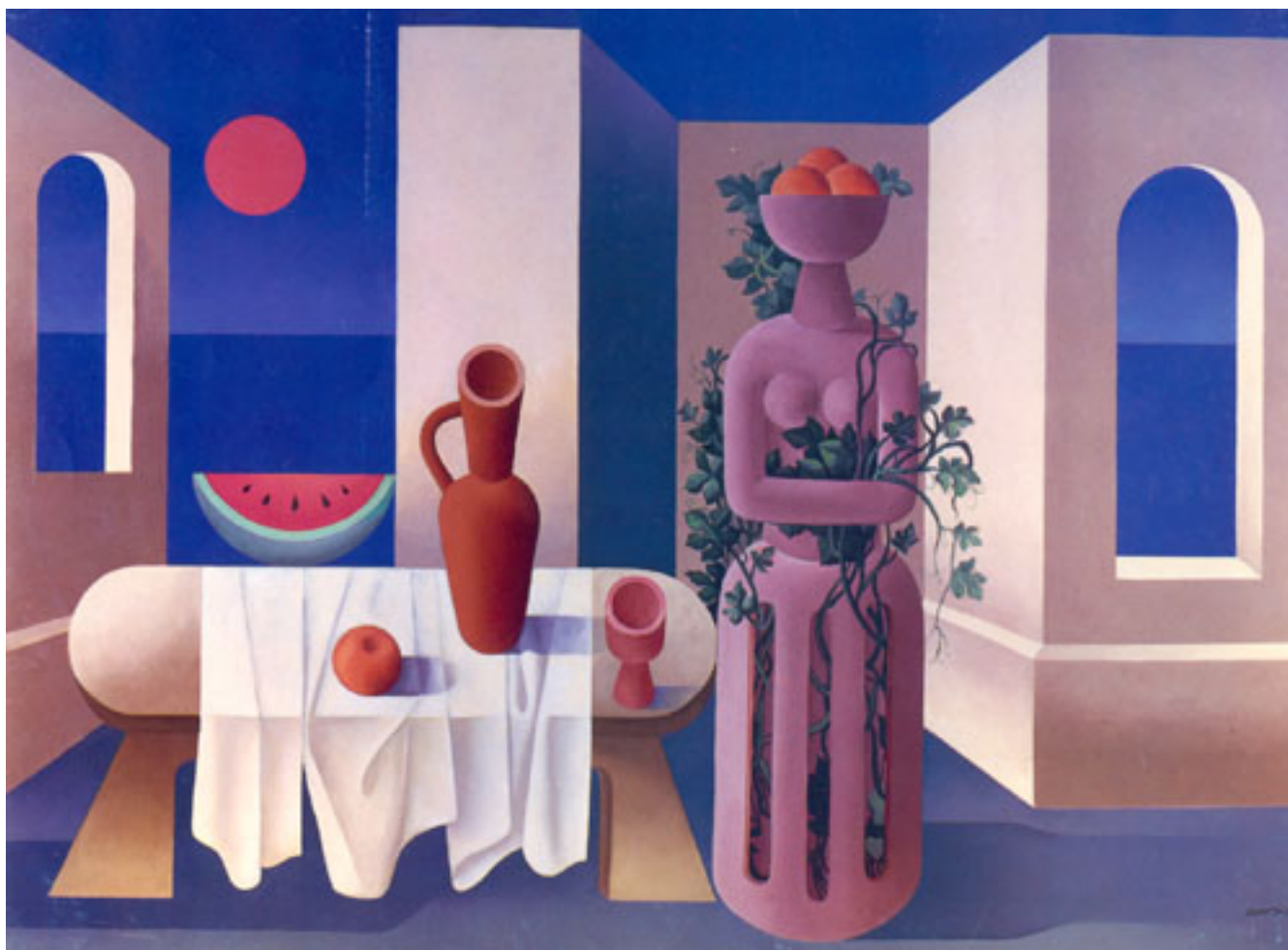
ELEGÍA A VIOLETA PARRA