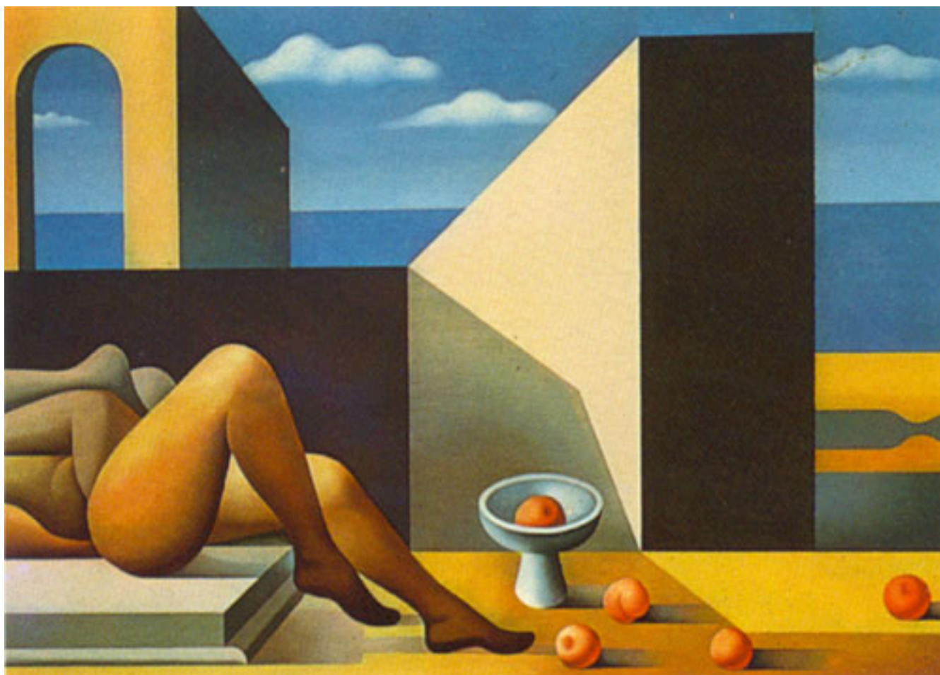
ENCUENTRO JUNTO AL MAR