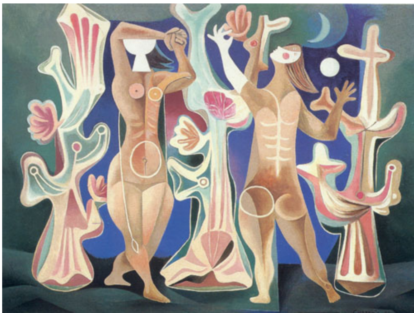
MUJERES Y CORALES