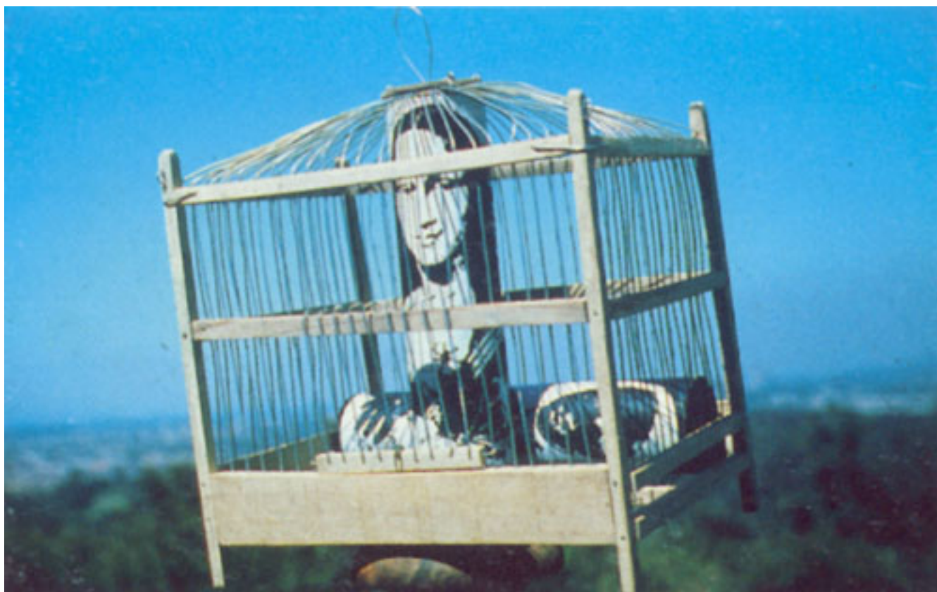
LA GIOCONDA EN JAULADA