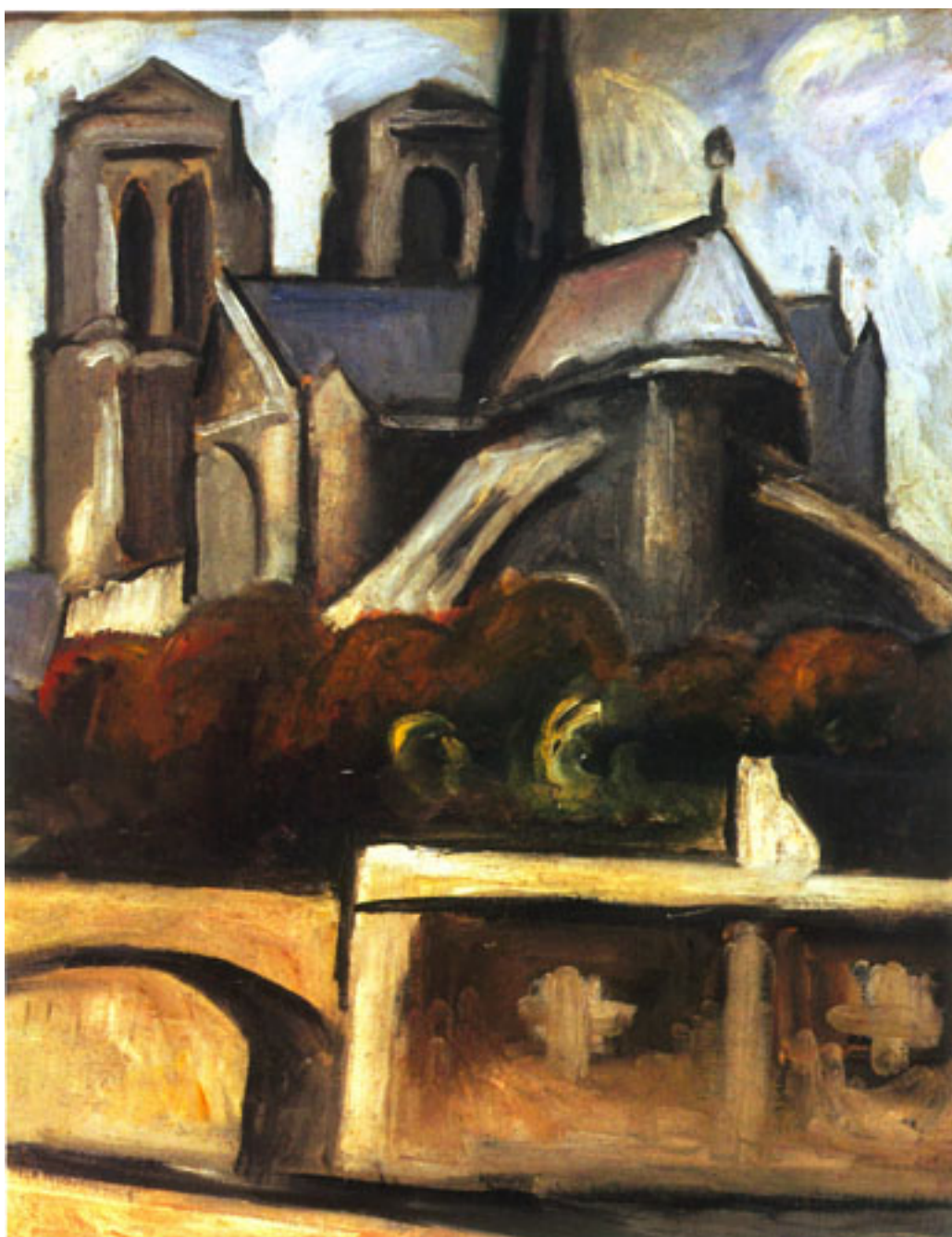
NOTRE DAME DE PARÍS