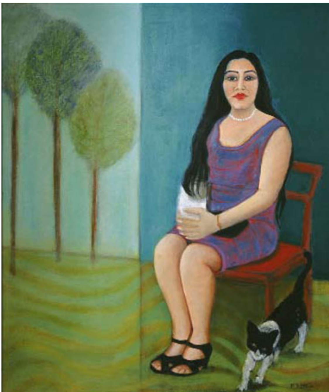
A LA ESPERA DE UN SUEÑO