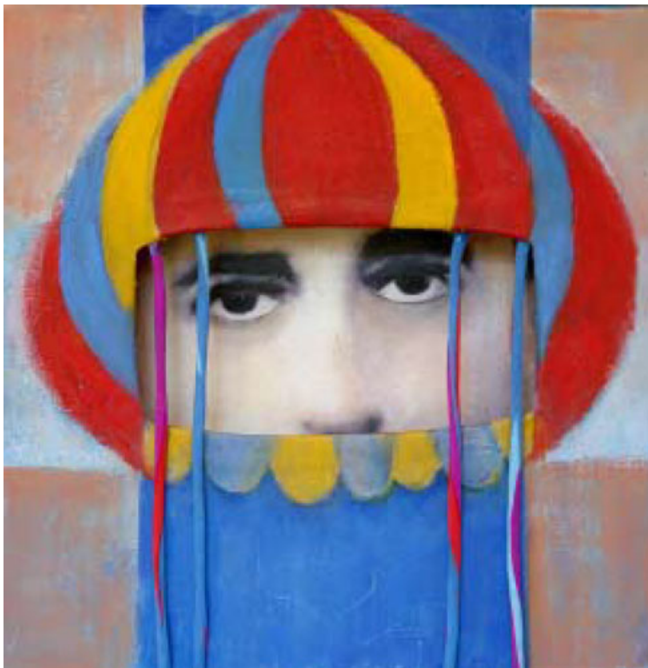
HOMENAJE A VICENTE HUIDOBRO