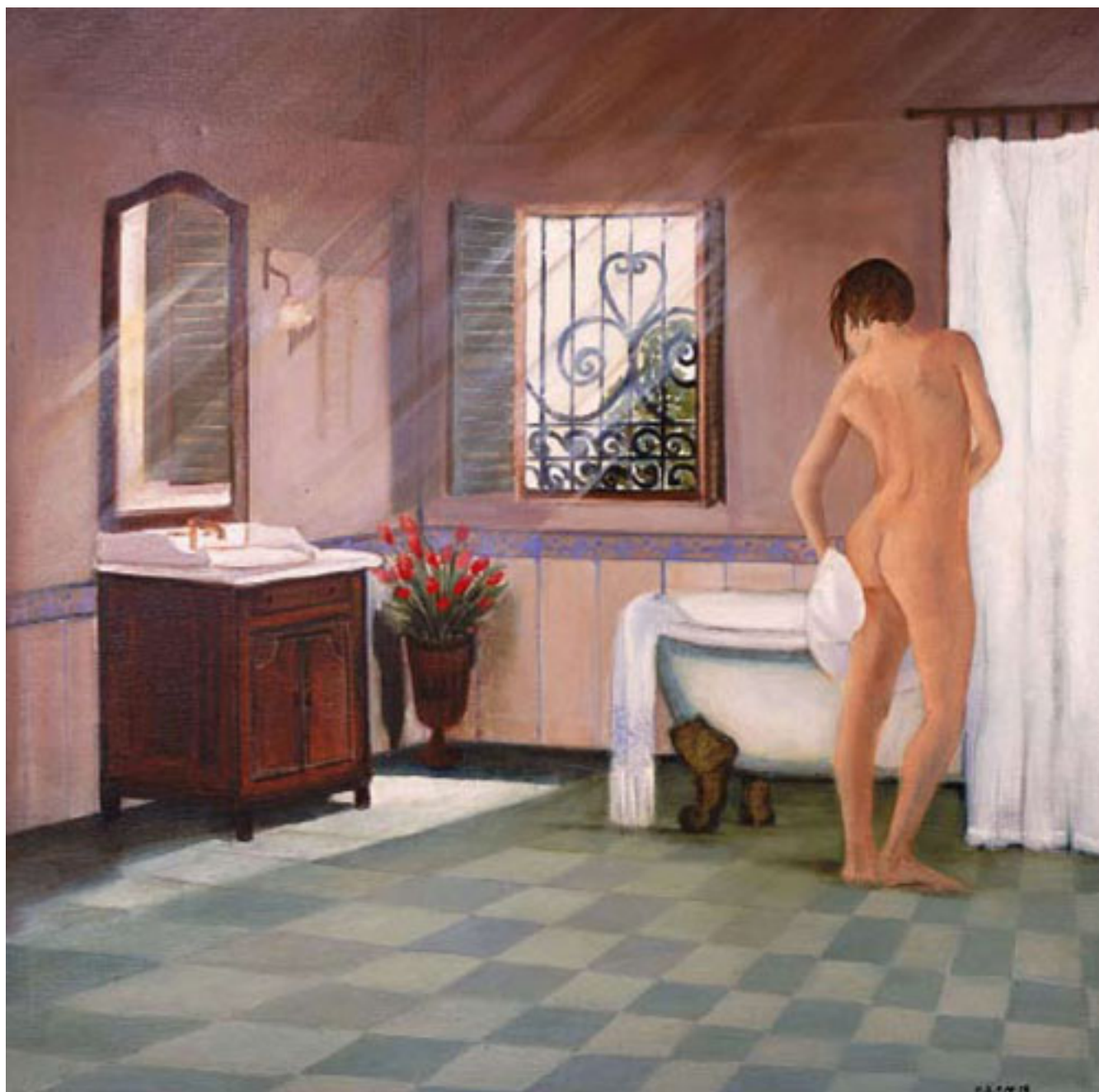
LA MAGIA DE LA MAÑANA