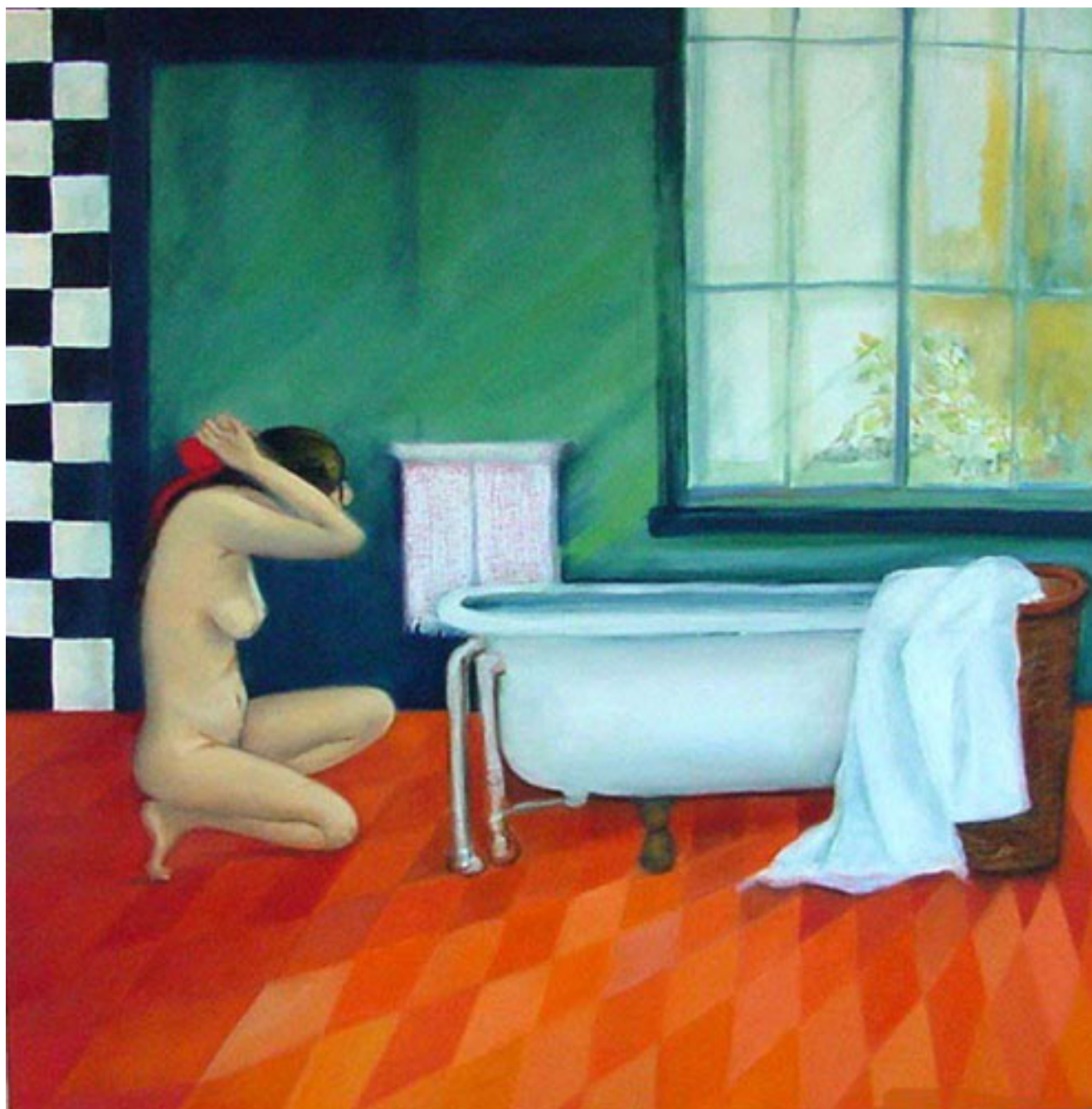
LA CEREMONIA DEL BAÑO