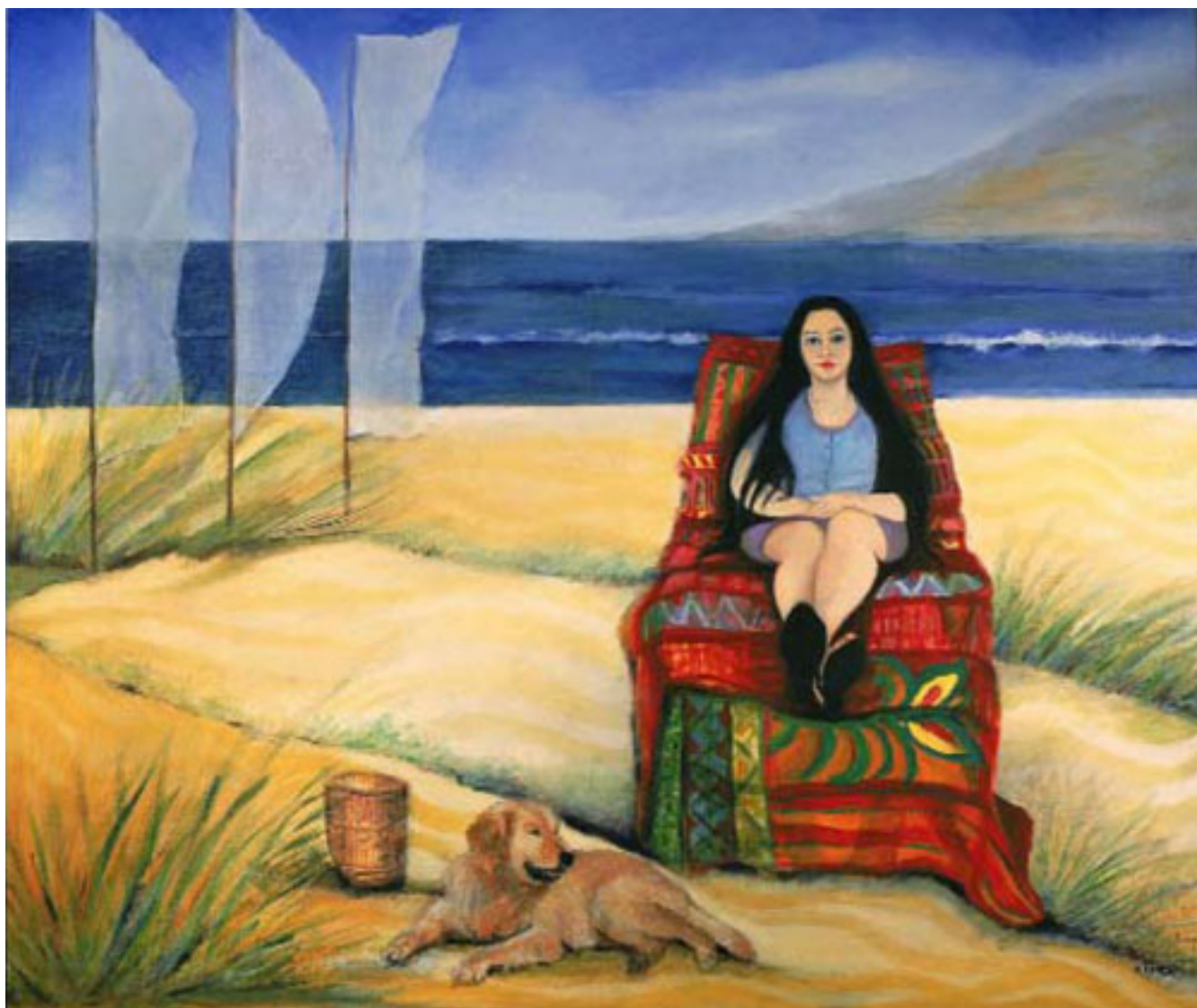
MENSAJERA DEL TIEMPO