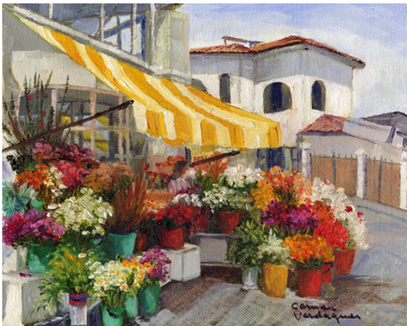
SERENA VENTA DE FLORES