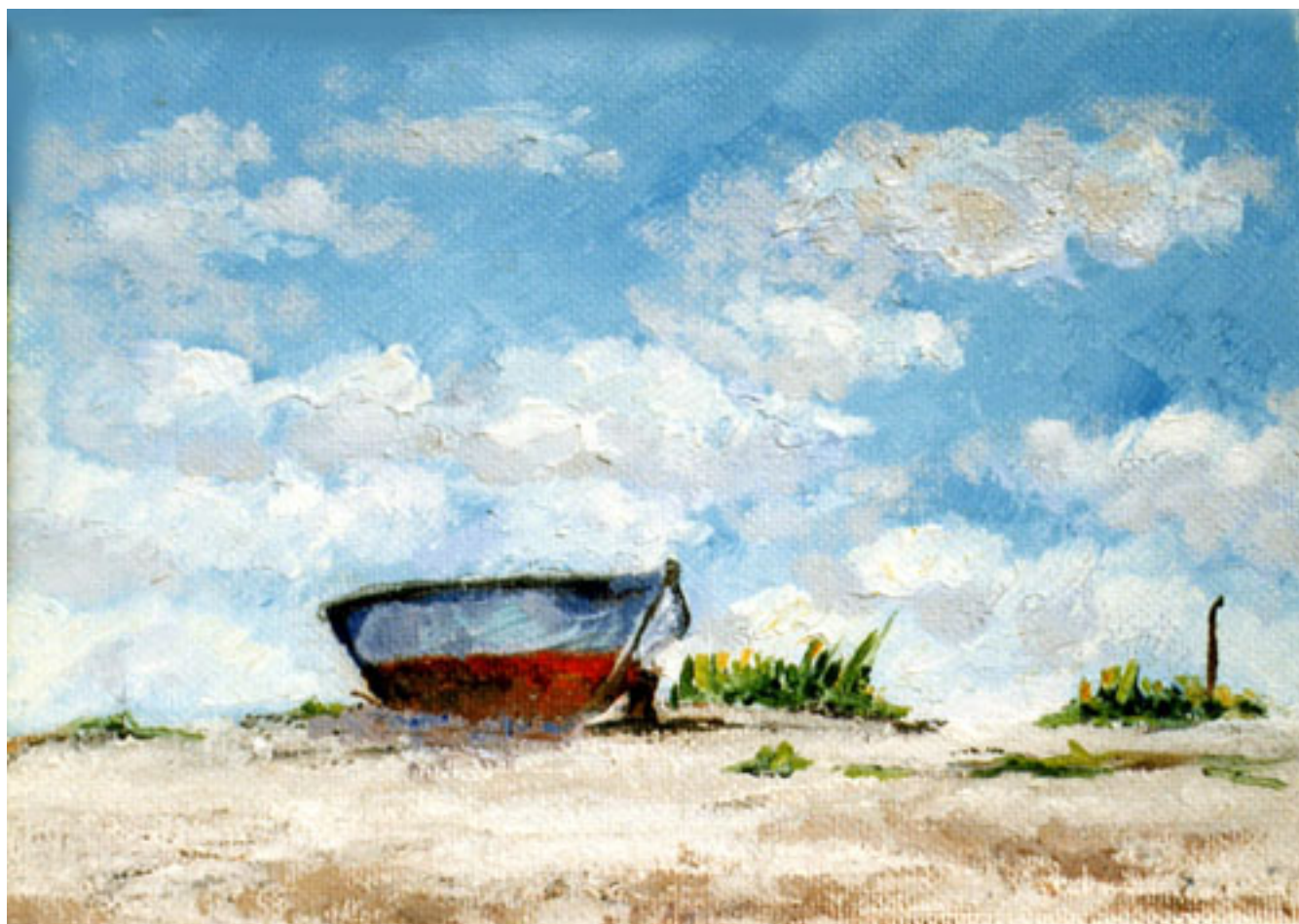
DESDE PUERTO MONTT