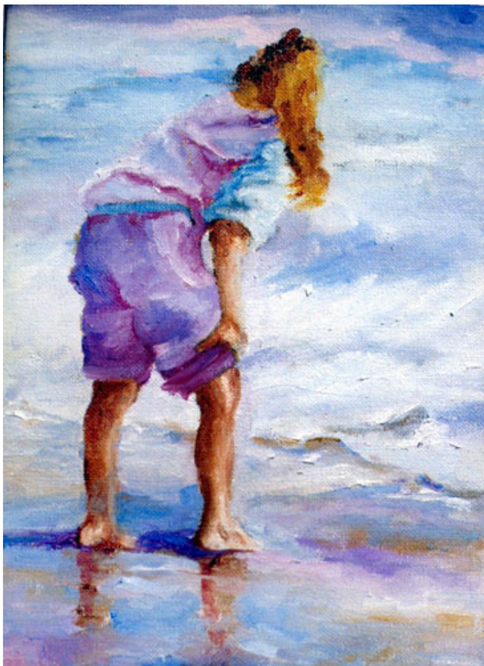
A LA ORILLA