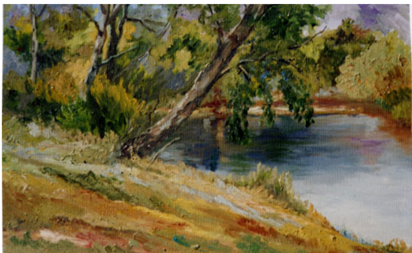
A ORILLAS DEL LAGO