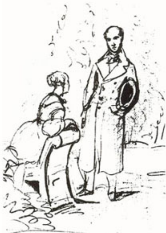
RETRATO DE MAURICIO RUGENDAS