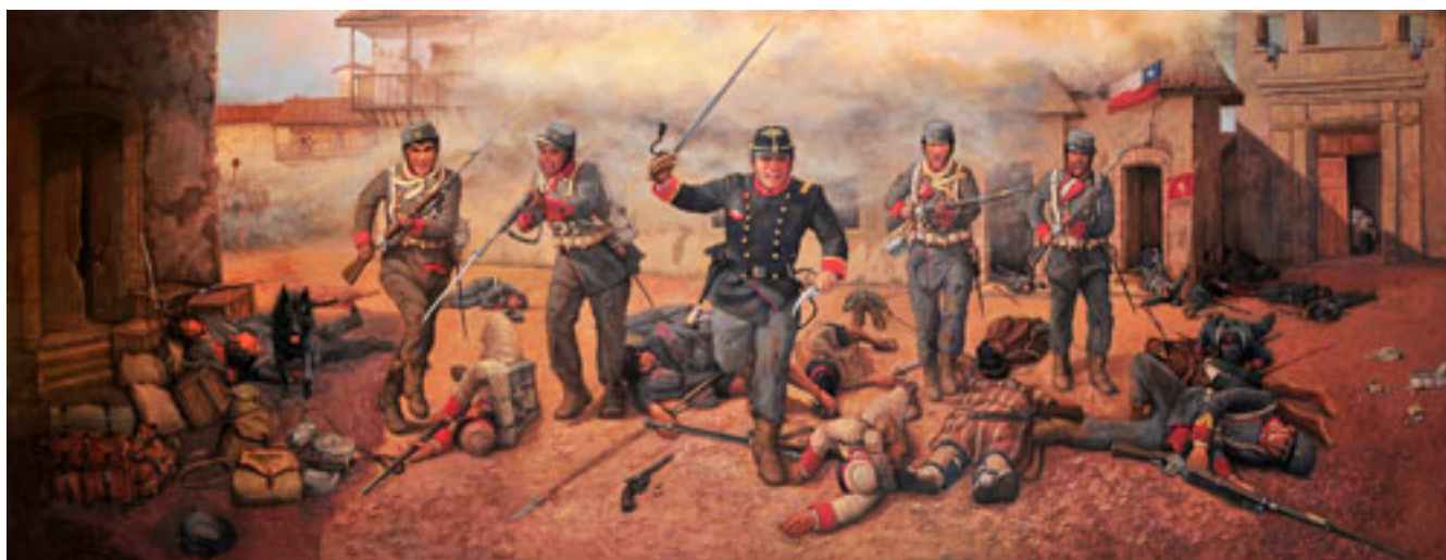
LA ÚLTIMA CARGA DEL CHACABUCO