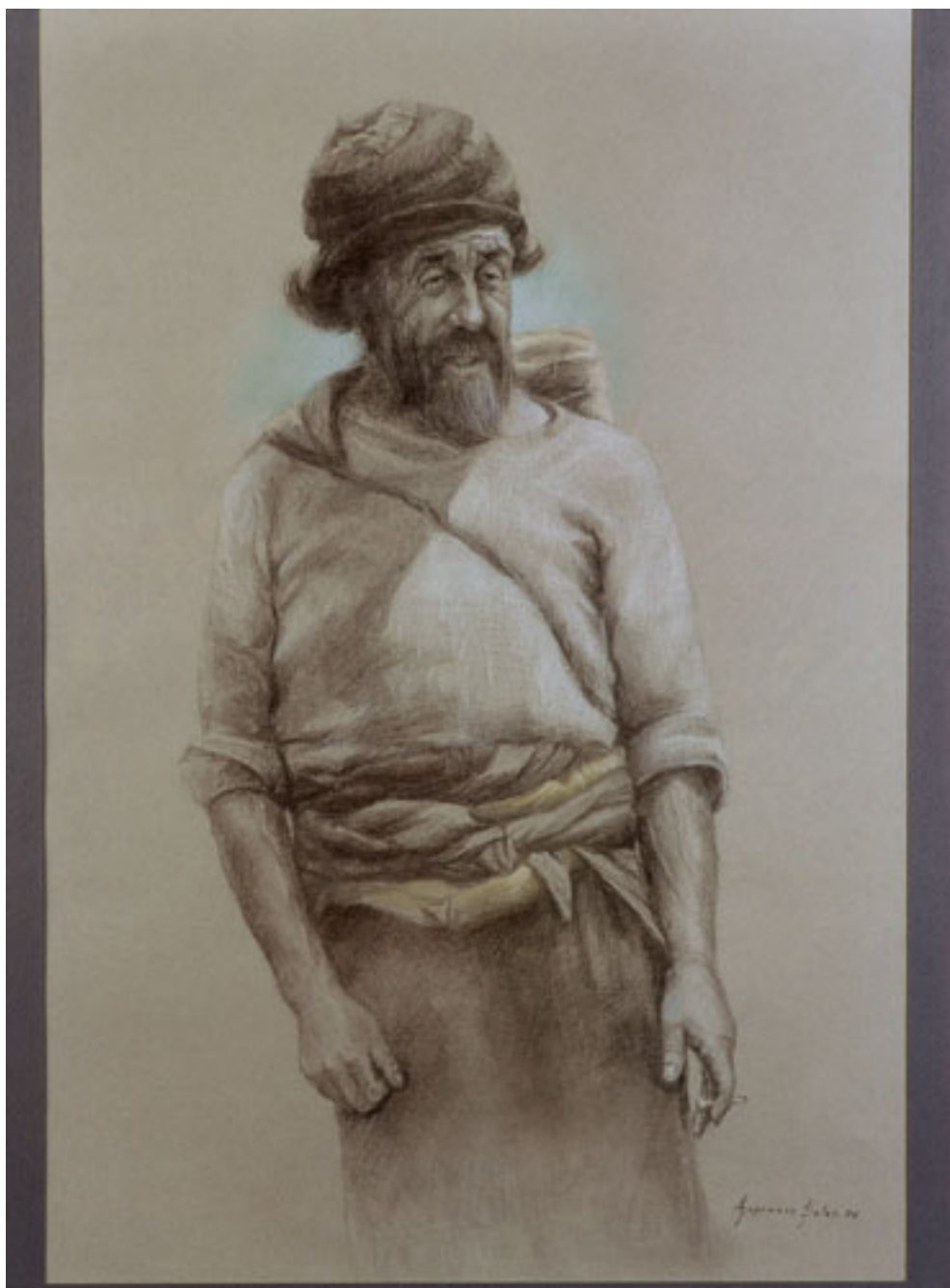
VIEJO PESCADOR CHILOTE