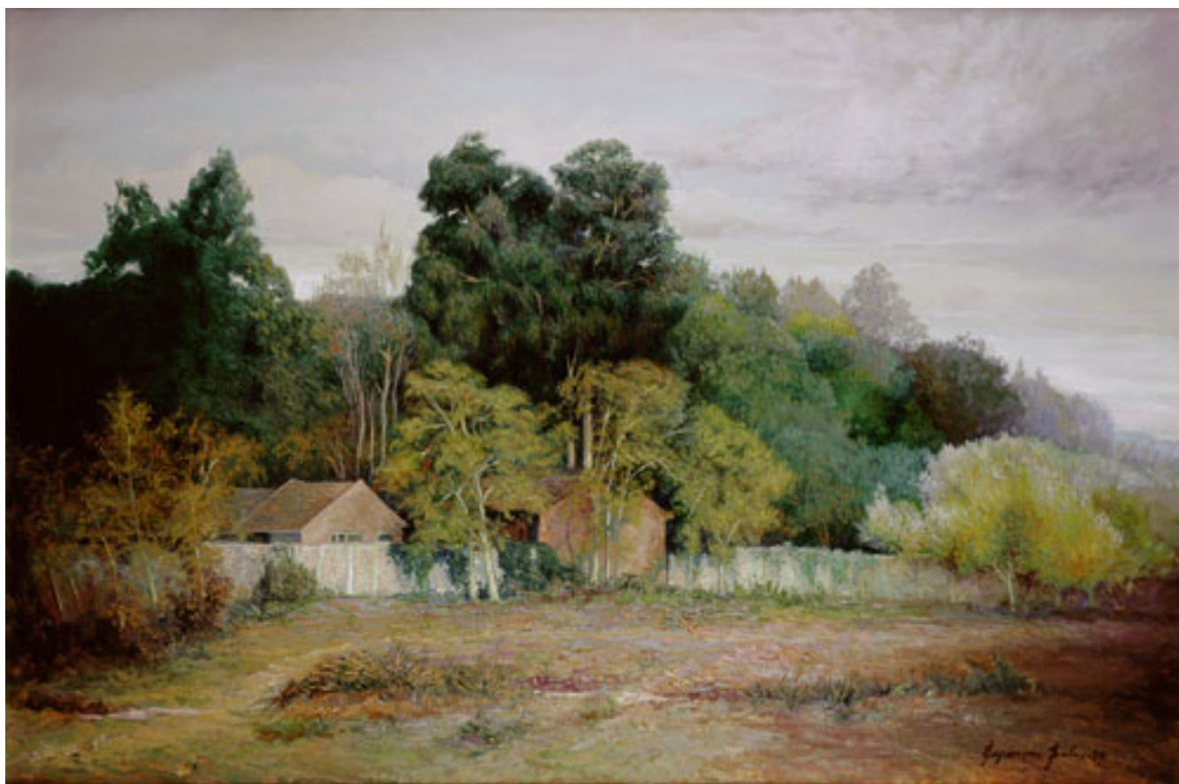
ESCUELA AGRÍCOLA LAS GARZAS