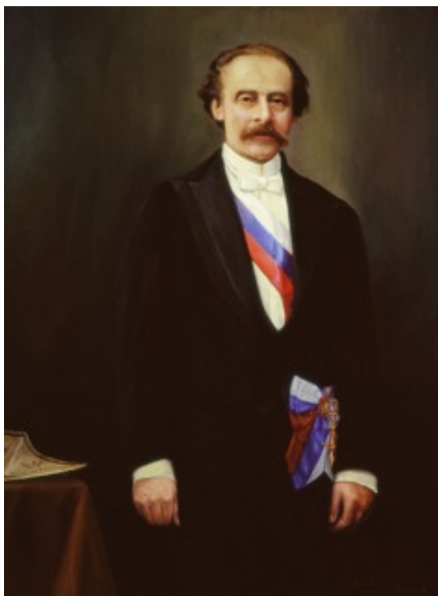
RETRATO DE JOSÉ MANUEL BALMACEDA