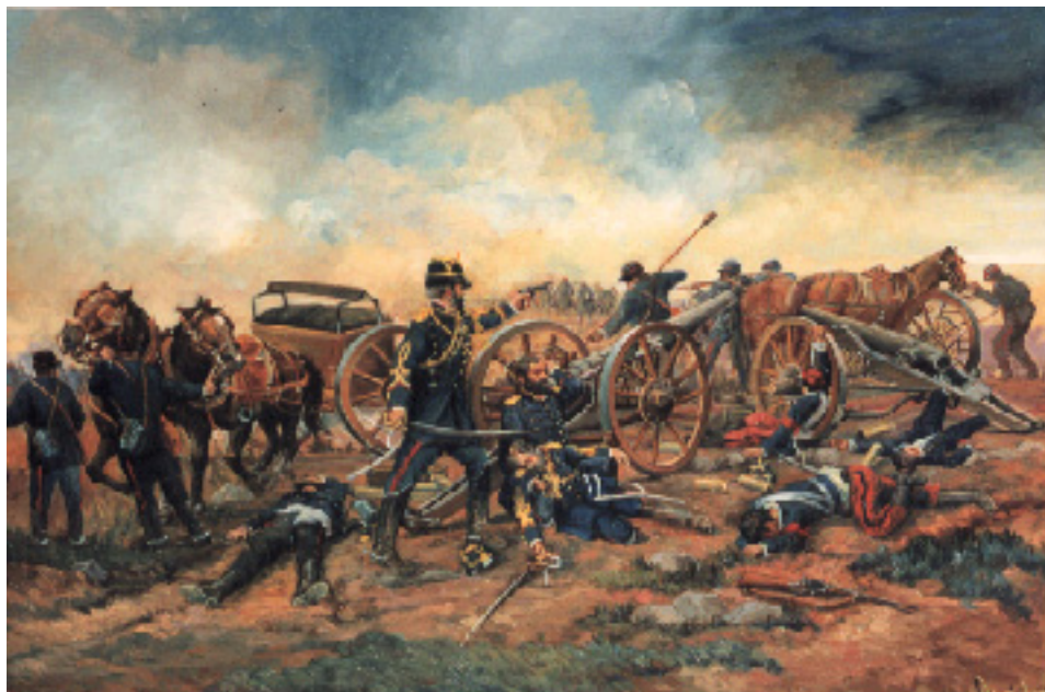
REVOLUCIÓN DE 1891, ESCENA DE ARTILLERÍA