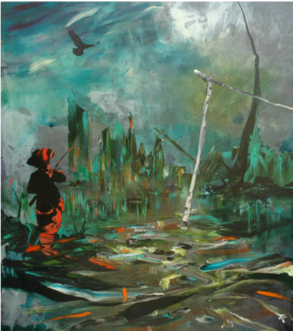
ANSWERS AT NIGHT