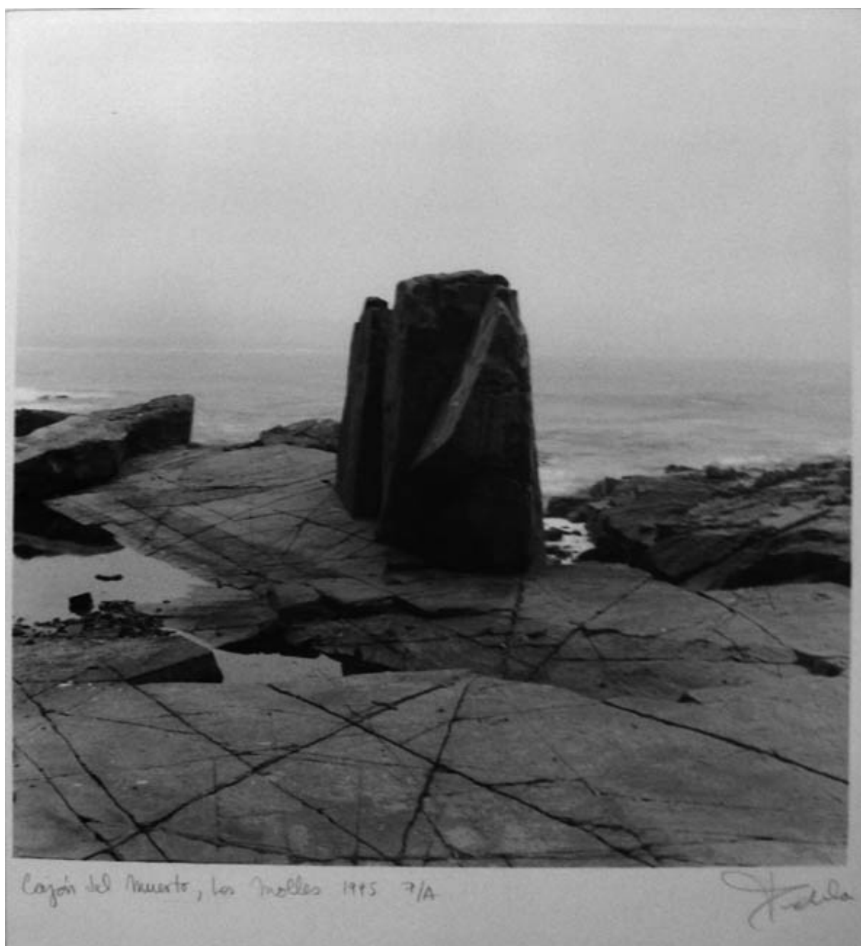
Cajón del Muerto, Los Molles 1995 7/A