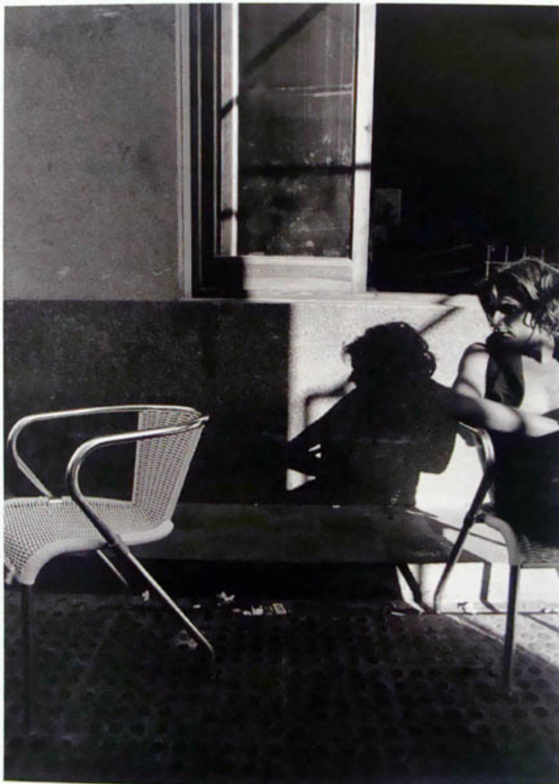
HOMBRE DE FORMENTERA