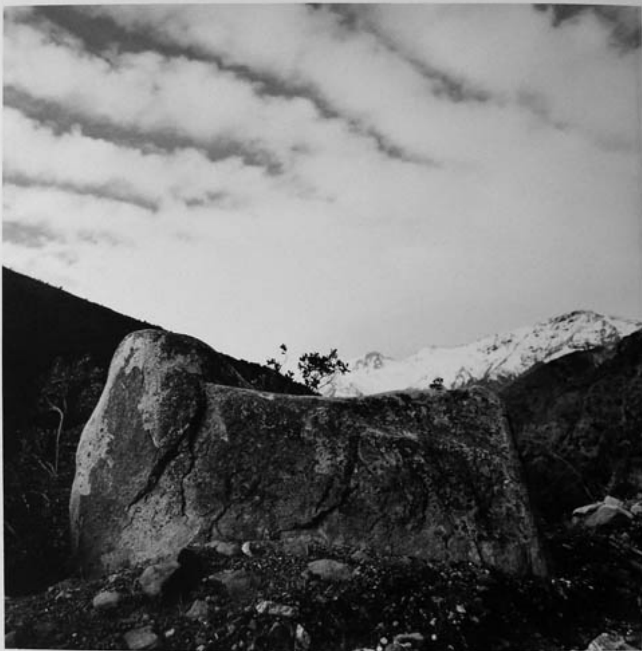
Cajón del Maipo, 1945 7/A