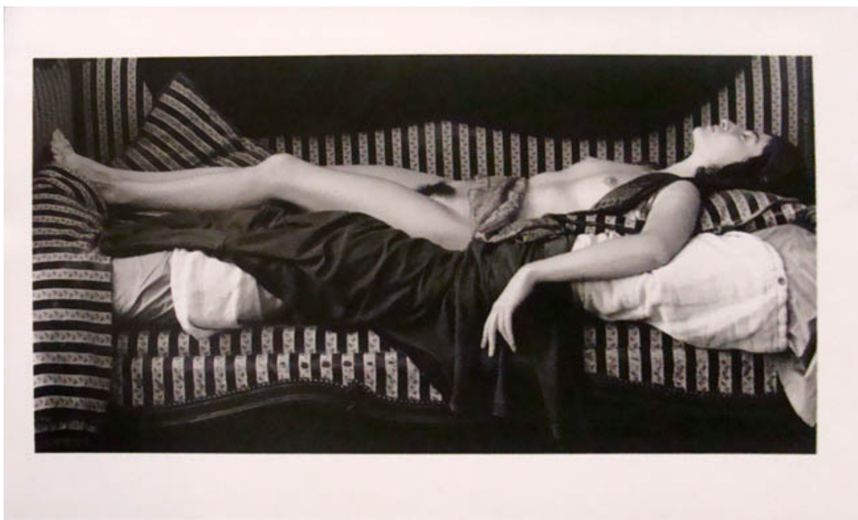
ANNE SOBRE EL DIVÁN