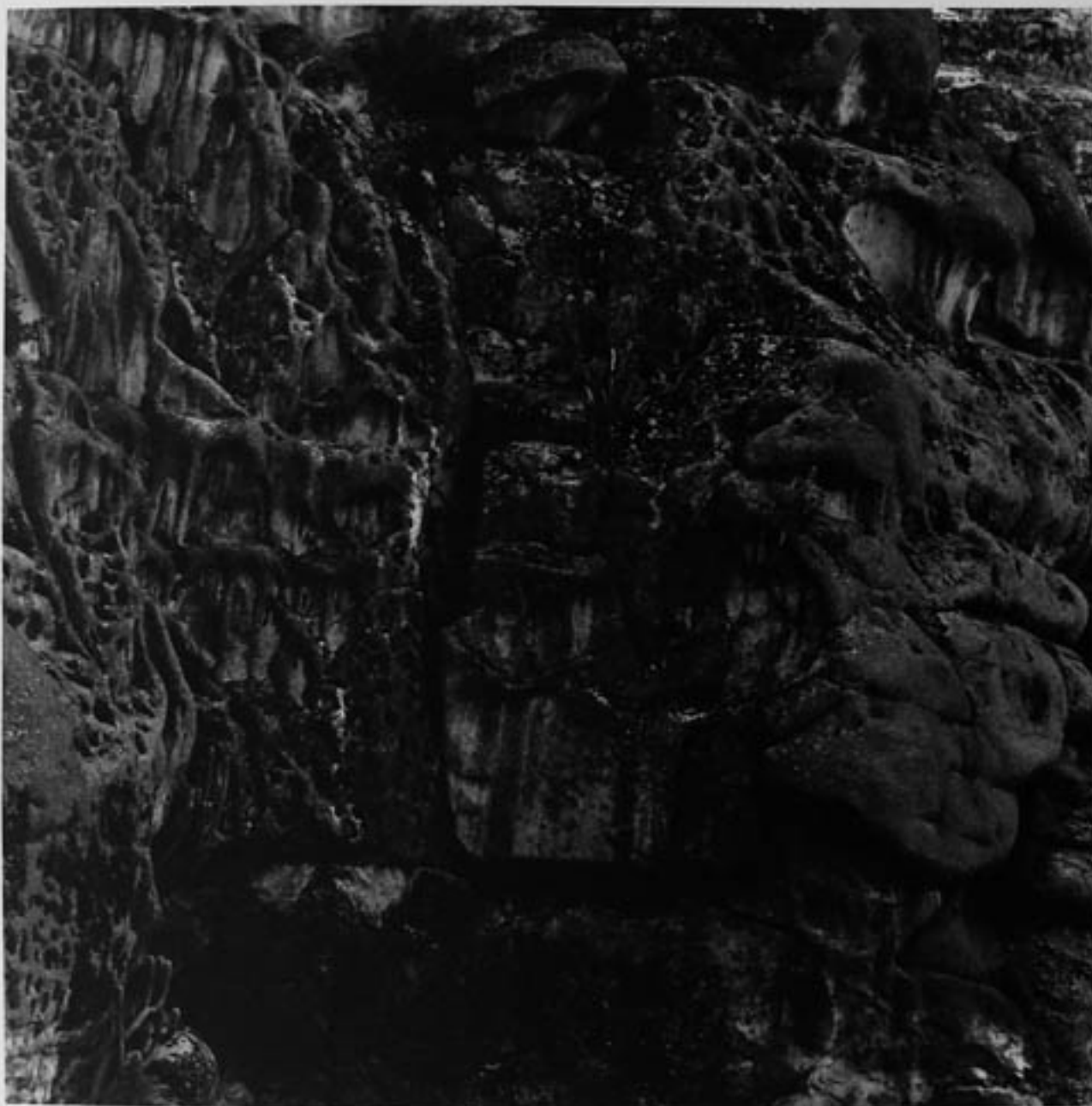
Cajón del Colorado, 1995 P/A