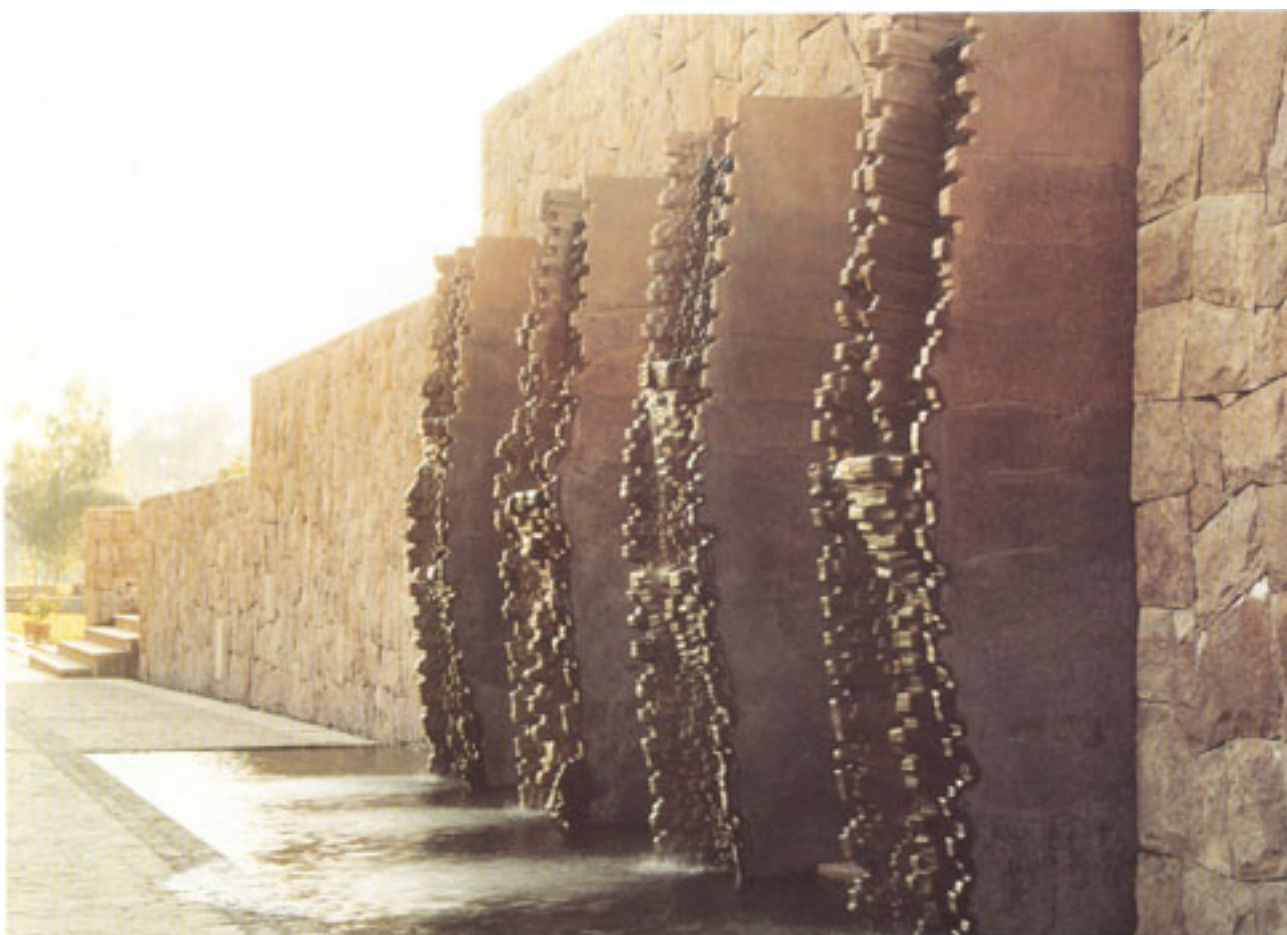
CASA DE PIEDRA