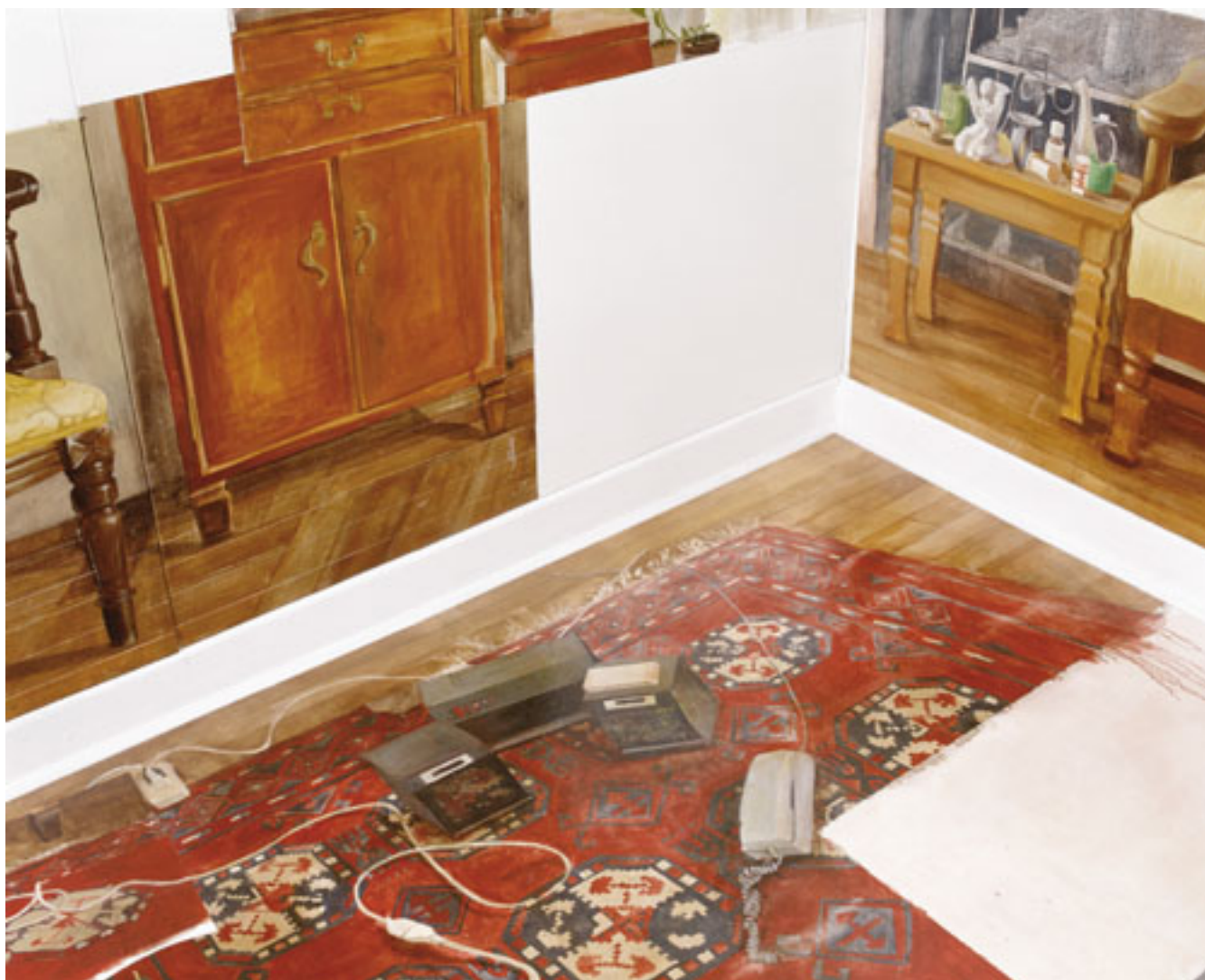
SIN TÍTULO (detalle montaje pictórico)