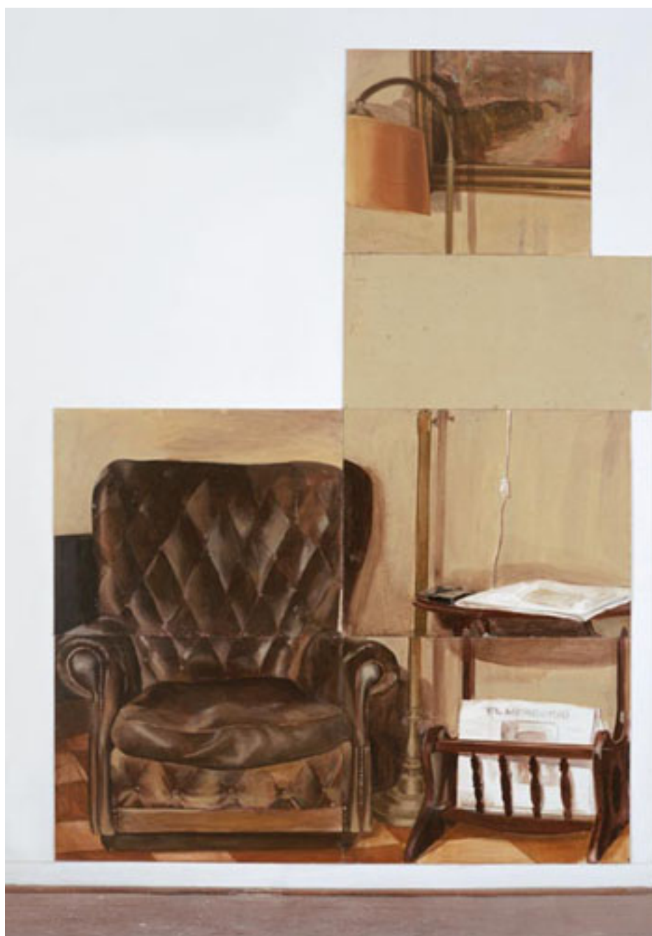
SIN TÍTULO (detalle instalación pictórica)