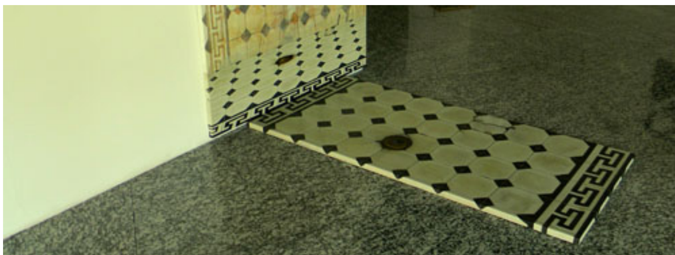
SIN TÍTULO (díptico)