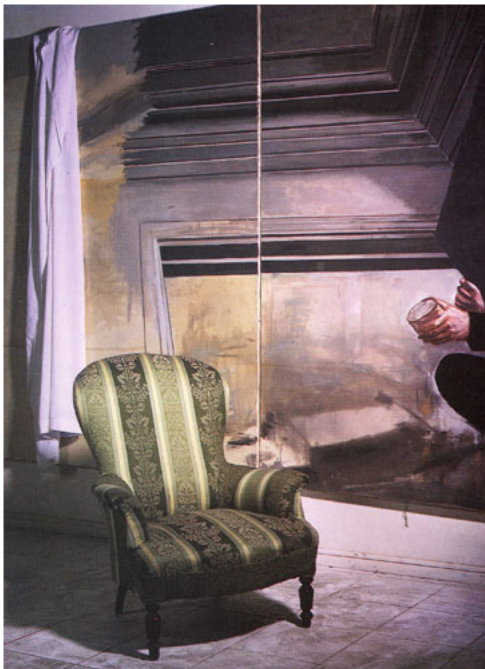
CAUTIVERIO FELIZ (detalle)