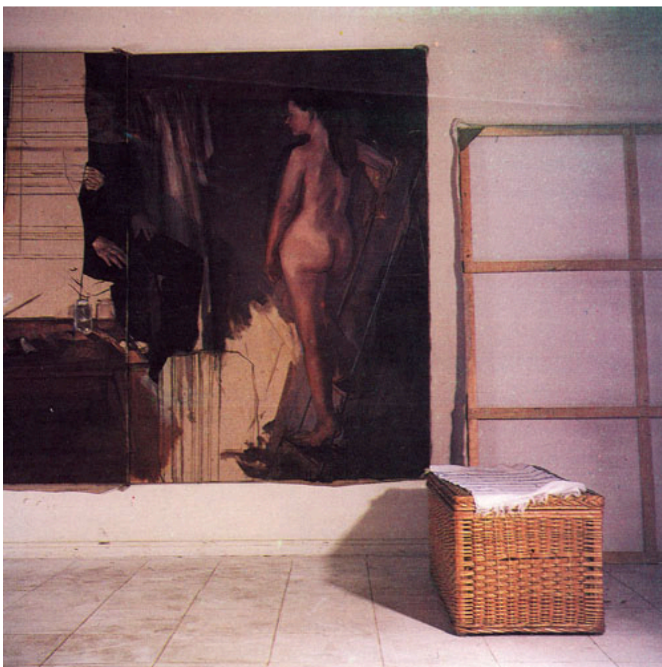
CAUTIVERIO FELIZ (detalle)

SAN ANTONIO MUSEUM OF TEXAS, 1997. Prospect and Perspective: Recent Art from Chile . San Antonio, Texas: San Antonio Museum of Texas.