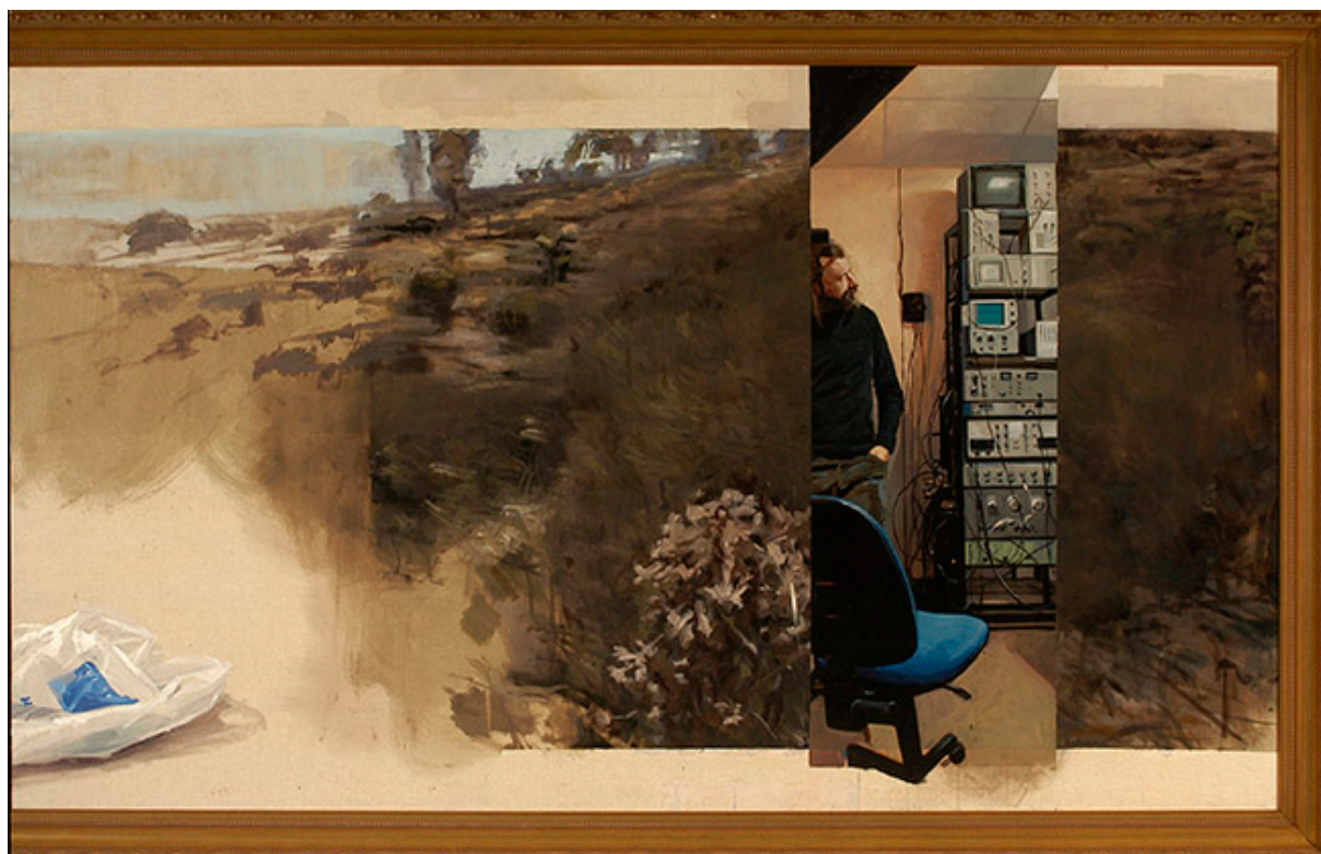
CAUTIVERIO FELIZ (detalle)