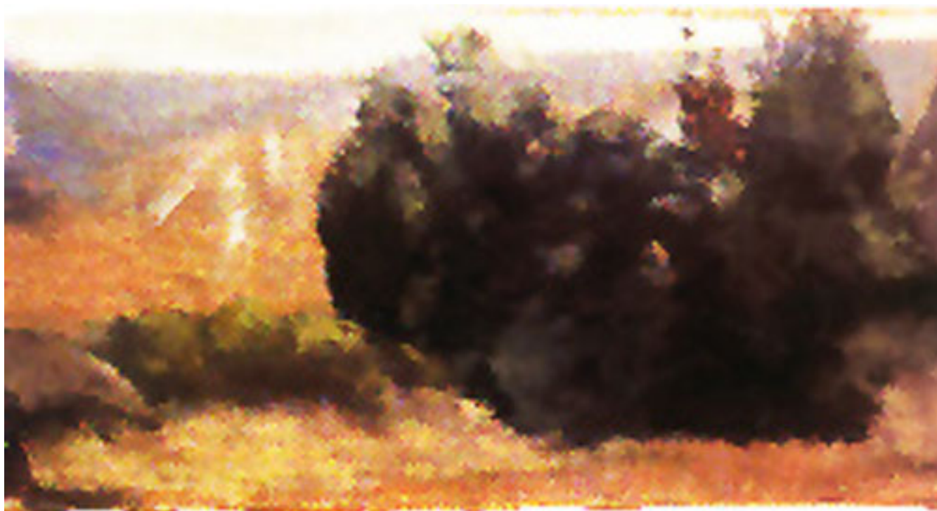
ANGOSTURA DE PAINE (detalle)