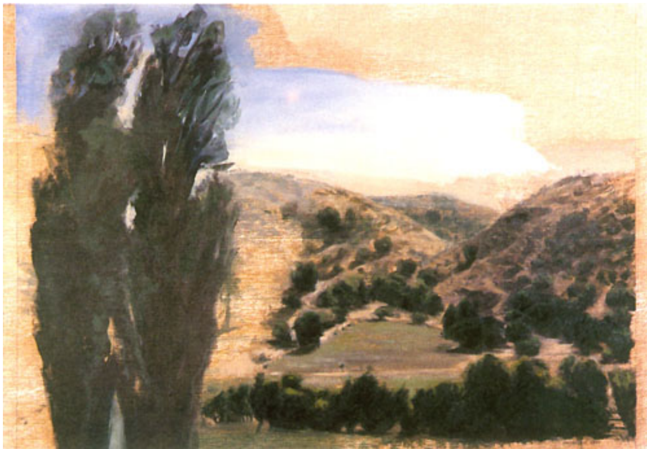
ÁLAMOS POTRERO, LADERA CON ESPINO