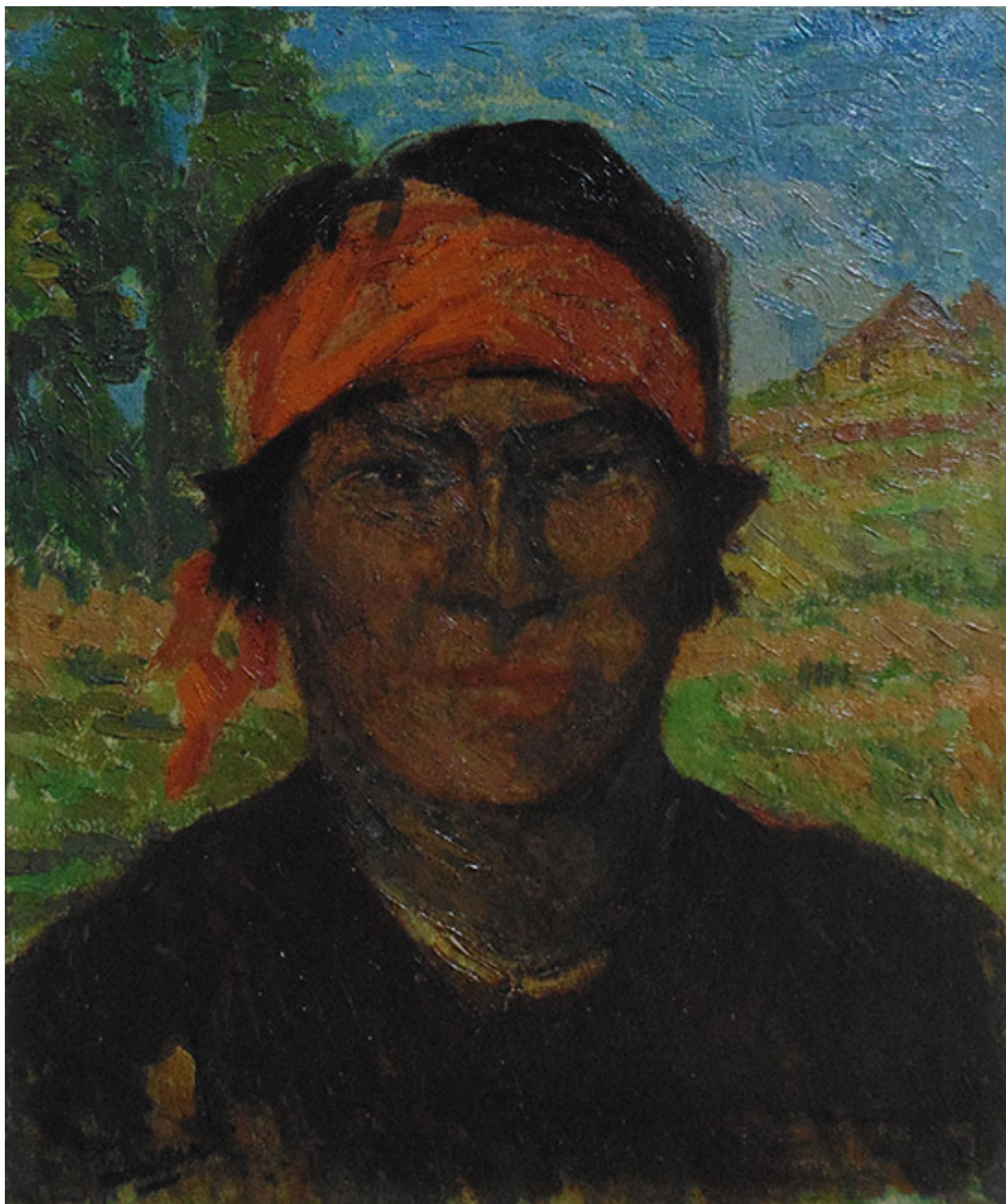
CABEZA DE INDIO