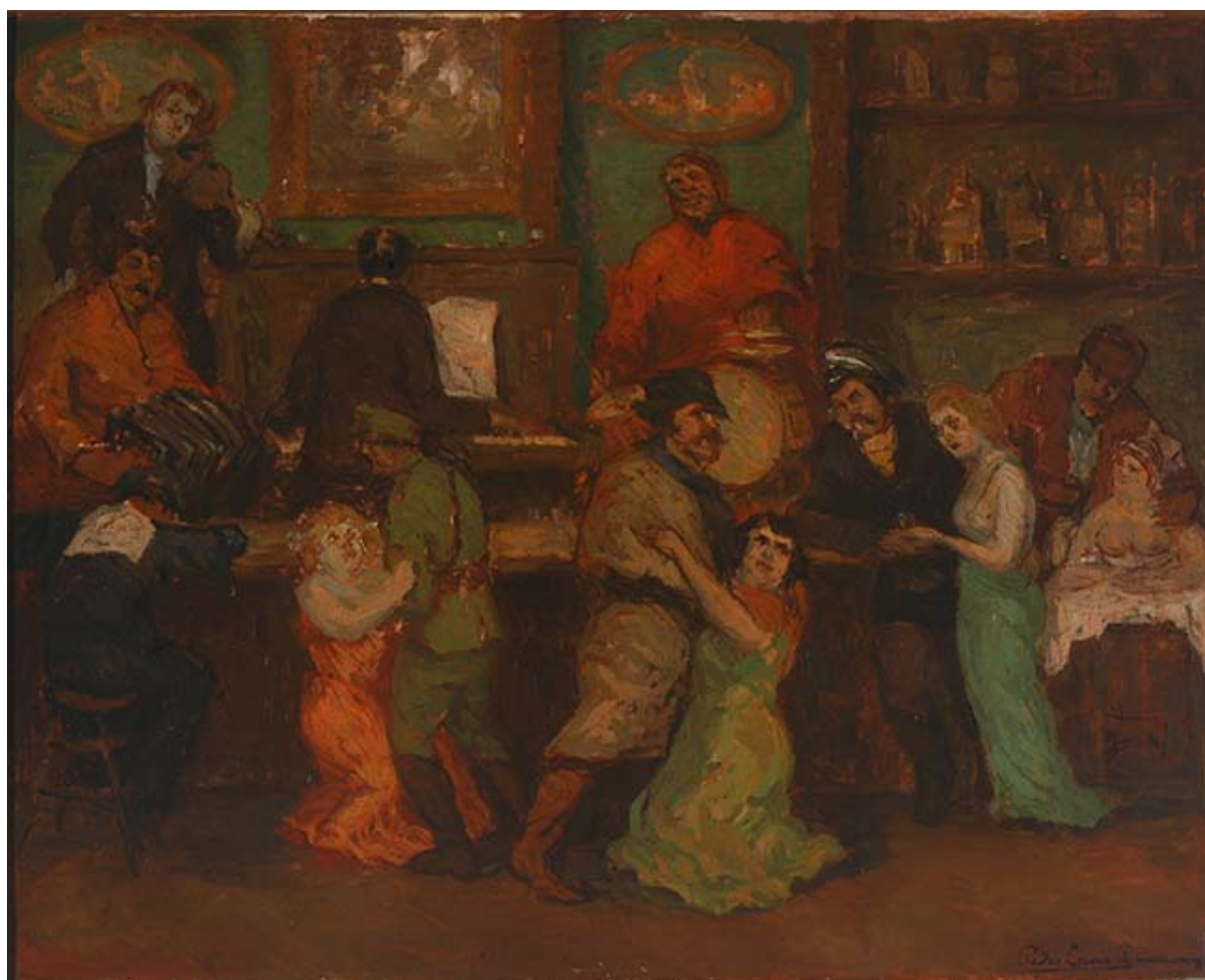
EL BAILE DE LAS ENANAS MAGALLANES

ZAMORANO, Pedro y HERRERA, Patricia. 2017. Panorama artístico chileno durante la segunda mitad del siglo XIX: Debates, institucionalidad y protagonistas. Atenea [en línea]. Concepción: no. 515, pp. 147-162 [consulta: 16 de agosto de 2018]. Disponible en: http://www.redalyc.org/pdf/328/32852273010.pdf