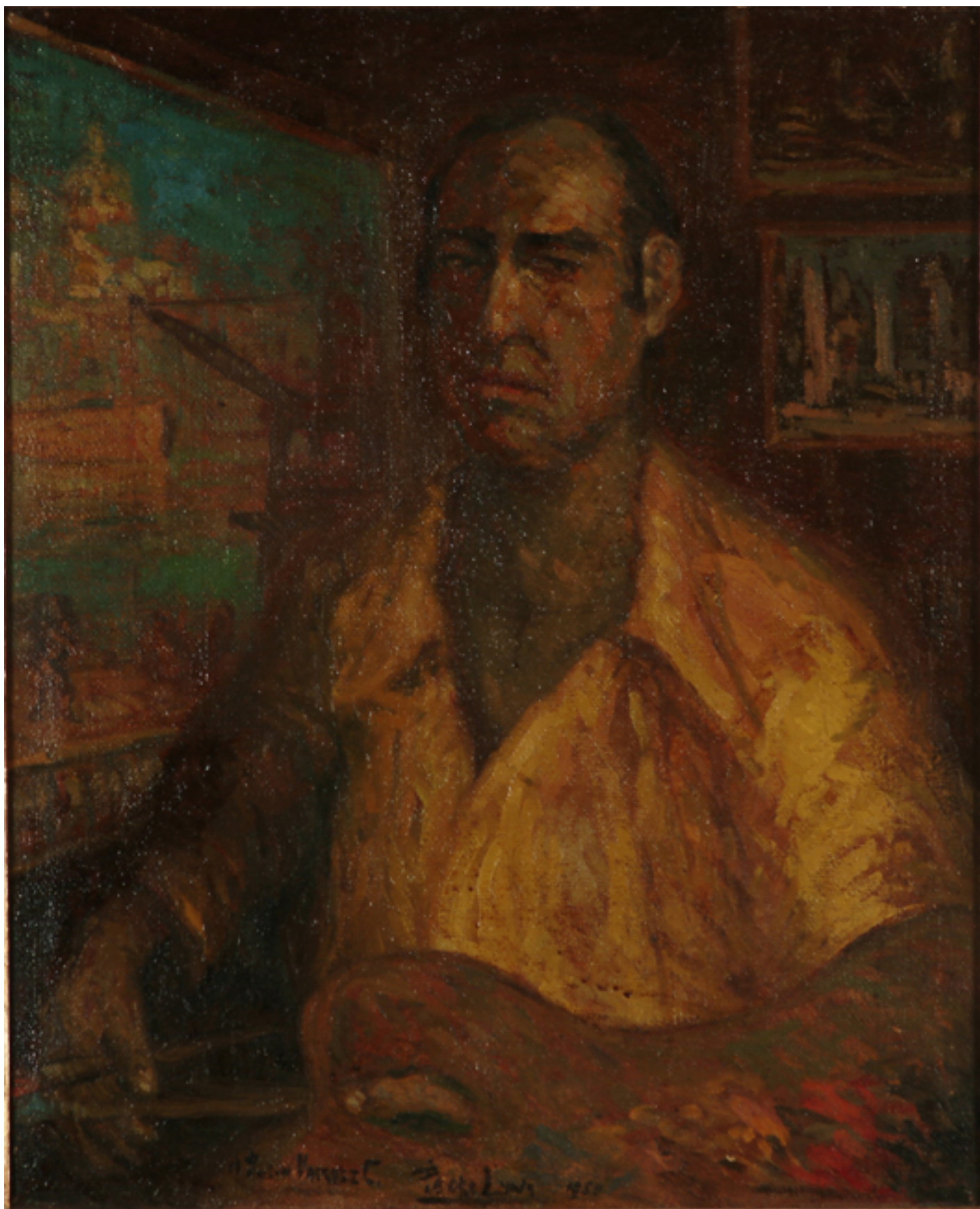
AUTORRETRATO CON BLUSA AMARILLA