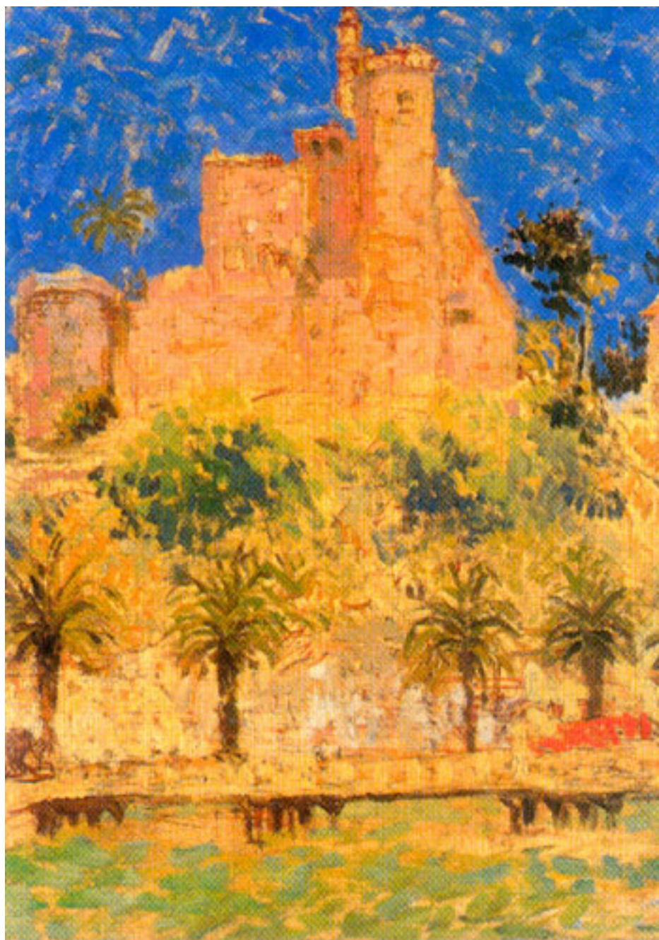
CASTILLO DE YARUR