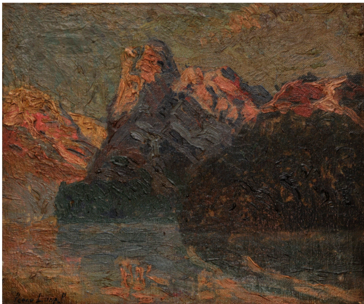
CANAL DE MAGALLANES, A. INGLESA