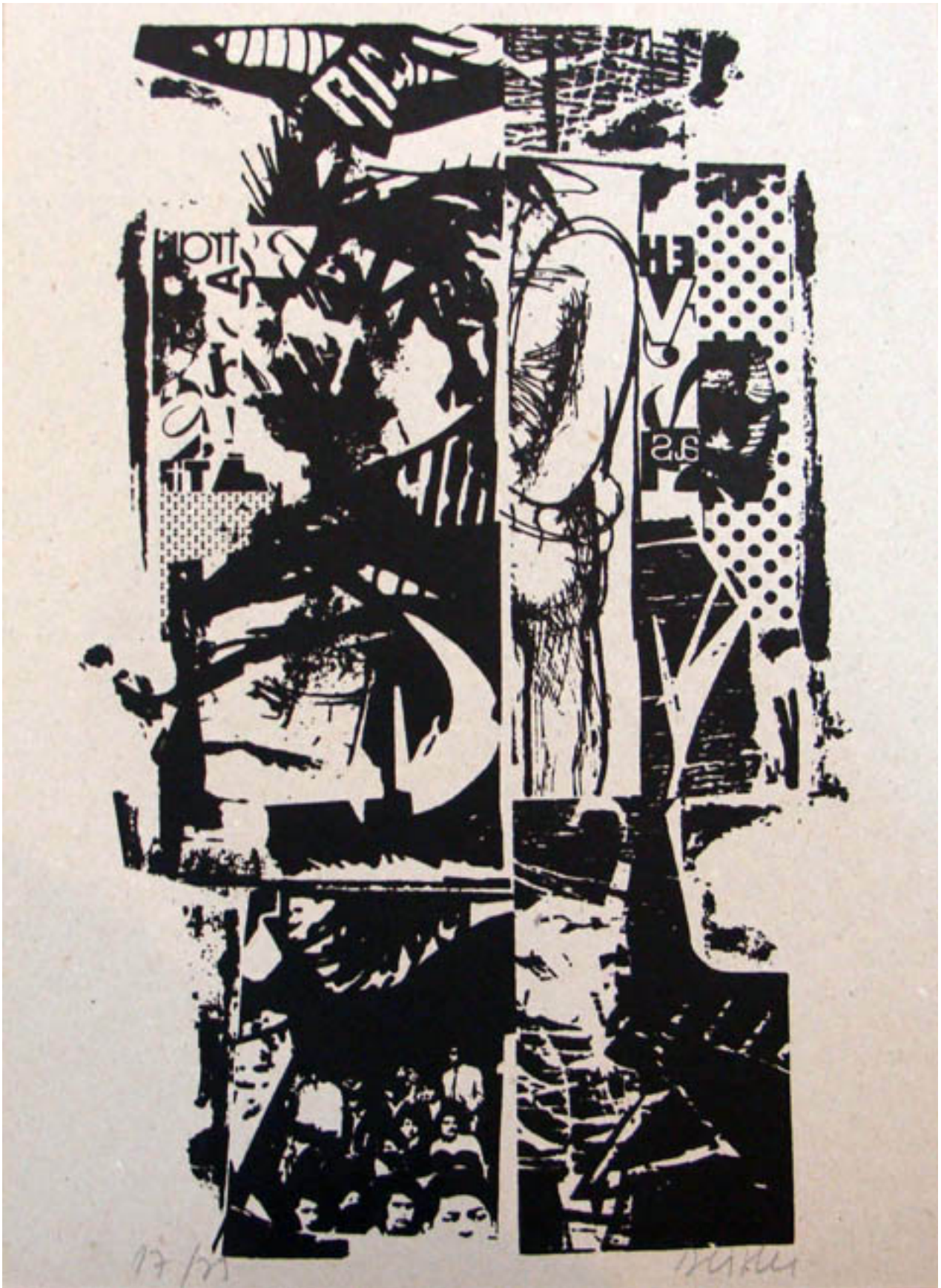
POESÍA GRÁFICA (GRAFISCHE POESIE)