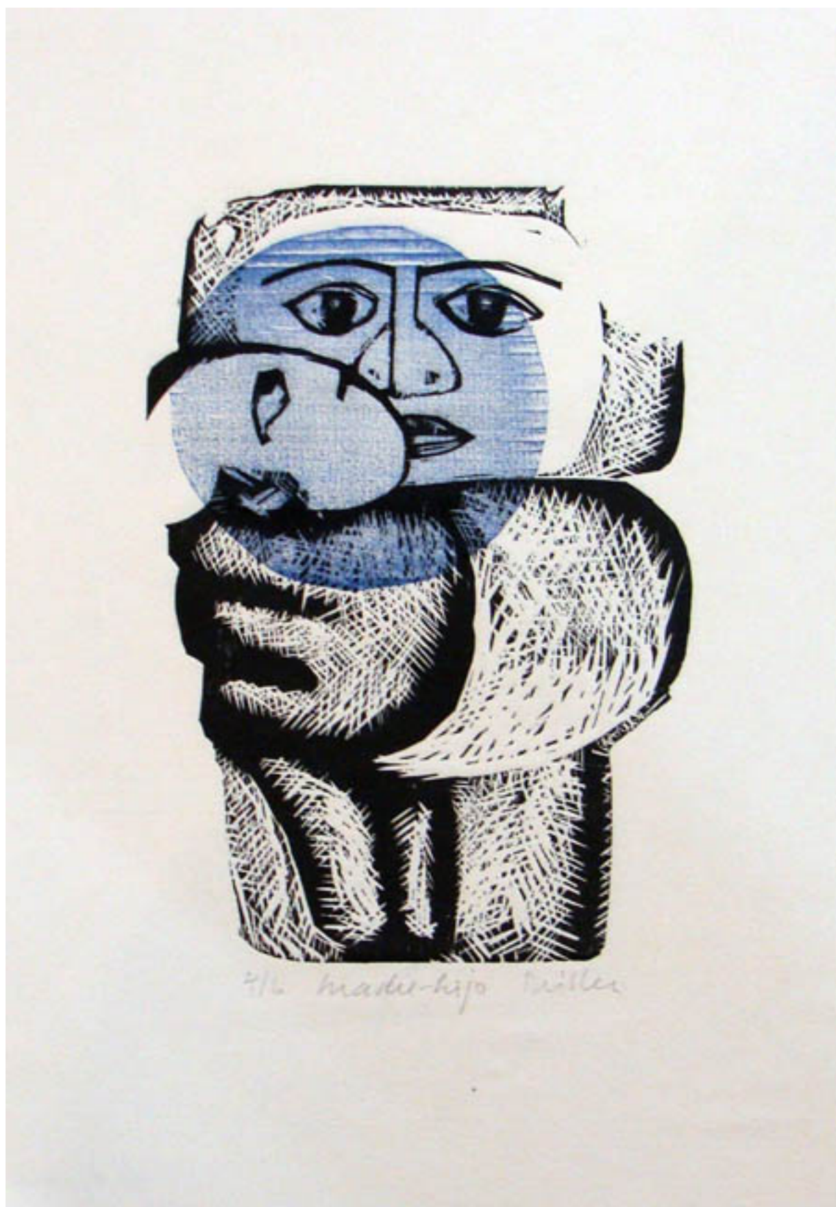
MADRE E HIJO