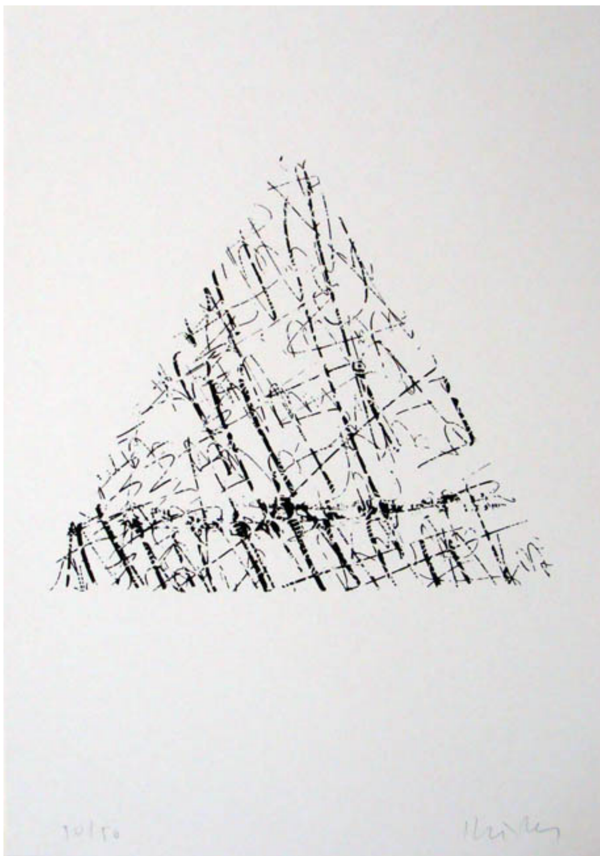
DE LA SERIE POEMAS FIGURADOS (AUS FIGUREN GEDICHTE)