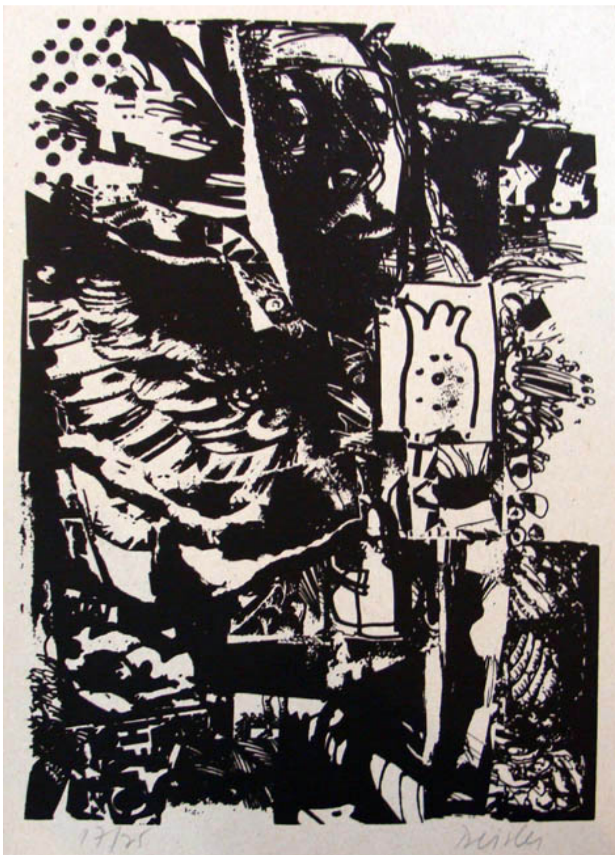
POESÍA GRÁFICA (GRAFISCHE POESIE)