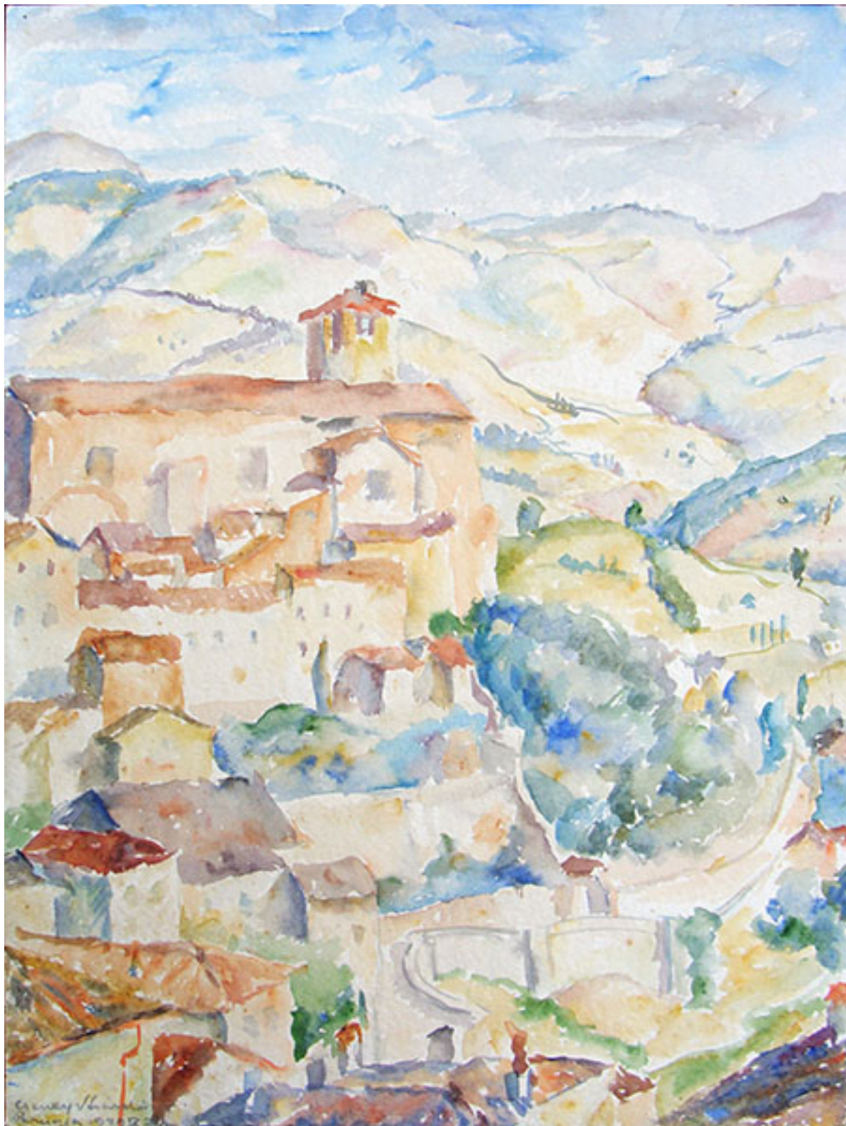
PAISAJE DE PERUGIA

BIBLIOTECA/MNBA. Colección de Artículos de Prensa del Artista LADISLAO CHENEY publicados en los diarios y revistas entre 1933-2010.