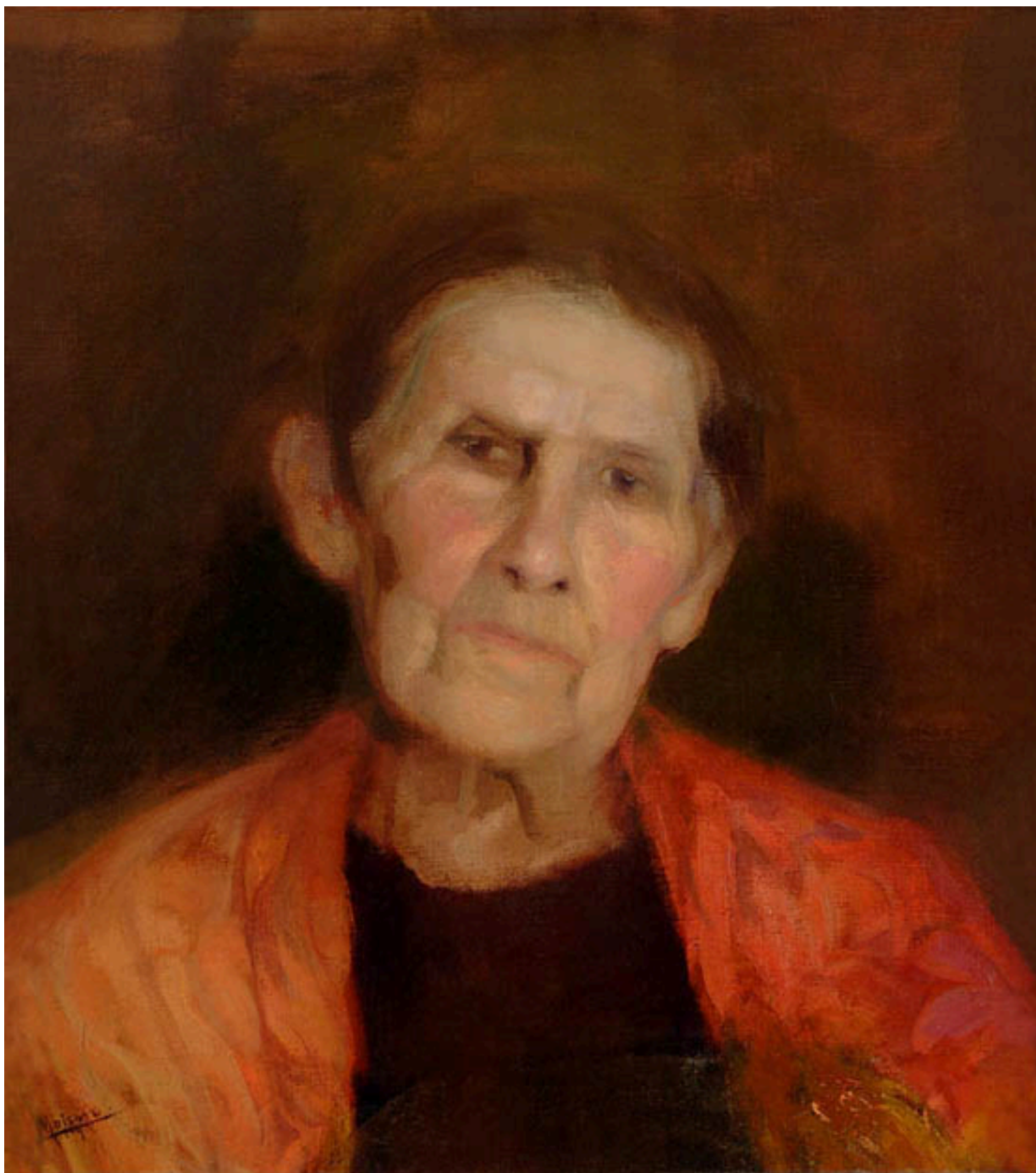
CABEZA DE VIEJA