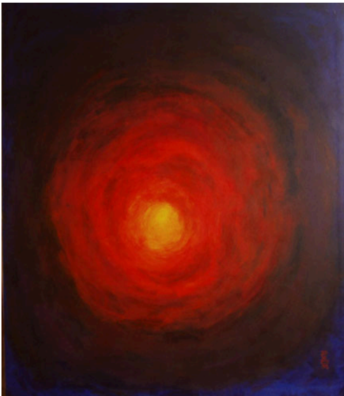
HACIA LA LUZ