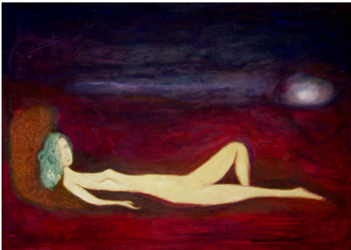
BAJO LA LUNA