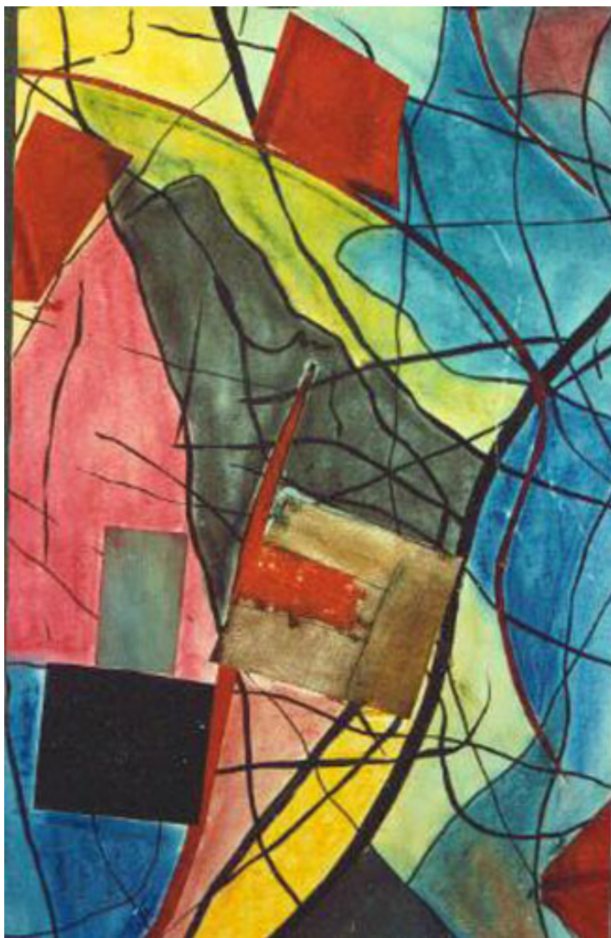
COMPOSICIÓN EN TRÁNSITO