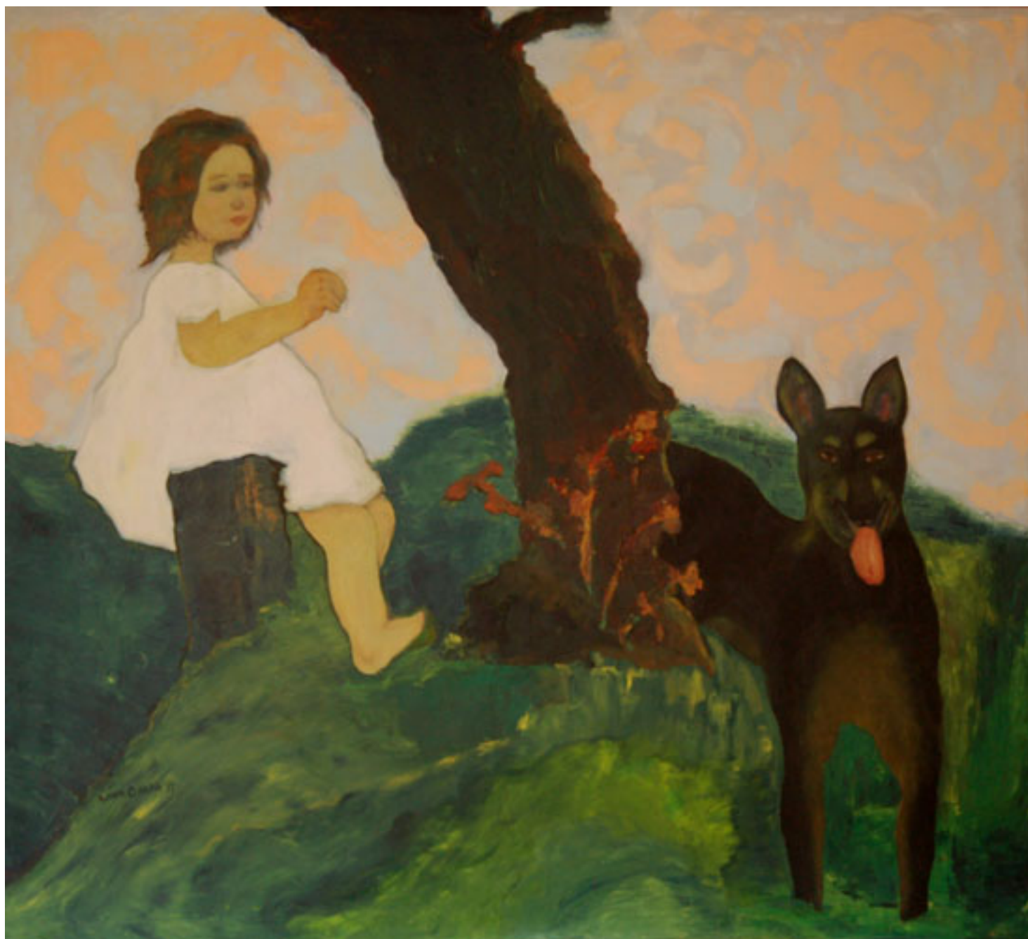
NIÑA EN EL JARDÍN CON EL PERRO