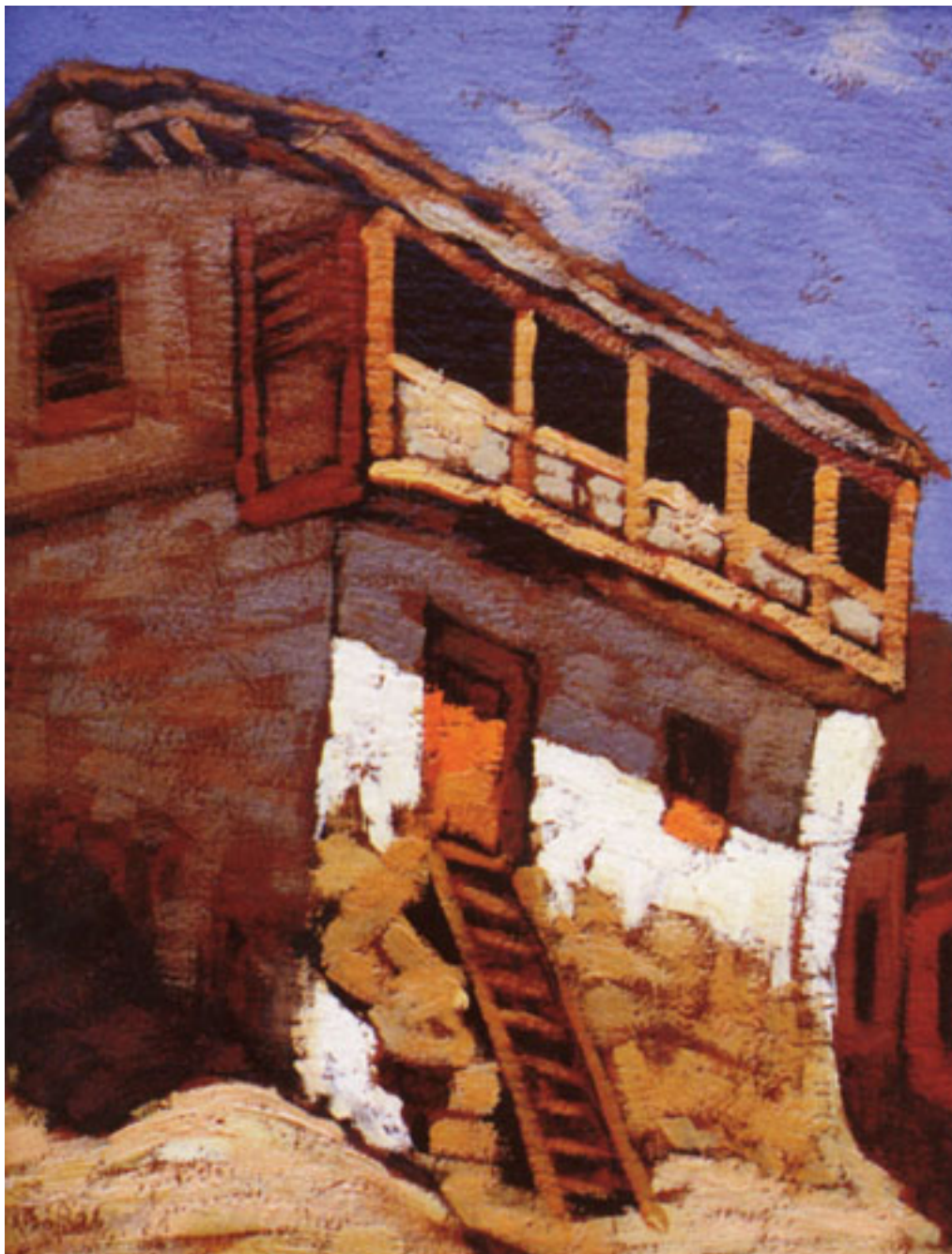
EL CHALET PICANTE