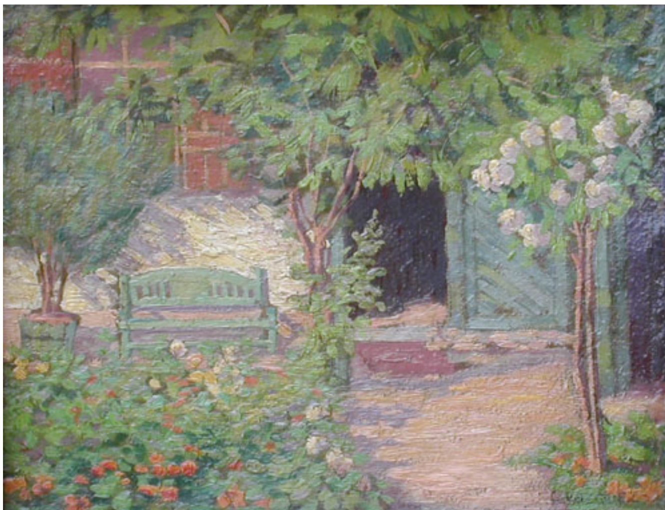
JARDÍN EN PRIMAVERA

VILA WALDO. Una Capitanía de Pintores. Santiago: Editorial del Pacifico, 1966.