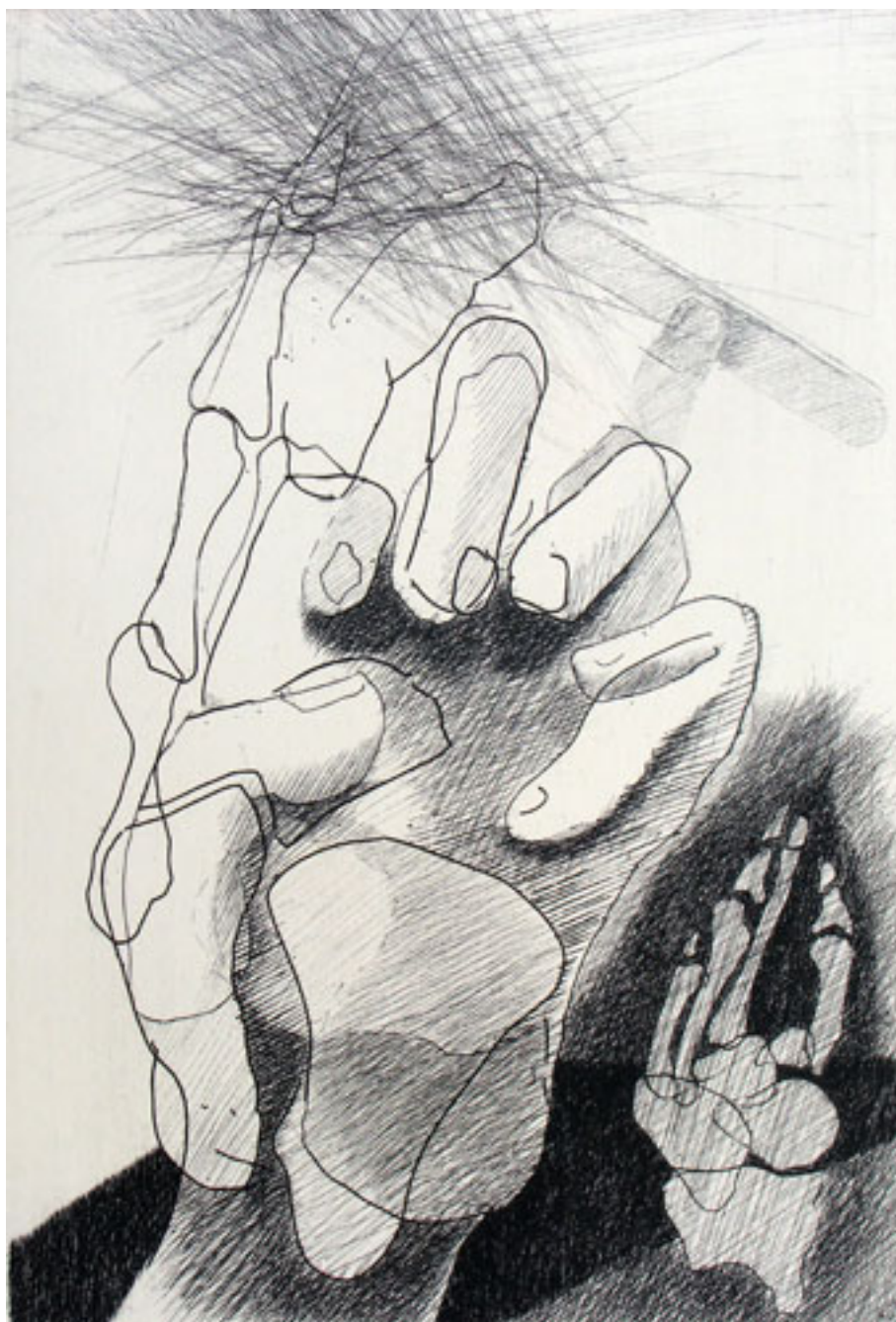
MANO 3, DE LA SERIE CONVERSIÓN