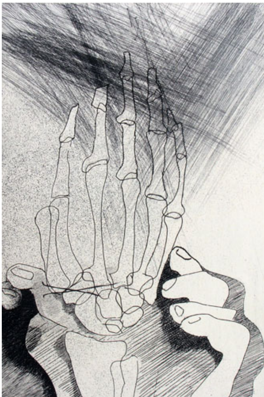
MANO 2, DE LA SERIE CONVERSIÓN