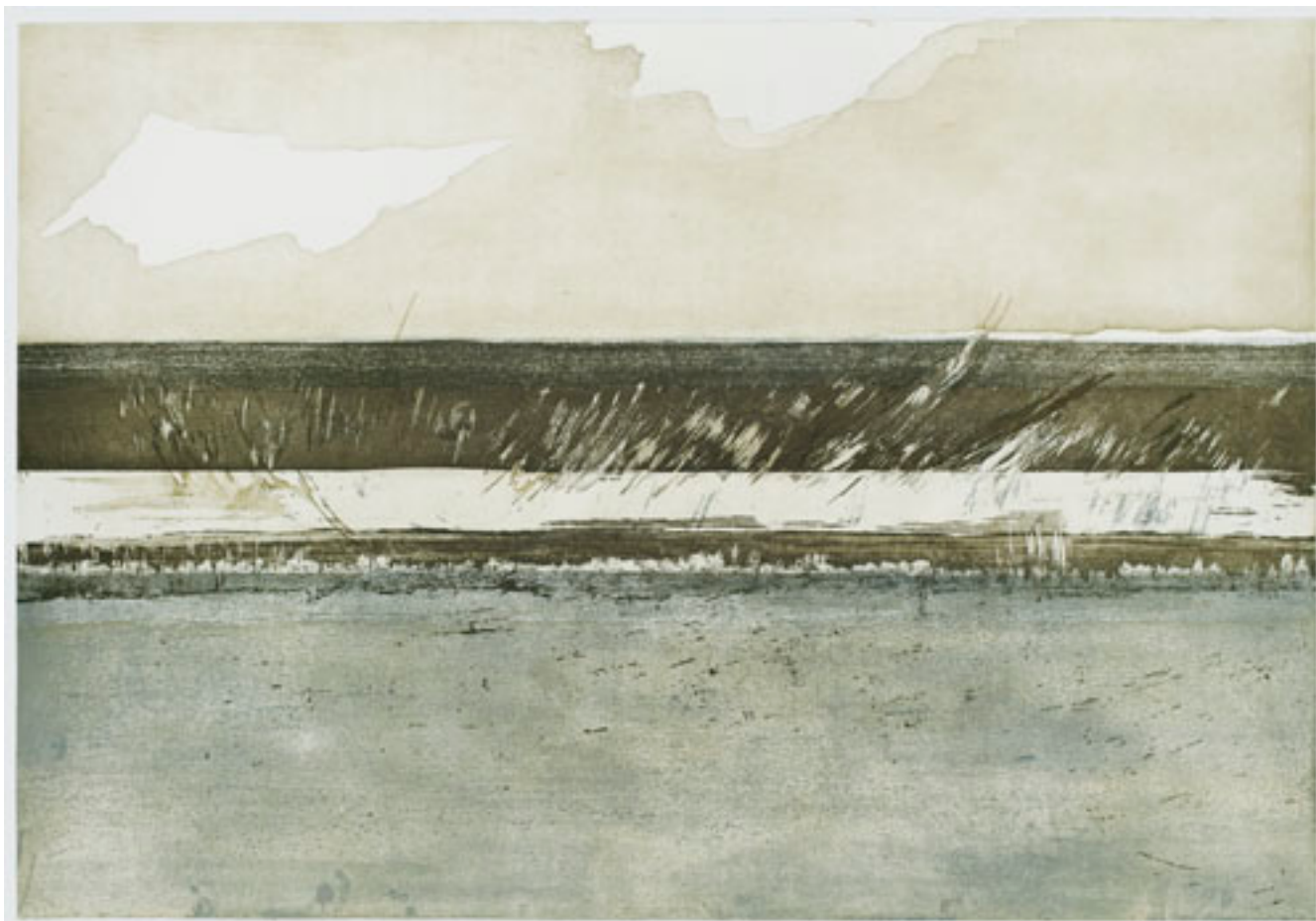
DE LA SERIE ALUMBRAMIENTO IV