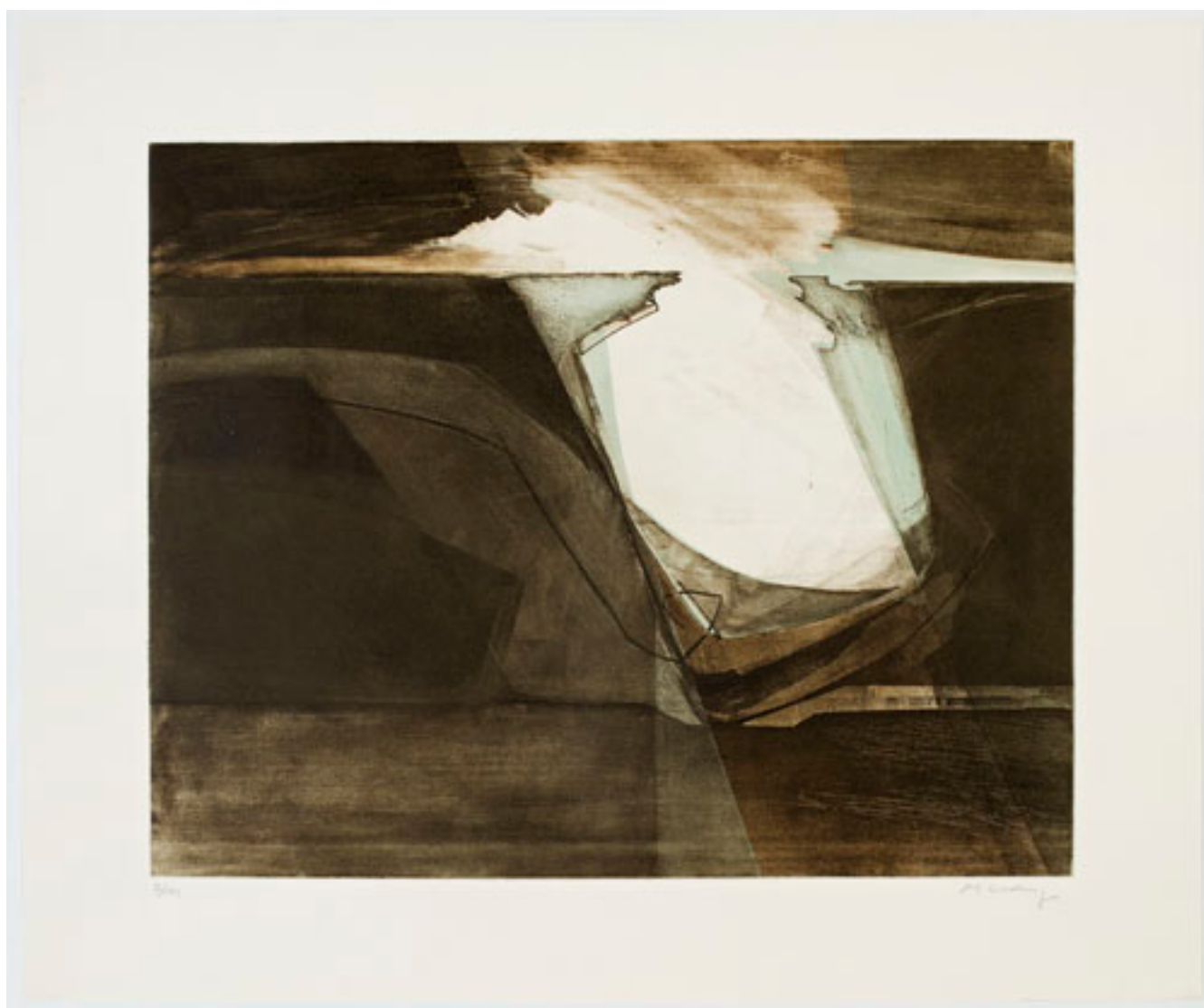
DE LA SERIE ENTRE SOMBRAS