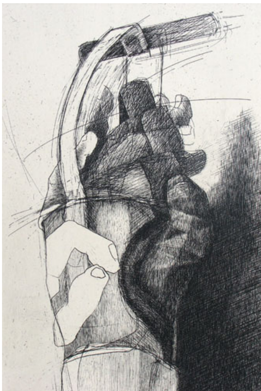
MANO 1, DE LA SERIE CONVERSIÓN

(Imágenes de obras entregadas y autorizadas por la artista, 09/03/2012)