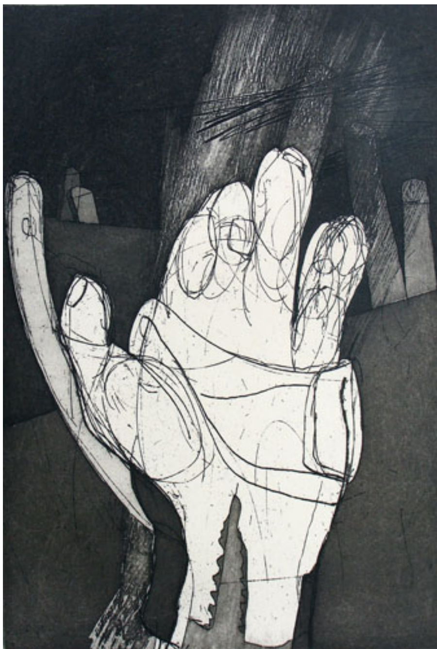
MANO 4, DE LA SERIE CONVERSIÓN