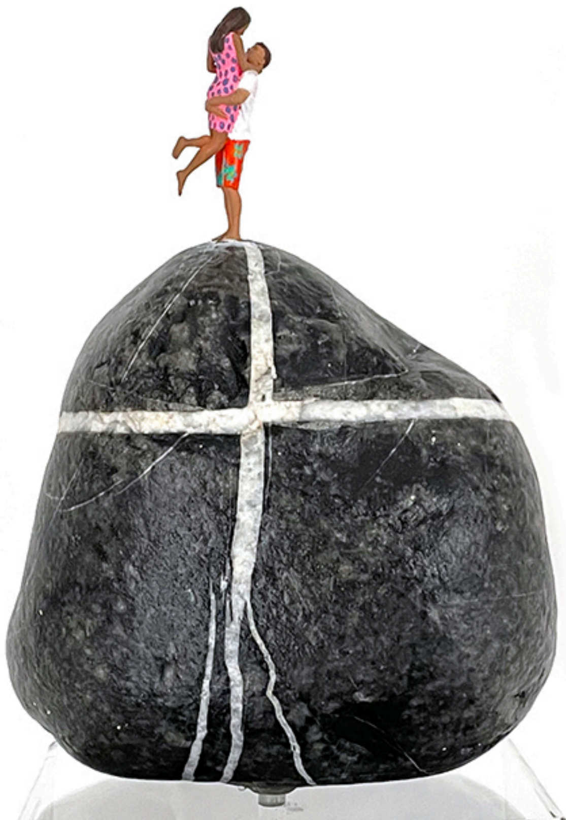
Amor en la cima