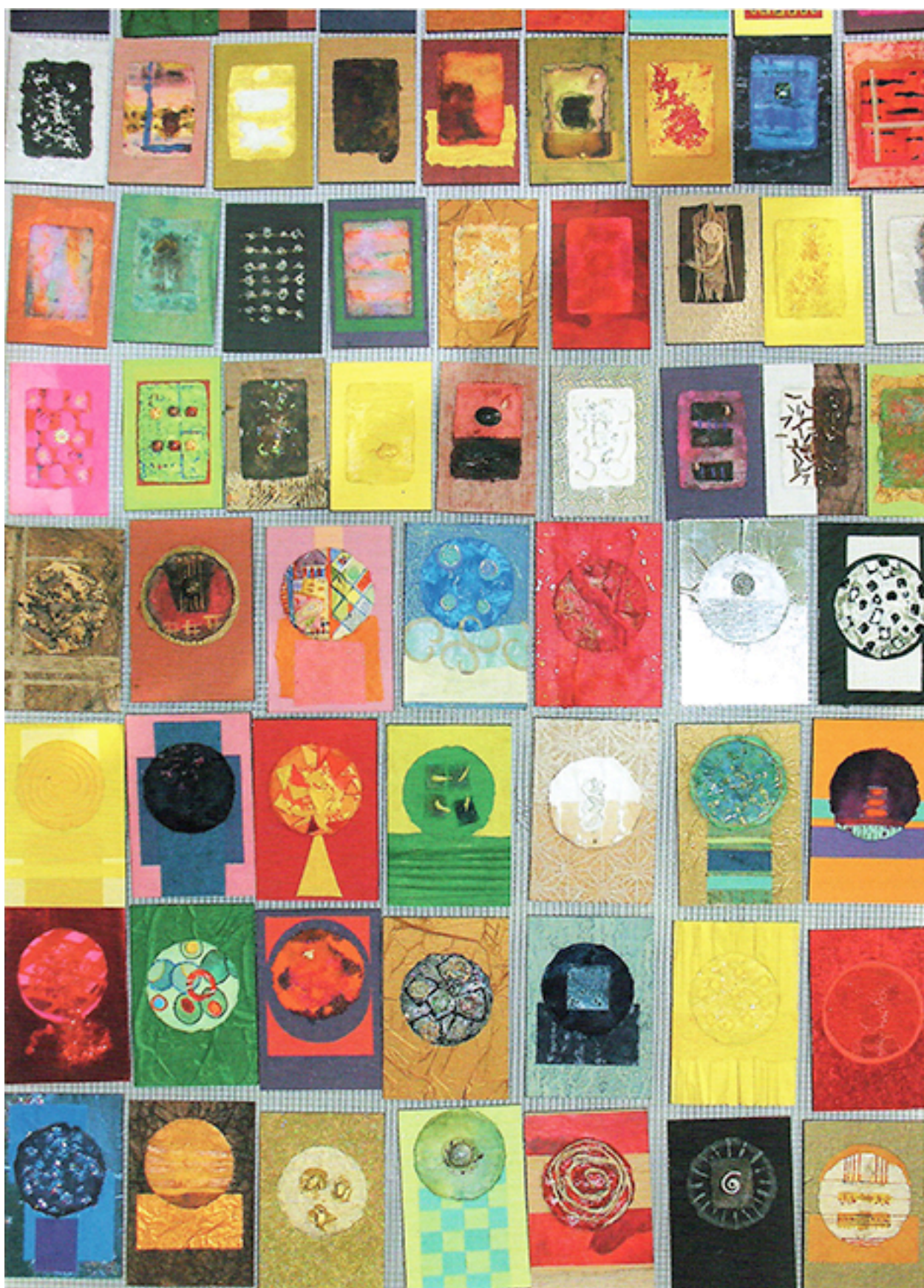
Pequeños mundos de papel