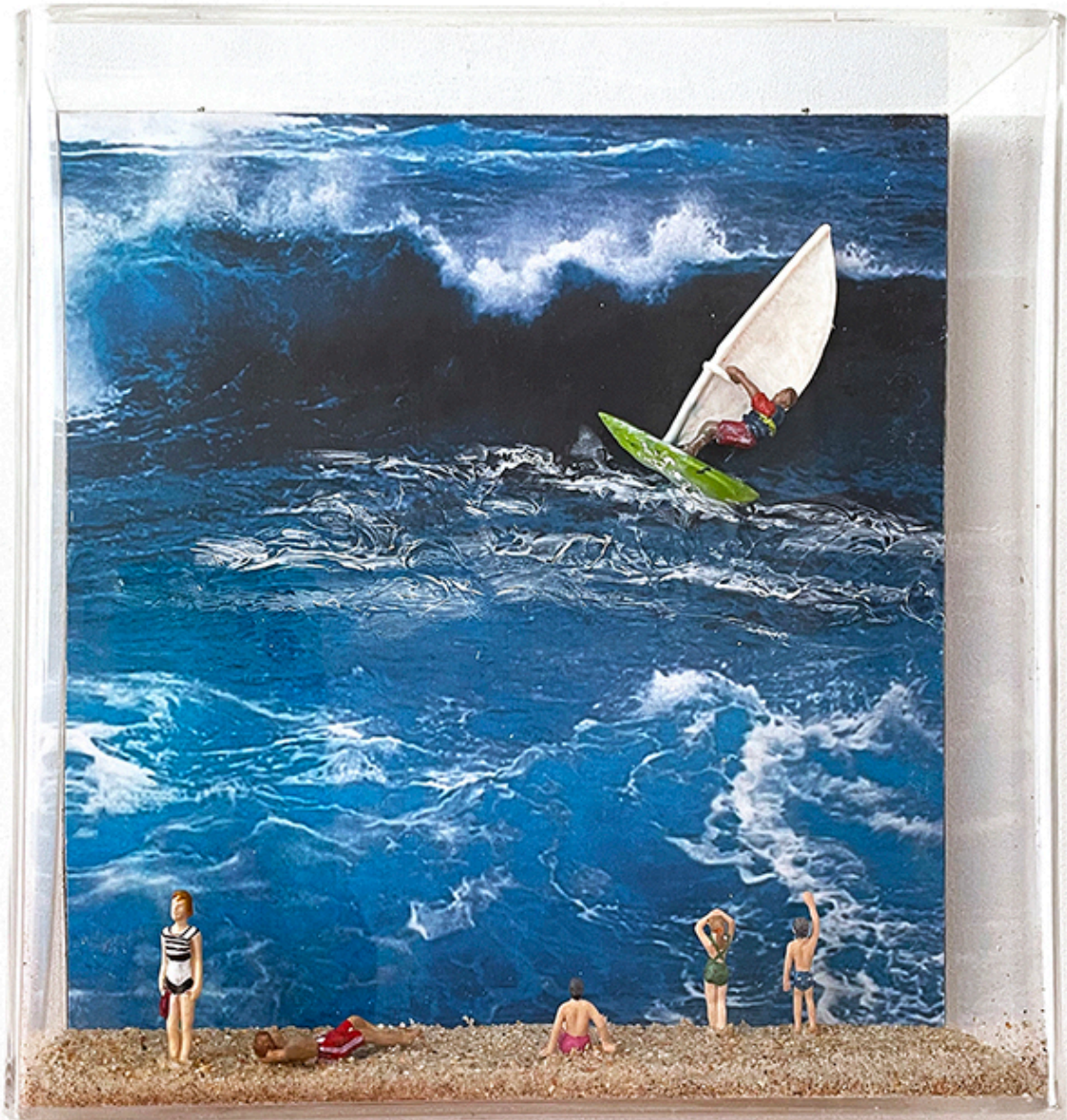
Mar de Chile