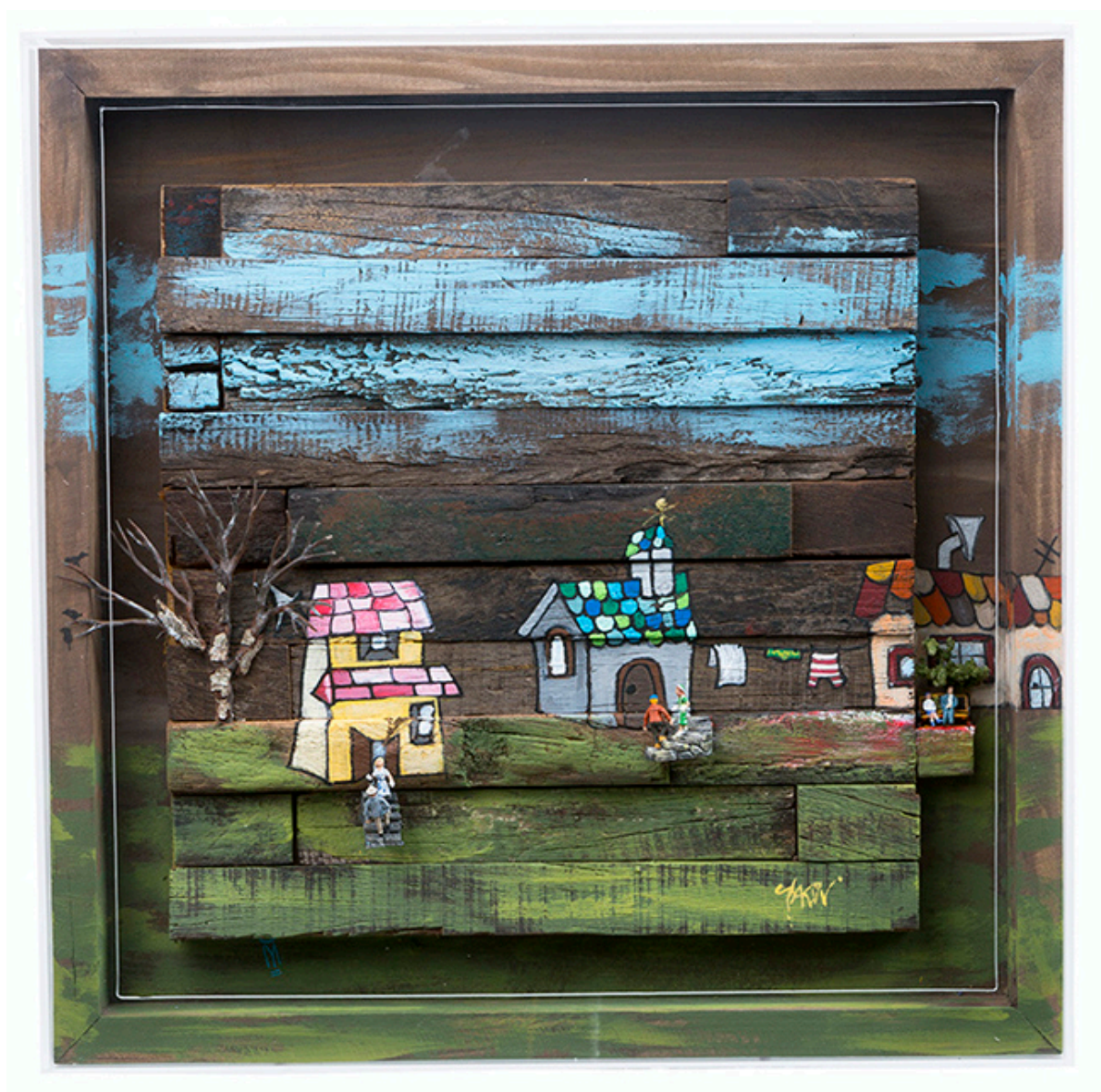
Sur. Serie maderas