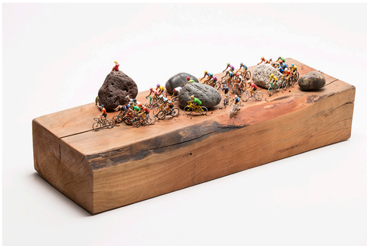
Historias de ciclistas