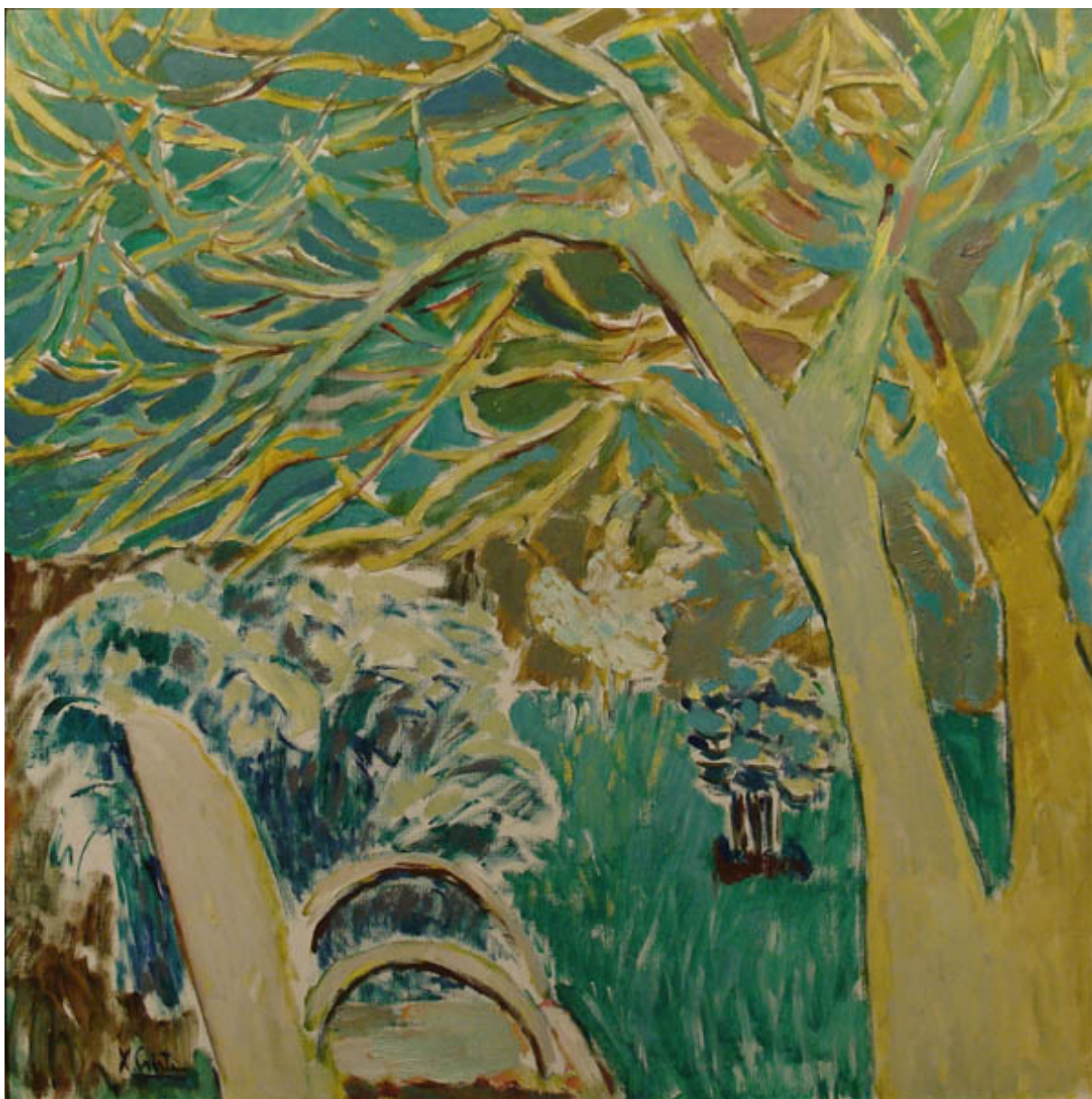
EL ÁRBOL DEL JARDÍN