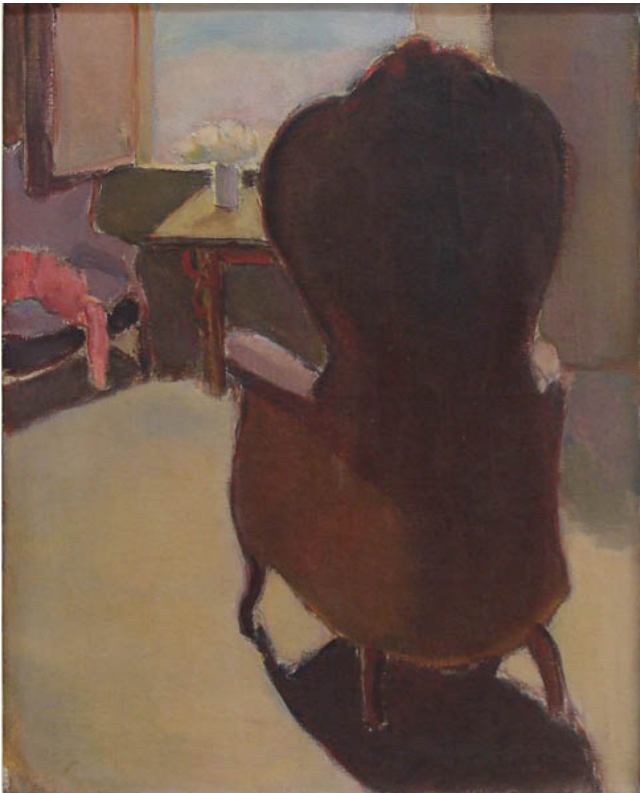
SILLÓN DE ESPALDAS