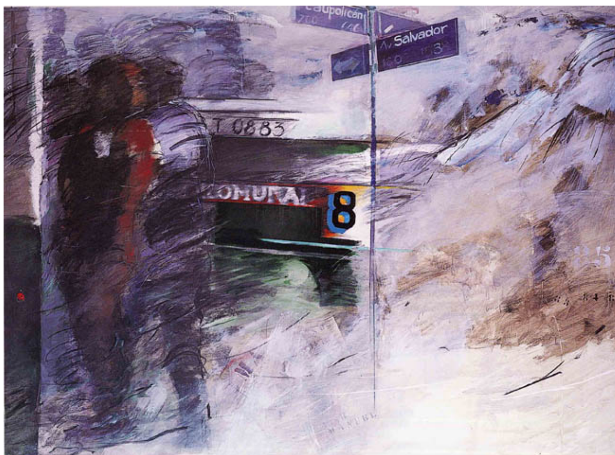
Caupolicán con Salvador