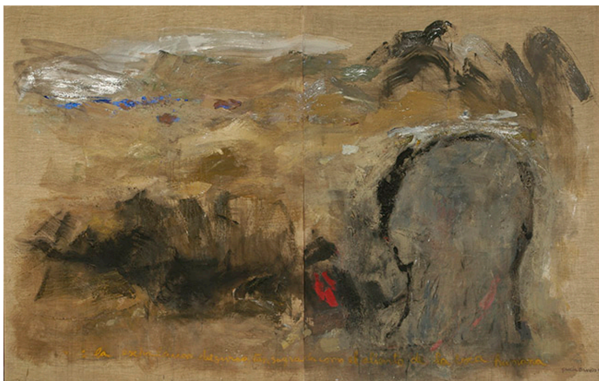
La exhalación del surco